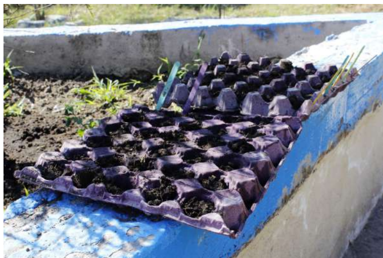
Figura 3. Semilleros realizados en clase.

Salimos al jardín, los reuní para explicar cómo debían hacer la mezcla del sustrato para que cada equipo hiciera su mezcla y rellenaran sus semilleros, para después agregar sus semillas. Compartí semillas con aquellos que no traían o querían de otro tipo; muchos de ellos llevaron papa, chile, maíz, naranja y algunas flores. Una vez que rellenaron sus semilleros les pusieron nombres con los abatelenguas.