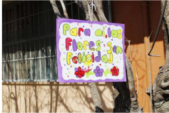
Figura 11. Para mí las flores son felicidad.