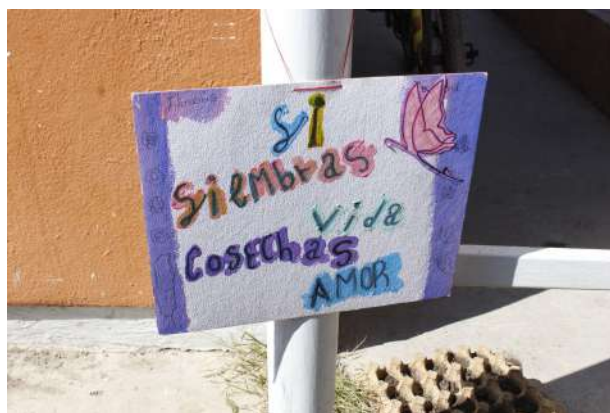
Figura 9. Si siembras vida cosechas amor.