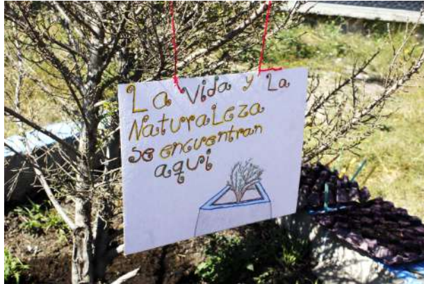
Figura 8. La vida y la naturaleza se encuentran aquí.