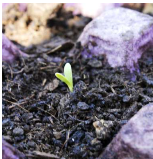
Figura 6. Primer brote.

En cuanto al jardín, mi plan para la clase era preparar las jardineras basado en el número de semillas que tenían, pero justo cuando salimos al jardín hicieron el llamado a la plaza cívica para iniciar el evento de día de muertos. Así que fueron a formarse y me invitaron a quedarme al evento, me quedé un momento en el evento, hubo concurso de calaveras literarias y una kermés. Al menos un equipo mencionó entusiasta que ya tenían un primer brote.