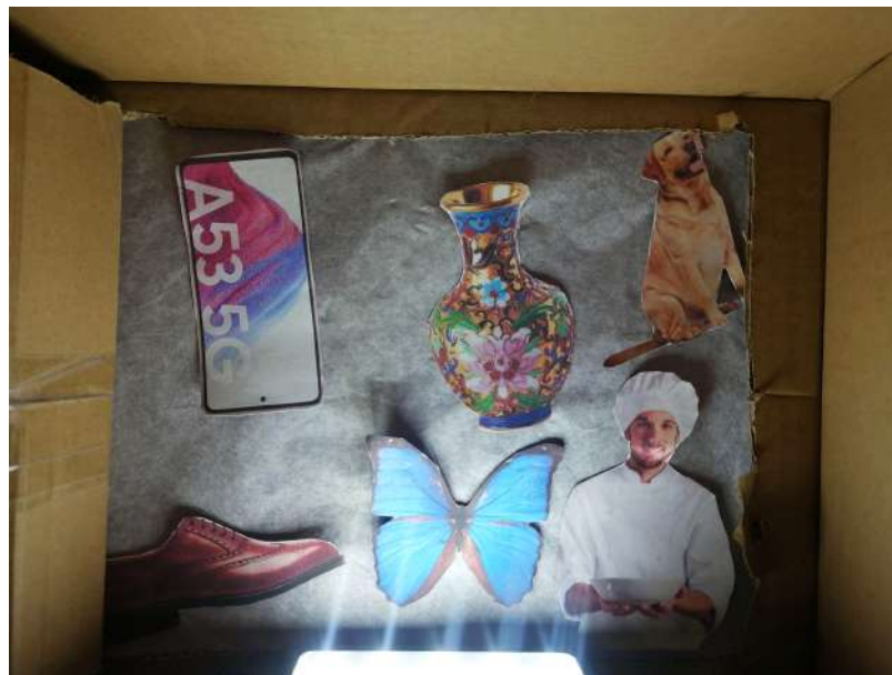
Figura 5. Revelación de las siluetas para la actividad de la caverna de Platón.

Mientras les platicaba la historia de la caverna de Platón y los esclavos condenados a tratar de comprender el mundo solamente a través de sombras, encendí la lámpara y proyecté las figuras preguntando qué era lo que veían como si ellos fueran los esclavos de los que habla Platón. Entre las figuras proyectadas había una mariposa, un chef, un zapato, un perro, un celular y un jarrón. Algunas muy obvias las adivinaron sin