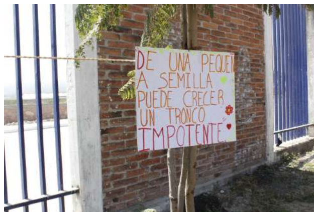
Figura 10. De una pequeña semilla puede crecer un tronco impotente.