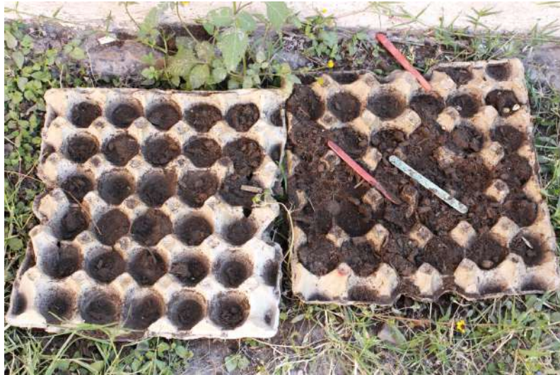
Figura 7. Semilleros destruidos por los perros.

En esta sesión no hubo momento previo filosófico, pues salimos primero al jardín a revisar y acomodar los semilleros que habían preparado antes. Tristemente todo nuestro avance se vió interrumpido porque la noche anterior algunos perros se metieron a la escuela y destruyeron muchos de los semilleros.