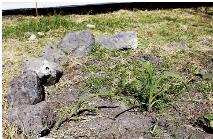
Figura 14. Planta de maíz. Fotografía tomada al final del curso.

En el siguiente capítulo explicaré los tres argumentos a los que llegué durante el proceso de este proyecto, en búsqueda de responder a la pregunta principal: ¿De qué manera el cuidado y cultivo del jardín es un estímulo para los jóvenes que permite la reflexión filosófica sobre sí mismos y el entorno?