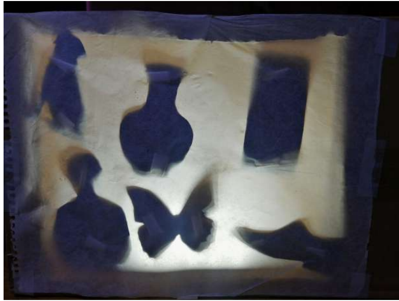
Figura 4. Siluetas para la actividad de la caverna de Platón.