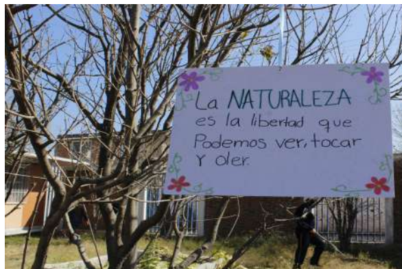
Figura 12. La naturaleza es la libertad que podemos ver, tocar y oler.

Después de colocar sus carteles empezamos a trabajar en la preparación de sus jardineras; para ello había que remover la tierra y agregar sustrato, humedecer un poco y después agregar los brotes, pero como la mayoría de los brotes se perdieron plantamos directamente las semillas, esperando que alguna lograra crecer. Esa sesión fue de las más largas y cansadas, pues nos llevó más tiempo de lo esperado y todo el rato tuvimos que estar acarreado agua desde una llave no muy cercana; teníamos que picar la tierra y quitar mucha maleza, fue realmente agotador. Para algunos equipos fue más complicado por el área en la que estaban, pues tenían mucha maleza o el terreno era muy duro y la tierra poco fértil.