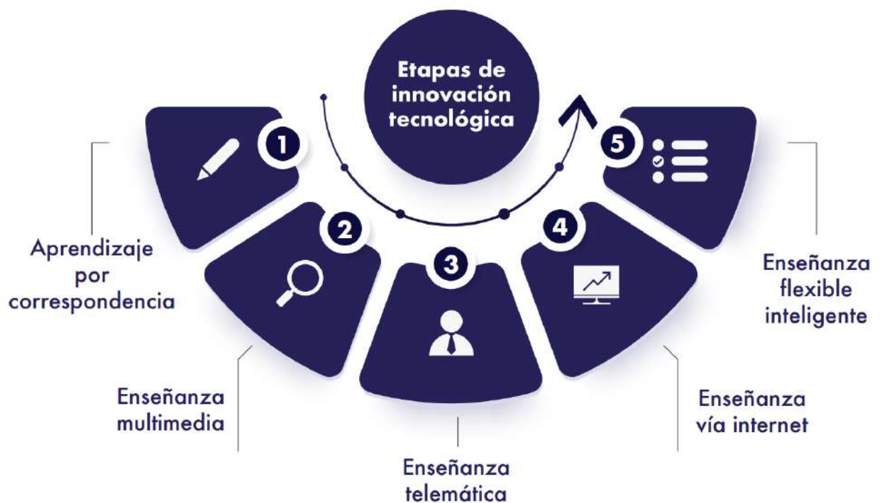
Figura 1 Etapas de innovación tecnológica.

La educación a distancia es un modo de enseñar y aprender para millones de personas durante cerca de 150 años. Así, existen tres grandes etapas de innovación tecnológica que Garrison (1985) identifica como: correspondencia, telecomunicación y telemática (ya superadas ahora), pero sirven como base para entender el fenómeno a distancia. Se agregan otras dos más recientes que son la enseñanza vía internet y el aprendizaje flexible inteligente para completar el panorama (Figura 1).