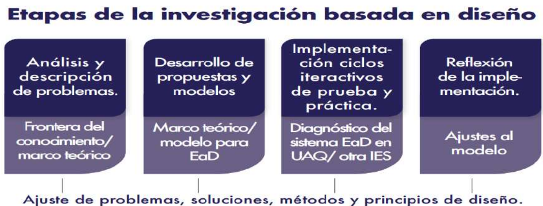
Figura 7 Etapas de la investigación basada en diseño

El paradigma de la Investigación Basada en Diseño surgió de la carencia de impacto de la investigación educativa sobre el sistema educativo, y se enfocó en el desarrollo y evaluación sistemática de intervenciones en contextos educativos reales, contrario a la investigación en condiciones puras de laboratorio (Crosetti & Salinas Ibáñez, 2016). Este método funciona mediante ciclos iterativos, que son repetidos cuantas veces sea necesario o pertinente, a juicio del investigador. Adaptado de Reeves (2006).