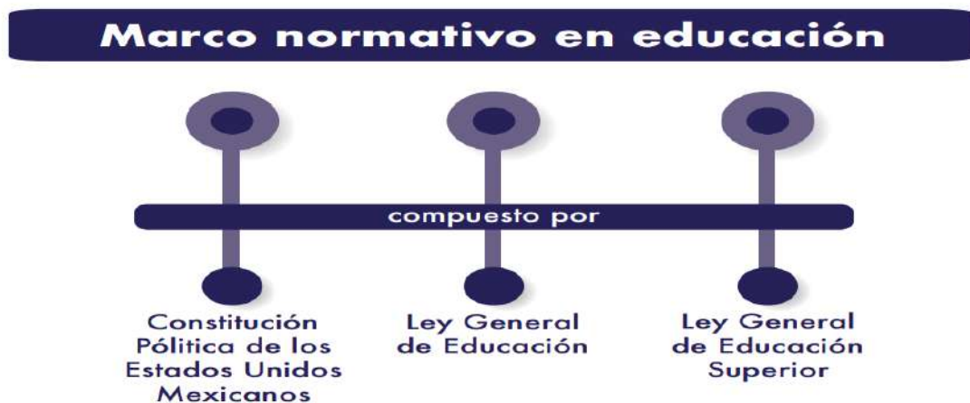
Figura 2 Marcos normativos en educación.

Respecto al marco normativo, el concepto “Normativa” se define como un conjunto de normas, reglas o leyes establecidas dentro de una organización. Una normativa es un grupo de normas aplicables en una materia específica y una norma es un precepto jurídico que regula la conducta de una persona en sociedad (Normativa, 2020) (Figura 2). En esta sección, se hará una breve revisión de los cuerpos legislativos que abordan el fenómeno educativo en México, que fueron seleccionados por su pertinencia en contenidos respecto a la temática de marcos normativos para educación superior a distancia.