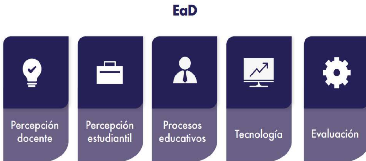
Figura 5 Elementos que integran a la EaD.