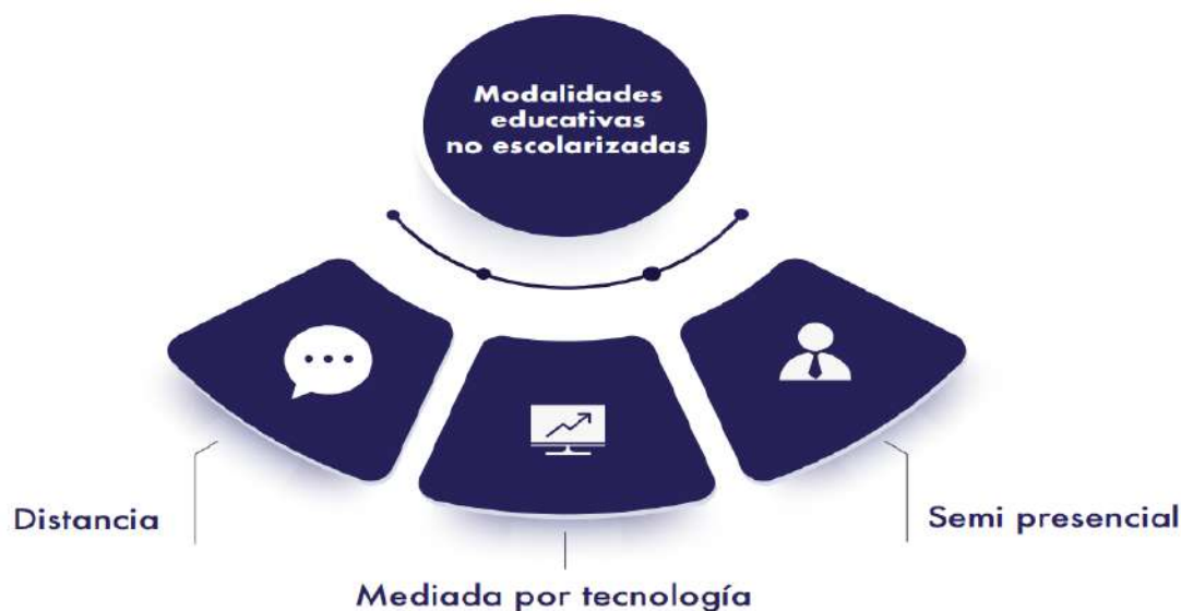
Figura 6 Modalidades educativas no escolarizadas

Los modelos educativos a distancia surgieron como una posible solución a los problemas de cobertura y calidad relacionados con un número creciente de personas que intentan beneficiarse de los avances científicos, técnicos y pedagógicos alcanzados por ciertas instituciones, pero que eran excluidos por su ubicación geográfica o por los altos costos a sufragar, producto del desplazamiento a esas instituciones (Castillo et al., 2017).