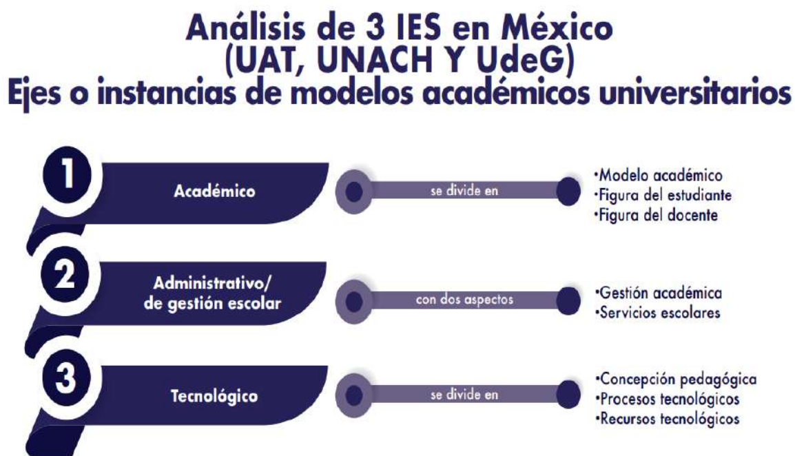
Figura 8 Elementos de análisis para construir un modelo de EaD.

Las categorías y subcategorías presentadas en esta ilustración derivan de los resultados del análisis documental realizado sobre tres universidades públicas