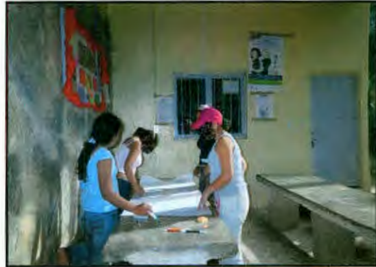
Imagen 25: Dinámica Cuerpo de hombre y cuerpo de mujer

En los otros postik, de diferente color, se pide anoten aspectos respecto a las enfermedades que tienen hombres y mujeres jóvenes según el caso, es decir, ¿cuales son las enfermedades mas frecuentes que tienen las y los jóvenes, en donde las manifiestan.?. Estas etiquetas se colocaron dentro de la silueta, en cada parte del cuerpo donde se manifiesta la enfermedad.