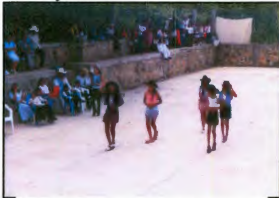
Imagen 14: La graduación de la primaria como ritual para ser considerada/o mayor.

Dicen que todas las que se van al molino tarde o temprano se embarazan y con cierta razón. Al pasar en la noche por el molino se escuchan murmullos y risas, y por la mañana se pueden encontrar sobres de condones abiertos y condones usados, seguramente de alguna pareja que tuvo la posibilidad de obtenerlo. Por este motivo, los habitantes