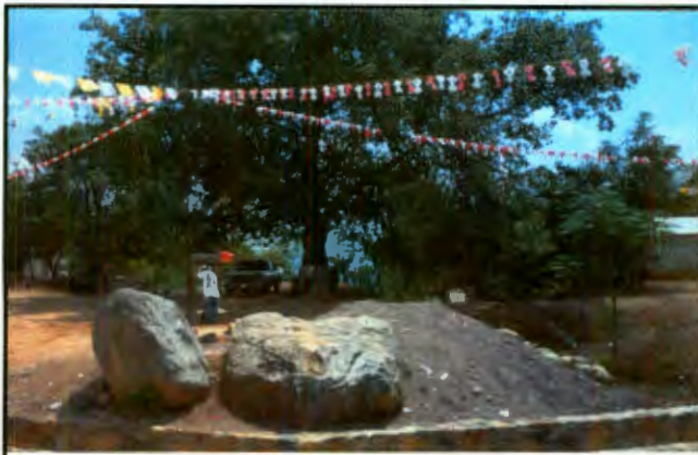
Imagen 7: Las piedras, el pozo y el único álamo. Identidad cultural

La tormenta hizo rodar piedras grandes en el fuerte cause que llevaba el arroyo y dejando a un costado del pozo principal, 2 piedras grandes que nadie pudo mover. Para la población fue una señal para que se dejaran en el sitio, a modo de "ejemplo para las familias" y que éstas recuerden a las 2 familias que fueron castigadas por discutir y golpearse. Es un simbolismo para la población porque el día estaba soleado, cae la tromba repentinamente y se lleva precisamente a las personas que discutían.