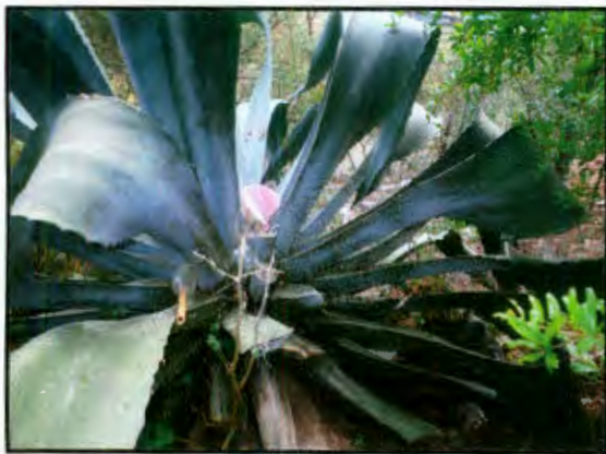
Imagen 6: El maguey, elemental para la vida serrana

Asimismo, la alimentación y producción en la localidad se complementa con los frutos abundantes como el aguacate, naranja, lima, limón agrio y dulce,