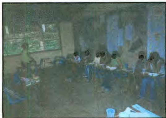
Imagen 30: Colocación del condón femenino

Por ultimo se explico el preservativo femenino y masculino, para lo cual se repartió un preservativo a cada una y se les invito a conocerlo paso por paso para su buen uso. Se hizo una dinámica en la que una voluntaria demostró como supone que debe utilizarse un preservativo masculino. De manera general ninguna conocía como utilizarlo, desde como abrirlo y desenrollarlo en el modelo que utilizamos (plátano), allí nos dimos cuenta que las 2 participantes de 12 años no sabían que es una erección, por lo que fue necesario aclarar como se va dando la excitación en el hombre y los cambios que manifiesta en su