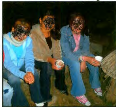
Imagen 18: Conviviendo por la noche