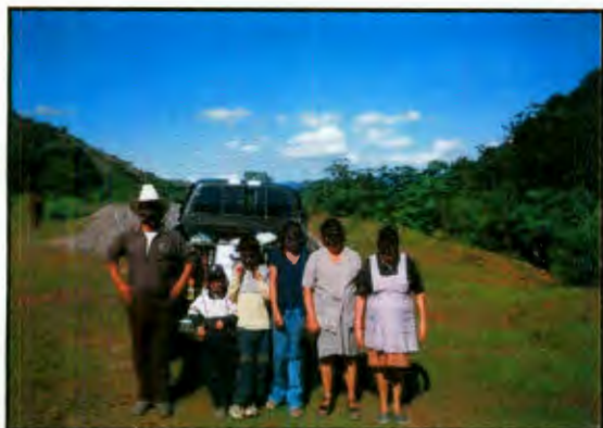
Imagen 13: Familia de El Paraíso

Respecto al uso de pantalones o faldas, las mujeres adultas prefieren no utilizar pantalón porque están acostumbradas a hacer sus necesidades biológicas en cualquier lugar y la falda cubre las partes que moralmente no deben mostrarse mientras hacen sus necesidades (glúteos, piernas, genitales). Por otro lado, comentan que los hombres adultos de la comunidad se les quedan