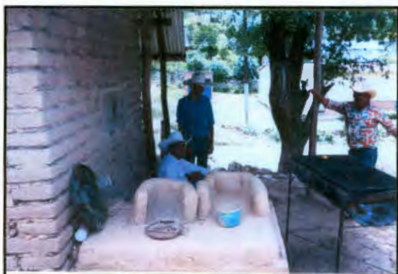
Imagen 8: Estufa de barro fuera del hogar

El Grupo Ecológico Sierra Gorda brinda hace tiempo un apoyo para las estufas ecológicas, a la par que las letrinas en seco. Estas estufas fueron