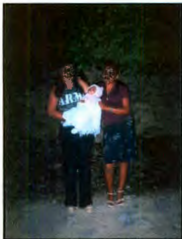
Imagen 12: Madre adolescente con amiga

Como ya se señaló, es común desde tiempos pasados el que las mujeres se han embarazado siendo menores de 18 años, por las condiciones propias de la zona rural. Doña Tacha se embarazó a los 17 años y se junto con su novio, tuvo 13 hijos "nada más" comenta ella. Su hija Marisela se junto a los 14 porque salió embarazada y a sus 16 años tiene ya 3 hijos. Con este ejemplo, se puede analizar un continuo en la familia para comenzar la vida reproductiva a partir de la etapa adolescente, sin embargo, con el apoyo de la medicina, la vida sexual activa puede dejar de ser un riesgo de embarazo teniendo la información necesaria.