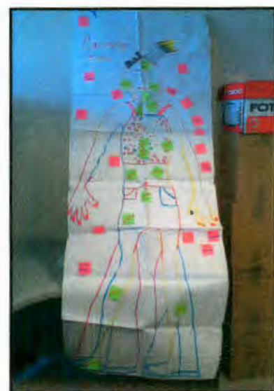
Imagen 26: "Carmela"

Su silueta la trataron de hacer más delgada que la modelo por considerar que debía ser más estética. Carmela esta vestida con un pantalón acampanado, blusa de tirantes con estampado de bolitas, muestra su ombligo, tiene uñas pintadas, esta maquillada. Lleva puesto collar y aretes de acuerdo a la moda y esta peinada con el cabello recogido. No tiene marcas de genitales ni pechos.