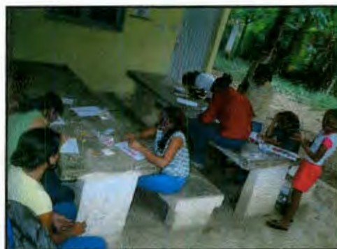
Imagen 31: Trabajo con plastilina

Se les hablo también de cómo mantener su cuerpo sano teniendo higiene sexual, como una forma de prevenir ITS, mencionando los factores de riesgo que tienen como las parejas en una zona rural con características de migración.