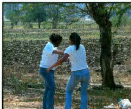
Imagen 20: Chicas bailando durangense

♪ "Aun puedo ver el tren partir y tu triste mirar esconde aquellas lagrimas, volveré, como podré vivir un año sin tu amor. La carta dice espérame, el tiempo pasara, un año no es un siglo y yo volveré, porque difícil es vivir sin tu amor...." -Volveré, K-Paz de la Sierra.