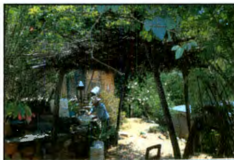
Imagen 4: Enramada frente al hogar

Para contextualizar el espacio queretano serrano, retomo la obra " Los pobres del campo Queretano " (Bohórquez, 2003) cuando se habla de que los productores campesinos de la sierra obtienen pocos ingresos de su producción y buscan mejores opciones de ocupación y empleo productivo, por lo que migran más que nada a los Estados Unidos. La migración es la mejor alternativa que tienen las familias para solucionar su situación económica, pero a su vez, genera un cambio sociocultural que trae