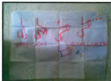
Imagen 29: Explicación grafica de la erección, eyaculación.

Retomando la dinámica "Historia de Amor", se resaltó la importancia de que conocieran que métodos existen, como funcionan y como se utilizan, para que tengan la información necesaria para decidir sobre su cuerpo y su salud reproductiva. También se hablo sobre los mitos de utilizar métodos y las dudas que tuvieron respecto a la vida sexual activa. Se utilizo material de apoyo como pastillas hormonales de 28 y 21 días, ampolletas mensuales y de 2 meses, parche hormonal, dispositivo intrauterino para nuliparas, y para mujeres que han estado embarazadas con forma de T y otro de brazos curvos, para éste, se explico detenidamente como se coloca, a solicitud de ellas. Los métodos definitivos como la vasectomía y la ligadura y OTB se explicaron gráficamente, al igual que los métodos naturales como el coito interrumpido, el ritmo, billing y temperatura basal.