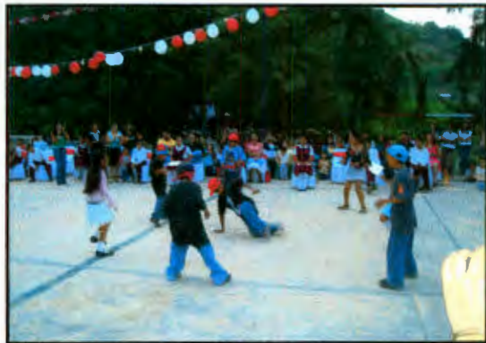
Imagen 15: Influencia de la migración en bailes infantiles.

Los adultos dicen que las mujeres que salen embarazadas desde chicas tampoco saben de modales ni valores, como ejemplo señalan que ellas "dan pecho a los bebés en cualquier lugar y siempre traen el pecho por fuera y no les da asco", refiriéndose al amamantamiento como una situación desagradable. Sugieren que la edad adecuada para que se inicie la edad reproductiva es a partir de los 20 años.