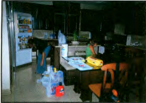
Imagen 23: Labores cotidianas en la cocina de los patrones.

Continuamos viendo todas las novelas de la programación. A las 9:30pm llego la "señora" quien se acerco a saludarme y a preguntarme mi origen y el motivo de mi visita y me ofreció su casa para cuando necesitara algo. Saludo a Diana y le dio las llaves de la camioneta Expedition a Primitiva para bajar