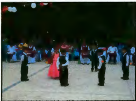
Imagen 19: Afirmando patrones de género

Las letras de las canciones tienen un fuerte impacto en la formación de concepciones respecto a la vida, y tiene tal impacto en las personas que influye en la transformación de comportamientos y expresiones, especialmente en las diversas formas de manifestar su sexualidad, en las formas de cortejo, en las relaciones de pareja y en las relaciones íntimas. La canción es utilizada como un medio para expresar las emociones y sentimientos hacia los otros y permite una mejor comunicación.