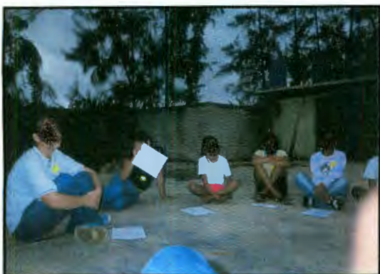
Imagen 28: Dinámica Historia de Amor

Esta segunda dinámica resulto ser muy divertida y rica en información. Consistió en dar información sobre una historia a la cual las participantes debían dar un desenlace aplicado a lo que han visto en la comunidad o lo que han vivido, demostrando su capacidad imaginativa influenciada por las historias de la televisión. La historia iniciaba así: