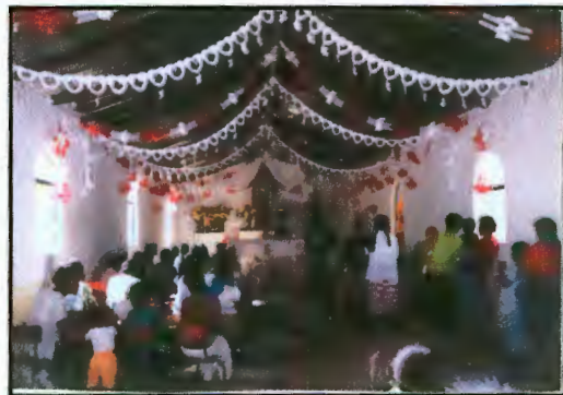
Imagen 11: La hora del rosario en la capilla

Los mitos morales son transmitidos mediante la tradición oral, y mediante el funcionalismo se puede describir la ocupación social que desempeñan en la vida cotidiana reforzando conductas, justificando acciones y creando normas que son aceptadas por la población. La carga moral indica el simbolismo en la lucha entre "el bien" y "el mal" definiendo