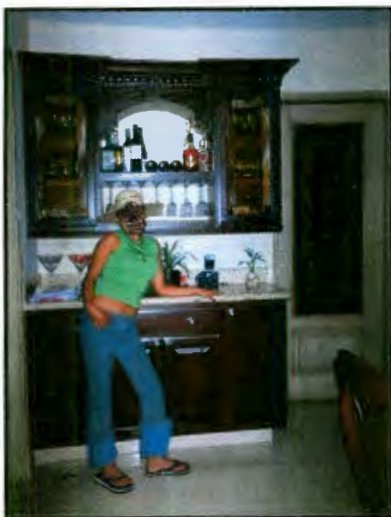
Imagen 24: Posando con sombrero de la patrona.

En el trabajo domestico que realizan en las casas de familias adineradas de Matamoros no incluye acarrear agua o cargar cosas pesadas, su labor esta simplemente en sacudir, barrer, trapear y tener en orden los objetos que se encuentran dentro de la casa, patio y jardín. En algunos casos cuidan de las mascotas o los hijos de los "patrones". Por la tarde tienen la oportunidad de ver telenovelas en las televisiones personales que les son prestadas en la casa, contestan las llamadas de la casa y toman los recados que interrumpen sus novelas, algunas tienen la ventaja de hacer llamadas a sus amigas en Matamoros, a la comunidad y a sus novios aun estando en Estados Unidos.