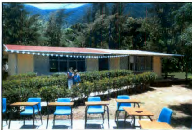
Imagen 10: Escuela primaria

Al término de los estudios primarios (12 a 14 años) los varones comienzan a migrar a los Estados Unidos guiados por sus familiares y la comunidad en general. Esto desmotiva a las generaciones venideras para continuar con los estudios de secundaria.