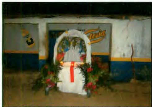
Imagen 3: Altar para semana santa frente a cantina.

Desmond Morris (2000) por su parte, trata de analizar la sexualidad mundial y señala que cada cultura tiene propios estándares de belleza, en el cual el compañero o compañera debe estar adecuado al contexto histórico social. Las personas buscan la belleza corporal y estética, el parecer atractivo(a) ante los demás sobre todo en la juventud, siendo esta una etapa evolutiva hacia la adultez, en ella comienzan a enviar mensajes sexuales a través de las modas culturales; la mujer madura o el hombre maduro comienzan a sentirse menos atractivos con el paso del tiempo (arrugas, grasa acumulada, etc.) y buscan la juventud que los hace atractivos por medio de cirugías, pomadas, tes, etc.; es en este terreno en el que las personas desean y "deben" verse sanas para ser atractivos, por lo que se inventan artículos como los cosméticos "que cubren las