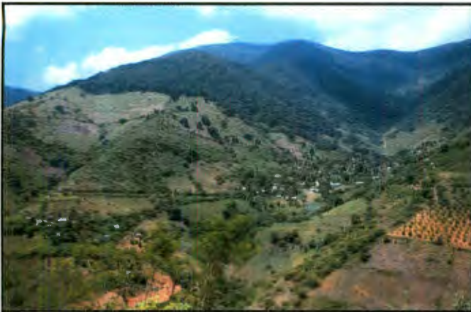
Imagen 1: Vista Panorámica de la comunidad

La comunidad es primordialmente agrícola obteniendo los campesinos bajos ingresos para mantener familias tanto extensas como nucleares; por otro lado, se encuentra el trabajo por faenas que consiste en emplearse en