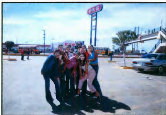
Imagen 22: Jóvenes migrantes posando para foto frente al HEB.

Salimos de la plaza Fiesta a las 3:30pm y nos dirigimos al puente peatonal donde nos detuvimos unos momentos pues a las jóvenes les gusta observar los autos que pasan por debajo, en su decir disfrutaban "viendo a las personas como hormigas" desde arriba, les gusta "recibir los vientos que soplan hacia la costa" y les sorprende que Matamoros no este rodeado de cerros como en la Sierra Gorda Queretana.