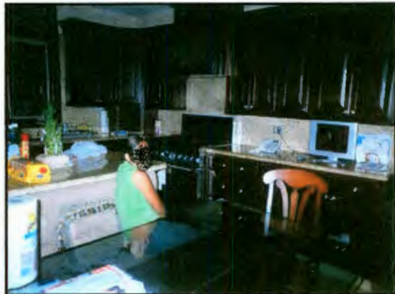
Imagen 24: La hora de las novelas

Otro de los medios de comunicación que influyen en las jóvenes de El Paraíso, es la radio con las estaciones especialmente dedicadas al estilo de música que escuchan en la Sierra Gorda queretana. Como ya indicamos, las letras de cierto tipo de canciones son tomadas por las jóvenes como las historias vividas y algunas veces como presagios, puesto que si una canción se relaciona con un hecho que vive o vivió una de las jóvenes se considera que el contenido de la canción puede llegar a suceder, sugestionándose en algunos momentos tanto, que los actos que realizan originan que en la realidad su vida se encamine a como lo dice la canción; y como ya se indicó pasa lo mismo con las telenovelas.