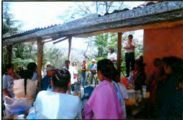
Imagen 9: Reunión con personal de salud

El personal de salud tiene indicaciones de la Jurisdicción Sanitaria No.4 y de los Servicios de Salud del Estado de intensificar acciones de acuerdo a su calendarización, por ejemplo, en noviembre se intensifican las acciones enfocadas a la salud de la mujer por ser para ellos el "mes de la Mujer", en Septiembre las platicas y atenciones se intensifican en las escuelas por ser el "mes del Adolescente", de igual forma hay actividades para adultos mayores, para el grupo de hipertensos, diabéticos, etc.