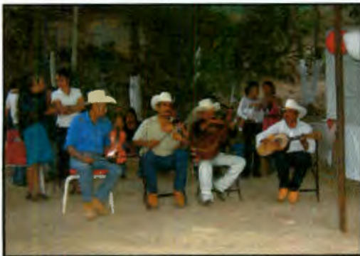
Imagen 16: Huapangeros en la fiesta patronal

Los bailes comunitarios en la zona del Municipio de Arroyo Seco son amenizados por grupos en vivo, estos suelen ser procedentes de la región: San