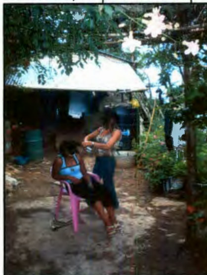
Imagen 17: Jóvenes planchándose el cabello para ir al baile

Al evento no acudieron madres de familia pero si algunos padres que tomaron bebidas embriagantes en exceso avergonzando a sus hijos. Al finalizar el baile siendo aproximadamente las 2am, se observaron madres de familia que medio adormiladas, salieron de sus casas a buscar a sus hijos adolescentes a la zona del baile sin hacer alborotos al encontrarlos ingiriendo bebidas alcohólicas o cortejando con alguna persona. Las jóvenes de El Paraíso volvieron inmediatamente en las mismas camionetas que las llevaron al baile.