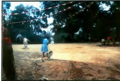
Imagen 2: Las mujeres y las faenas comunales

Las mujeres que no migran suelen emplearse en las faenas para cubrir los trabajos que realizaban anteriormente los hombres migrantes, acudiendo por igual mujeres adolescentes, embarazadas y en edad avanzada.