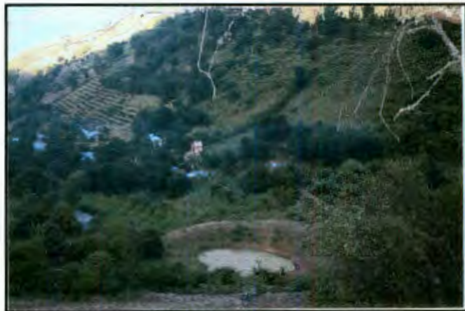
Imagen 5: Panorámica de la comunidad

Es importante mencionar que El Paraíso se ubica dentro de la Reserva de la Biosfera de la Sierra Gorda de Querétaro. Es una localidad marginada con un camino de acceso de terracería, difícil, que se ve afectado por el desgaste de la época de lluvias. Esta condición dificulta el acceso del transporte, y a su vez del