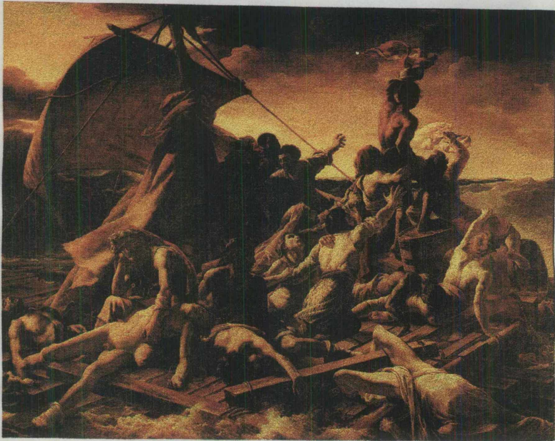
Théodore Géricault La balsa de la medusa Óleo sobre tela

Los locos al igual que los náufragos son seres que se encuentran a la deriva, perdidos en la inmensidad del mundo, sin una meta a la cual dirigirse y sujetos a los vaivenes del temporal, solos, angustiados y excluidos del resto de la humanidad..