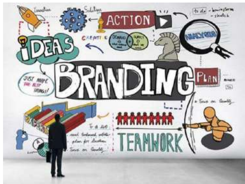
Fig18 Pero la competencia de la moda del vestir trae con ella, otro nuevo fenómeno, el Branding 11 , que es definido por José Manuel Gómez-Zorrilla 12 (2011) como: “la gestión inteligente, estratégica, creativa de todos aquellos elementos diferenciadores de la identidad de una marca (tangibles e intangibles). Que contribuyen a la construcción

de una promesa y de una experiencia de marca distintiva, relevante, completa y sostenible en el tiempo”. (Gómez-Zorrilla, 2011).