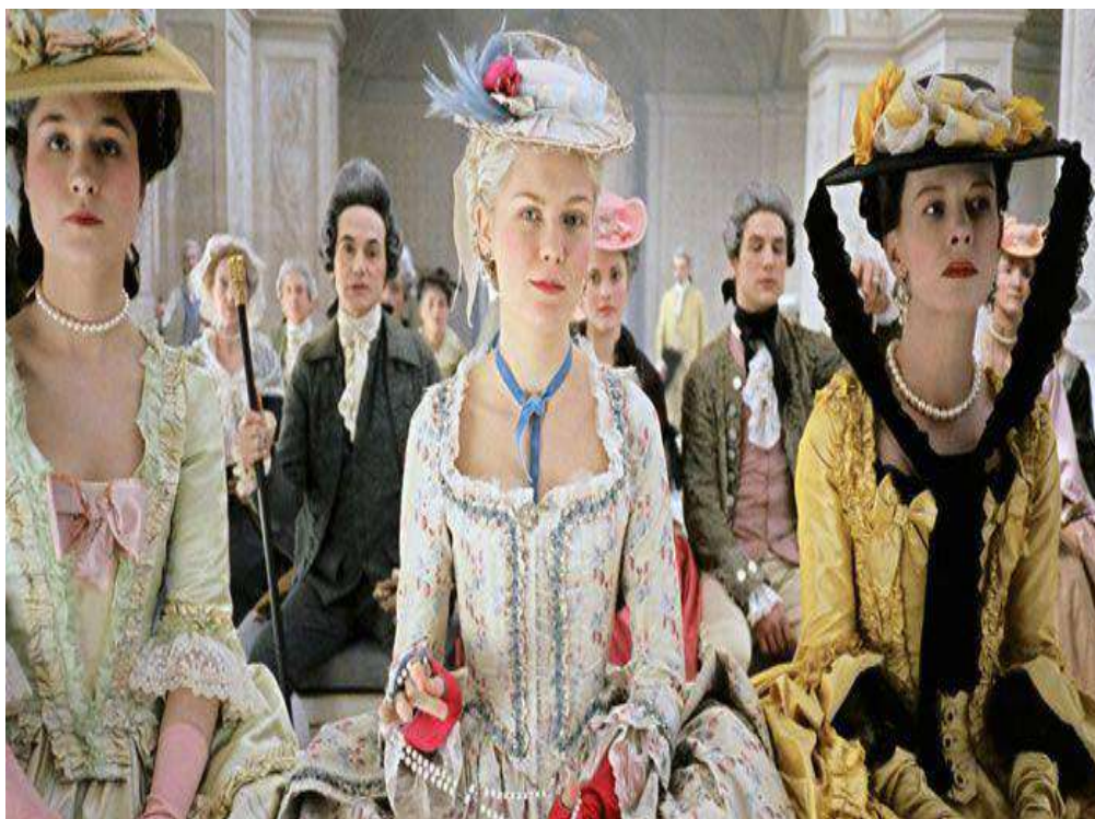
5 Imagen, Vestidos del siglo XIX, Clase alta, tomado de la película María Antonieta , web. www.espaciomadrid.es

Simmel comenta sobre la moda: “Es un fenómeno constante en la historia de nuestra especie”. “La moda es la imitación de un modelo dado, lo que satisface la necesidad de apoyarse en la sociedad librándose del tormento de decidir [...] conduce al individuo al camino que todos transitan y facilita una pauta general [...] pero no menos satisface la necesidad de distinguirse, a la tendencia a la diferenciación, a cambiar y destacarse [...] conseguido a través de la variación de contenidos, que es demostrada en la individualidad de las modas de cada época...” (Simmel, 2017, p.10). Es importante destacar que las modas, son siempre modas de clase. Las modas de clase alta 5 se diferencian de las de clases inferiores 6 y son abandonadas en el momento en el que las clases