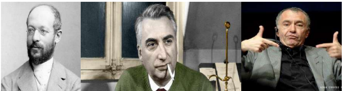
Figure 1, Fotografía de Georg Simmel

Lipovetsky es un autor que no puede faltar en un estudio del camino y lenguaje visual que ha llevado la moda del vestir y sus accesorios, ya que muestra de manera crítica cómo la sociedad ha ido perdiendo su esencia y se ha involucrado en una serie de competencias de poder adquisitivo, para darle valor al sentido de la vida.