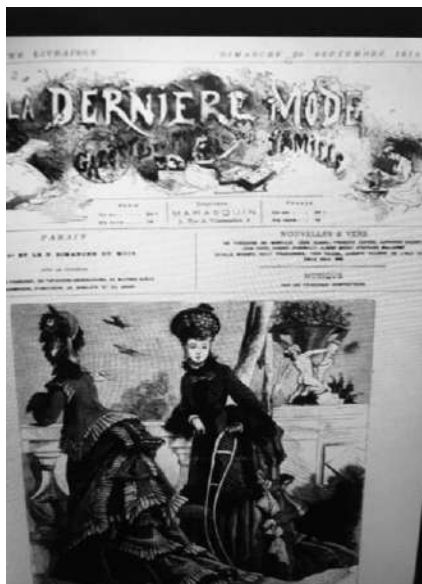
Fig 6 Por otro lado, existe otra percepción que consiste en desistir de este sistema de equivalencia y construir una función imprecisa o poética. Se trata de una moda inactiva, lujosa, pero que tiene el valor de declararse de una forma pura, poniéndose de esta manera al nivel de la literatura, como sería la relación de una pequeña revista de moda llamada La Dernière Mode Fig 6 (1874), presentada como una auténtica revista de moda, en la cual las descripciones de las prendas es un ejercicio profundo. Como comenta Barthes, “se trata de un vacío que no es absurdo, un vacío que se construye como

naturalista. La moda engaña, se esconde detrás de coartadas sociales y psicológicas”. (Barthes, 2003, p. 430).