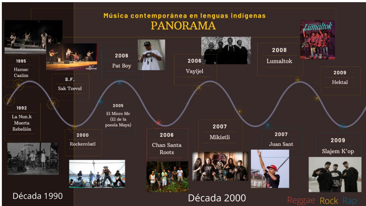
Imagen 1. Primeras dos décadas de la música contemporánea en lenguas indígenas, sólo se aprecian tres géneros musicales. Elaboración propia.