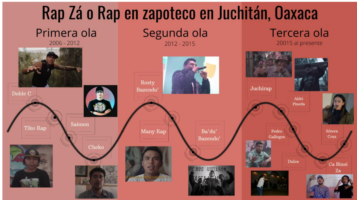
Imagen 3. Desarrollo del rap zá o rap en zapoteco. Elaboración propia

Imagen 3. Línea del tiempo del rap en zapoteco en Juchitán, Oaxaca.