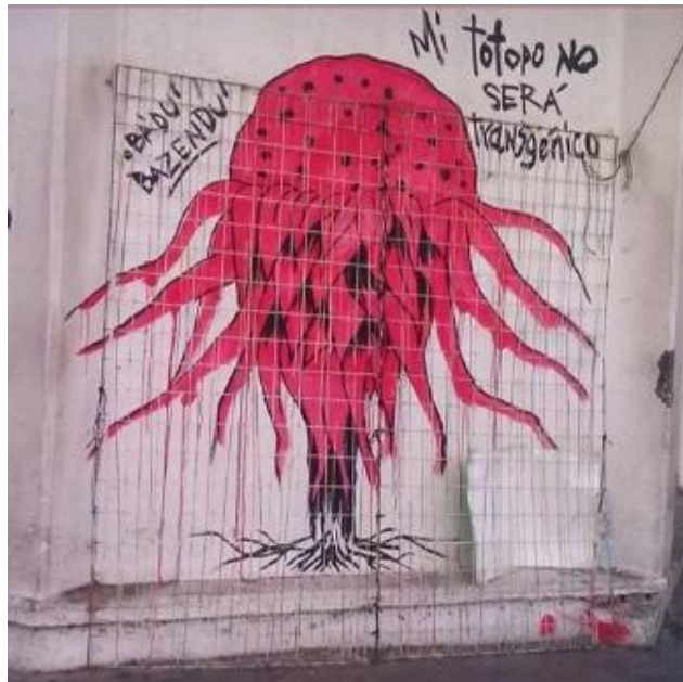
Imagen tomada de la canción “Gasti guidxi Ba’du Bazeendu” del perfil de Ixchel Milpa en la plataforma SoundCloud. En: https://soundcloud.com/ixchelmilpa/4-gasti-guidxi-badu-bazeendu