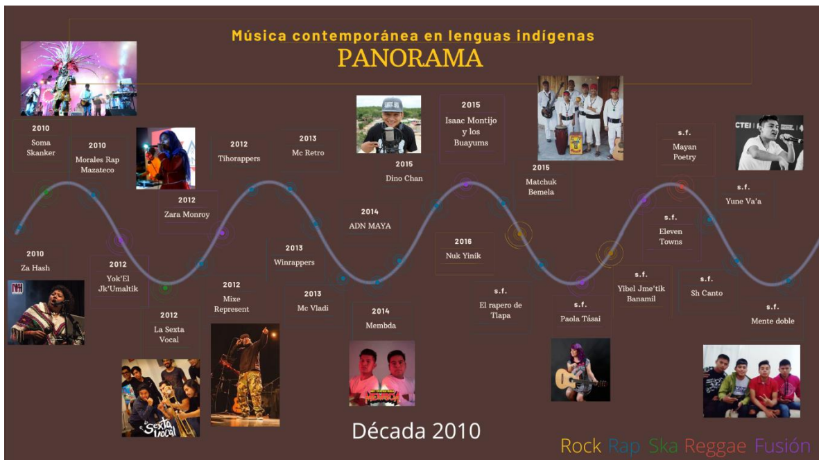
Imagen 2. Segunda línea del tiempo del panorama de música contemporánea en lenguas originarias.