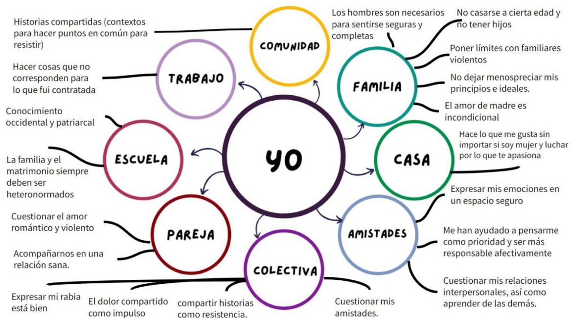
Ilustración 5 Ecomapa de cuestionamientos ¿De dónde venimos? - Sesión 2