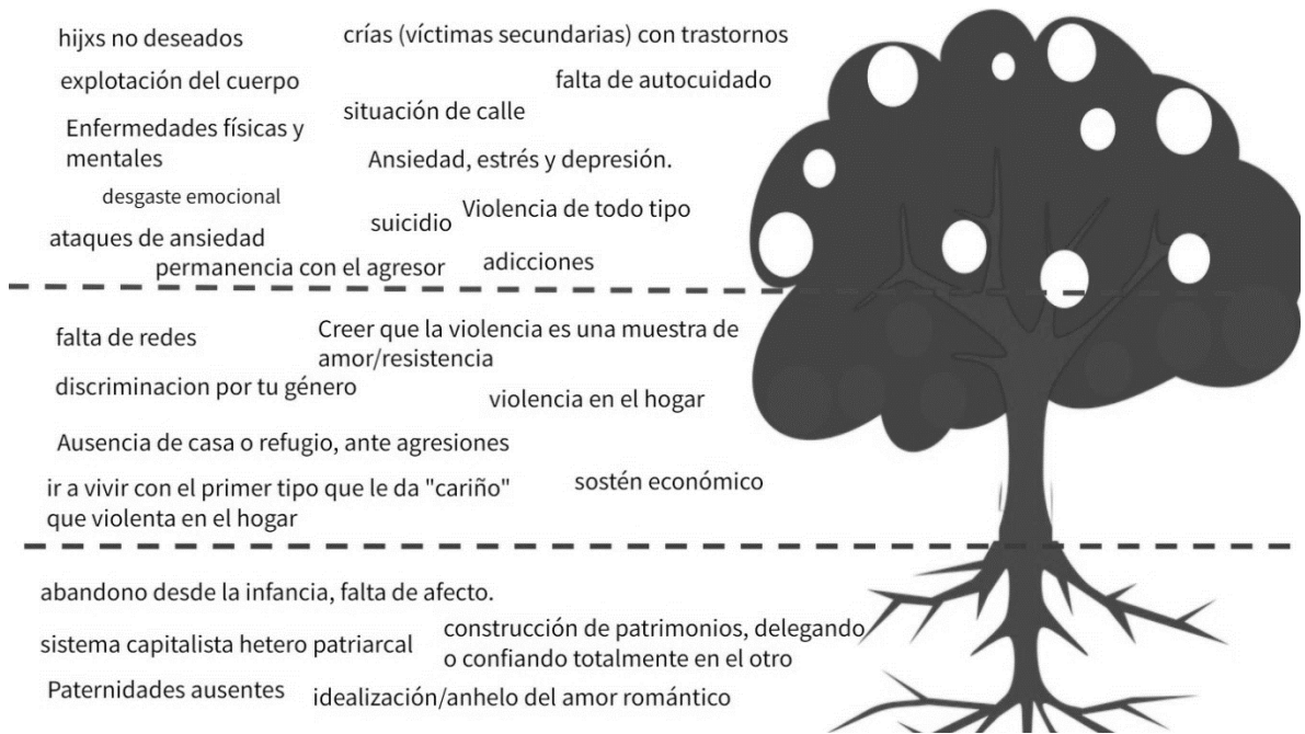
Ilustración 3- Árbol de los problemas. Sesión 2 ¿De dónde venimos? - Ejercicio 5