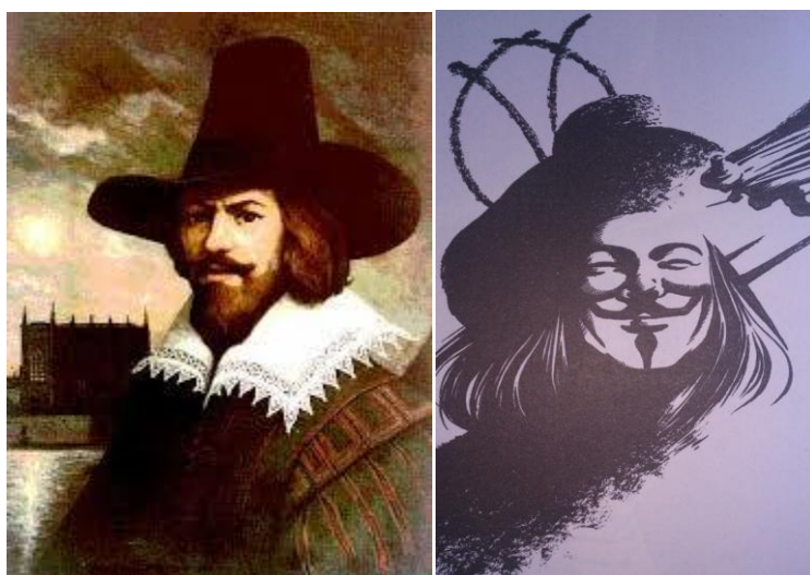
Imagen 11 y 12

http://www.gamba.cl/2013/11/remember-remember-the-fifth-of-november/ y Fotografía de la novela gráfica V for Vendetta