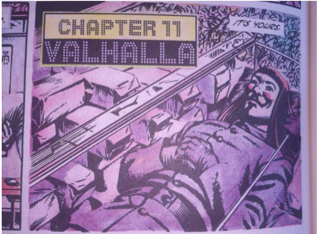
Fotografía de la novela gráfica V for Vendetta

El clima de la novela es generalmente sombrío, éste muestra las debilidades de un régimen. Debido a que V fue torturado por los que se convertirían en las figuras de autoridad del régimen, se enfrenta a un sistema que, al ser naturalmente represor, deja de contemplar las ideas "imposibles" y esto le permite moverse por todos los espacios que dejan de ser contemplados por el gobierno. Lo anterior se ve perfectamente ejemplificado con la gran explosión que V causa en Downing Street: los túneles del metro están cerrados y las vías tapadas, esto supone ser una verdad absoluta, como su régimen, por lo que le da espacio a V para poder planear su venganza. Esta idea de lo que se ha erradicado por completo en el régimen va a ser una de las más peligrosas, pues es justamente en ese espacio de lo que el Estado considera como inexistente, y