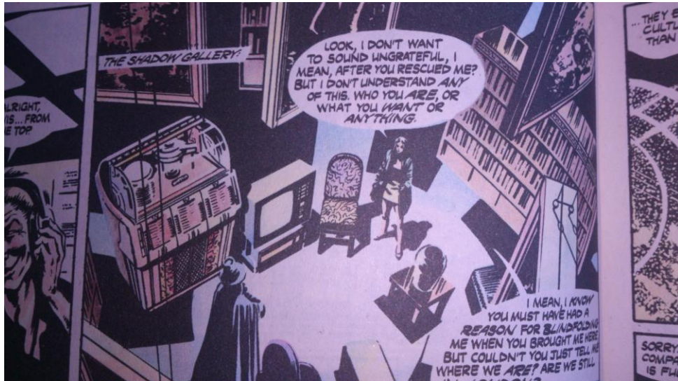
fotografía de la novela gráfica V for Vendetta

Esta transformación es muy importante debido a que ella estaba inmersa en la dinámica de una sociedad que no era funcional, pero aún no lo había visto así. Es a través de sus pláticas con V que se da cuenta que la justicia y la seguridad sin libertad no valen la pena. Esto se ve en diferentes puntos de la historia, el descubrir que cuando las libertades civiles son coartadas existen voces que oponen una resistencia ante las injusticias, esto abre la posibilidad de que las personas de otras épocas encuentren en estas luchas la fuerza necesaria para pelear por lo que es justo y correcto, y el entendimiento de que las libertades civiles no deben ser coartadas bajo ninguna circunstancia, pues esto atenta contra el ser mismo.