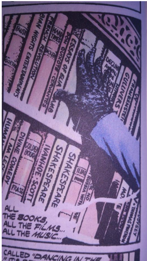
Fotografía de la novela gráfica V for Vendetta

El uso de esta máscara es fundamental para el desarrollo de la historia pero también para nuestra comprensión de lo que ocurría en Inglaterra, debido a que Fawkes es una figura de resistencia y rebelión ante los poderes del estado. V, al usar la máscara de Fawkes, hace referencia a la resistencia de la sociedad civil, tanto en la realidad como en la novela gráfica; su objetivo es hacer explotar el parlamento inglés, que siempre ha representado tanto el poder del estado como el poder de la monarquía. Aunque las razones no sean las mismas, el fin de este