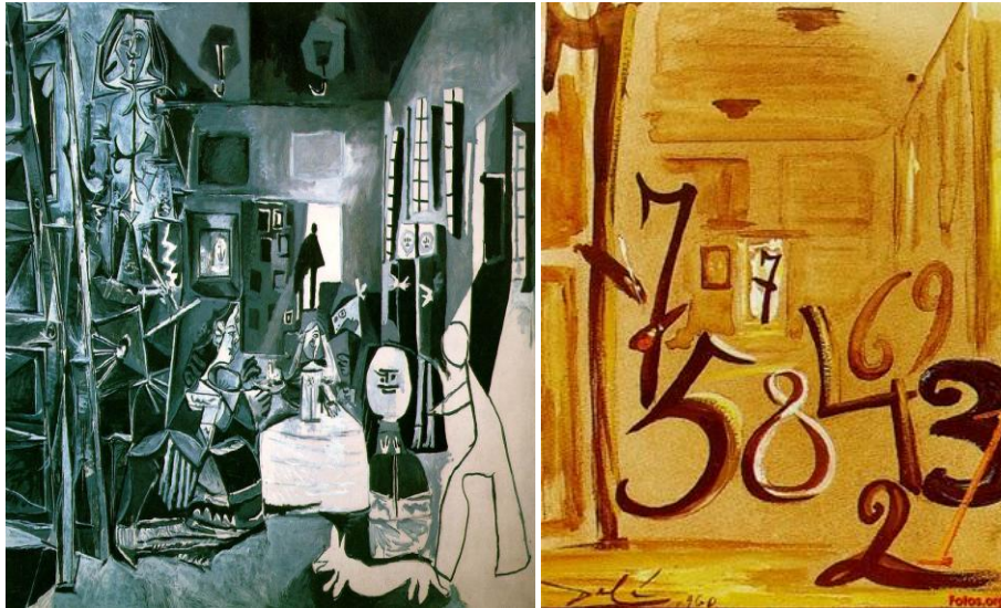
Imagen 9 y 10

http://misiglo.wordpress.com/2010/04/26/fascinacion-de-las-meninas/ http://ciervomaya.wordpress.com/2011/11/03/las-meninas/