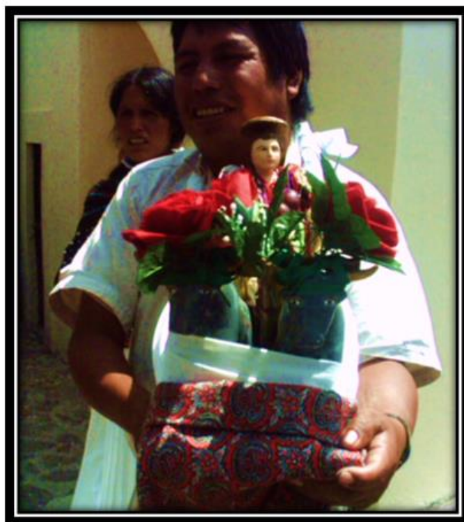
Imagen 9. San Isidro Labrador.

Vemos en estas breves citas porqué es tan relevante el culto a San Isidro pues evidencia la cosmovisión sobre la importancia que la naturaleza tiene para los ñaño y donde nos muestra una posición ética sobre el cuidado ambiental, expresado en la sacralidad que los ñaño otorgan a los objetos de la naturaleza, incluyendo los árboles, la luna, la tierra etc. Este culto a la naturaleza, y a los elementos que de ella emanan son vistos y ejercidos como un fenómeno ritual, el culto al pino Cuecux al que a su vez se le relaciona con Octontecutli según Carrasco y a la luna asociada a la Madre Vieja y Xochiquetzal, “dios de la curiosidad.-, Dios-jorobado” (Pedro, Carrasco:1979,157) asociado este último al dios del fuego.