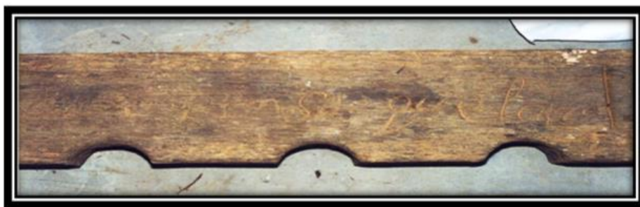
Imagen 5. Tablas del justicia, Delegación Santiago Mexquititlán.

“existían en Santiago unas tablas del justicia iguales que las de San Miguel Tlaxcaltepec su fin era dar castigo a quien robaba animales o hacía riñas en las festividades o su comportamiento no era adecuado en tiempos atrás, el mayor y los fiscales se hacían cargo del justicia dependiendo del acto por ejemplo si se asesinaba ese era atado a las tablas de brazos y piernas, el fiscal se iba caminando hasta Amealco para que las autoridades ya oficiales les aplicaran el justicia. En un tiempo atrás esas tablas se quemaron junto con un cuarto que se encontraba a un lado de esta iglesia de barrio I donde se da el cambio de cargos. Para las personas que cometían un acto fuera del costumbre se le imponía de multa hacer velas de cebo para la iglesia de aquí o de la Purísima Concepción en la Torre” (Don Luciano carguero trabajo concurso Itzamná 2008)