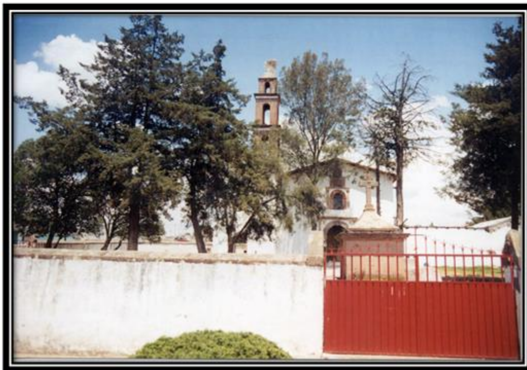
Imagen 4. Templo de Santiago Mexquititlán Barrio I. Por Iván López.

configuración del joven ñaño, en la relación dicotómica entre ambas instituciones cosa que veremos más detalladamente en el último capítulo de este trabajo.