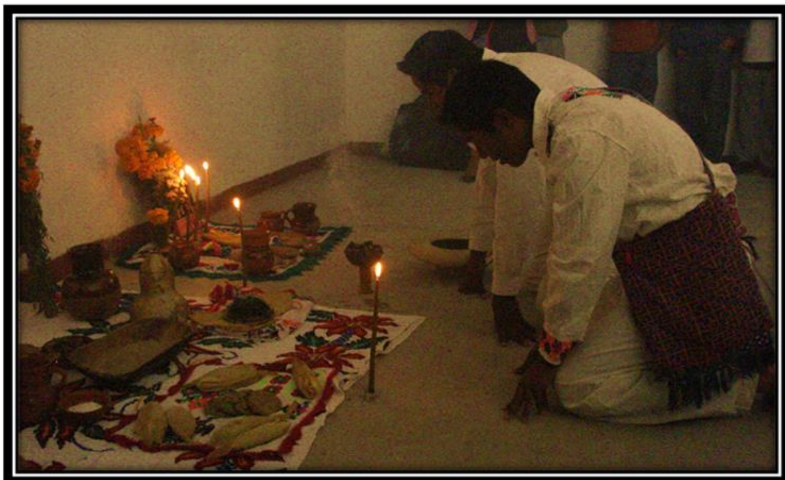
Imagen 16. Alumnos del COBAQ 20 en ofrenda del día de muertos, Santiago Mexquititlán. Van de fliert.

el templo que representen a la familia, sahumar y realizar los ramilletes de flores, en cambio en los hombres de la familia residen los cargos” como señala