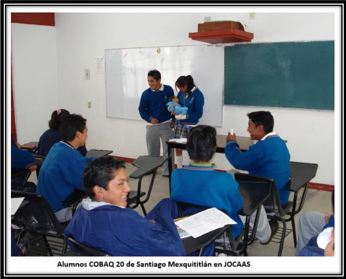
Alumnos COBAQ 20 de Santiago Mexquititlán en JOCAAS