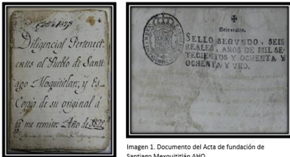
Imagen 1. Documento del Acta de fundación de Santiago Mexquititlán AHQ.

“.....por lo cual todos damos y concedemos licencia y facultad para que dicha parte y lugar funden el dicho pueblo, que se llame y intitule de nombre el Pueblo de Santiago Mestitlán... en el dicho pueblo de Santiago Mestitlán lo que por dichos naturales hab de fundar dentro de dicho año, el dicho pueblo de Santiago dentro de dichas quinientas baras, y demás de edificación, obligándose a la dicha fundación de dicho pueblo, los susodichos Don Diego Indio Casique y gobernador de dicho pueblo y cabecera de dicho pueblo San Miguel Cambay,... fecho en México a diez, y nueve de maio de mil quinientos y setenta y ocho años, por mandado de los señores presidente y oidores Don Juan de Laez escribano de su magestad” (AHQ, judicial, legajo 124 1823 Diligencias pertenecientes al Pueblo de Santiago Mesquititlán fojas 9-11)