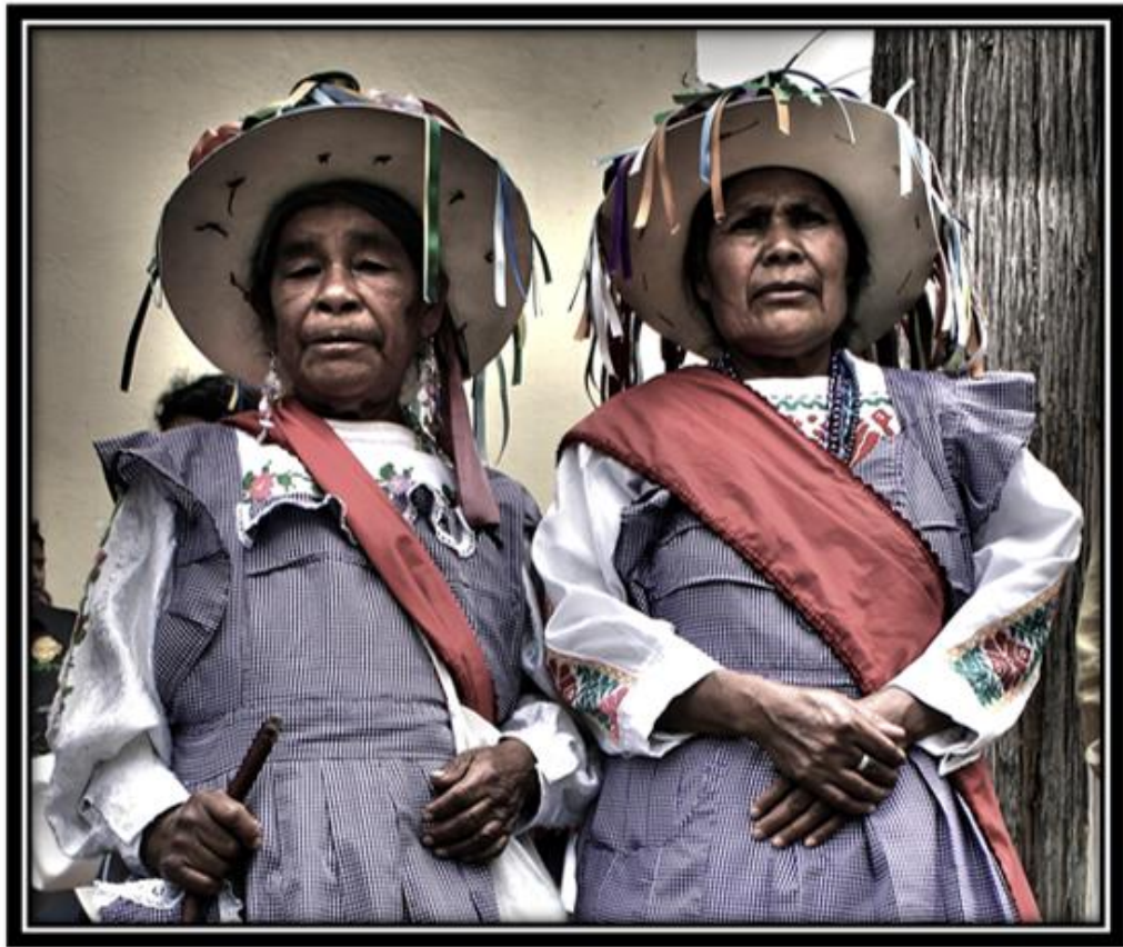
Imagen 17. Mujeres danza de “Las Pastoras” el día del señor Santiago.