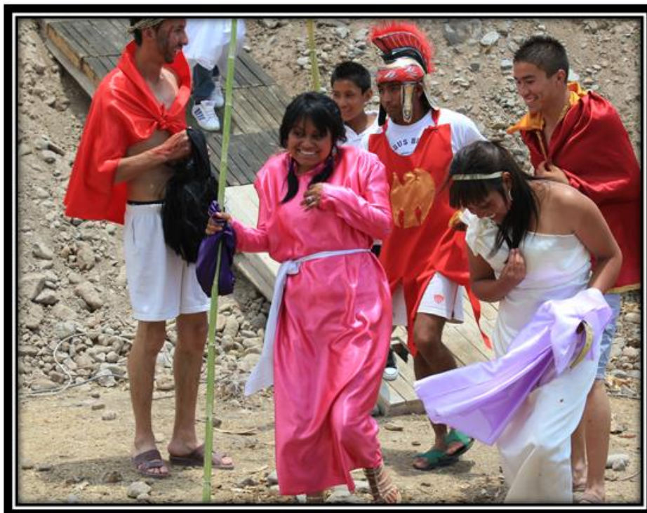
Imagen 11. Representación de Semana Santa 2011 con jóvenes de Santiago, Capilla Barrio I.