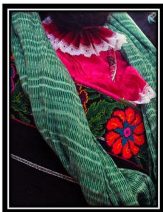
Imagen 2. Foto de quexquemetl. Por Iván López.

“El quexquemetl lo laboramos desde tiempo atrás, los viejos dicen que esto tiene muchos años atrás, que se cuenta se iban a la hacienda del obraje o a la ciudad al hacer esta artesanía era una forma de ganar dinero fuera, en la ciudad, cada diseño depende de la familia aunque casi siempre los bordados son de aves, flores y hasta geometría o de partes de la naturaleza que son importantes para nuestra cultura, cada familia tiene su propia figura en el bordado” (Mireya)