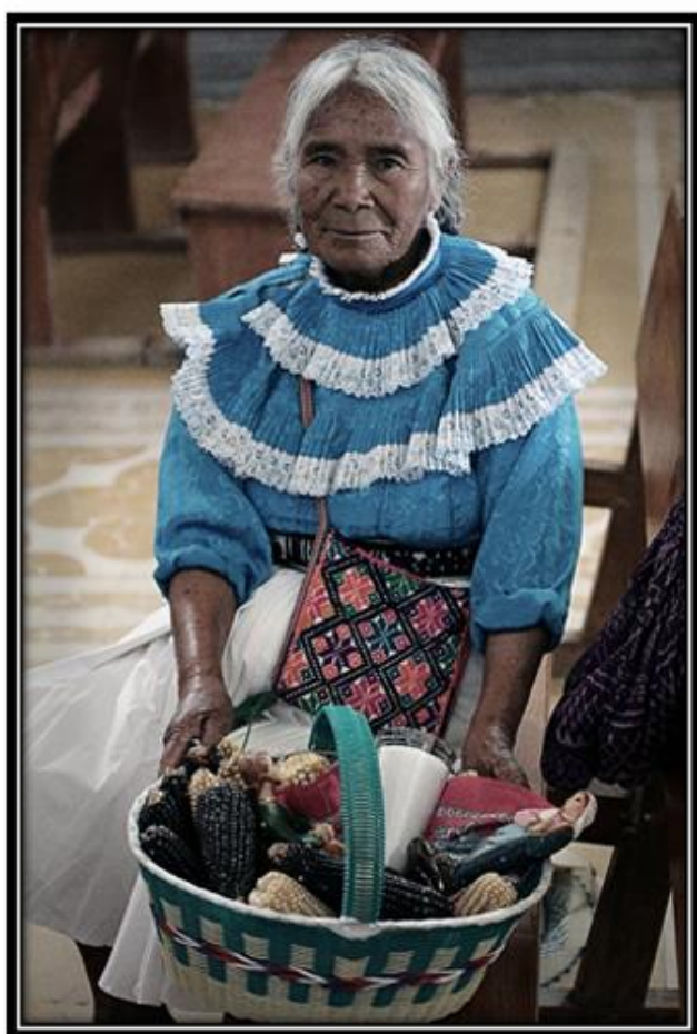
Imagen 8. Bendición de la semilla.

figura de la Virgen María y San José al Templo de Barrio I, o a la capilla ubicada en ese mismo barrio, de esta forma el sacerdote o mayor bendice los granos que se han de sembrar en la milpa en el mes que viene. Los cargueros son la autoridad religiosa principal de la comunidad y se encargan de hacer mole, pan y antes se usaba el zeinthö (así se escribió) (pulque de maíz fermentado con chile de árbol) ahora se llevan cervezas (caguamas) luego del rito a las afueras de la Iglesia, se tiene convite con música interpretada por “los maestros” interpreta melodías con el violín y el tambor (trabajo de alumnos plantel 20 del concurso Itzamná 2007)