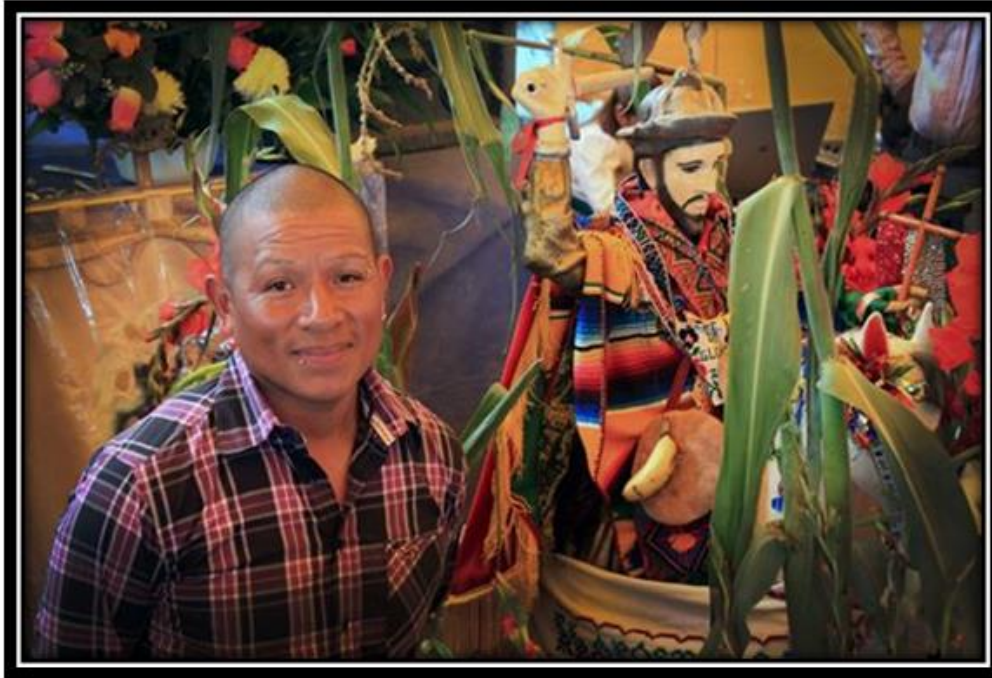
Imagen 14. Joven de Santiago Mexquititlán, “Día del Santo Patrono”

“Al otro día entre las 12 de la mañana se lleva una misa a nombre de Santiago el patrón del pueblo, se dice que se apareció en los cerros y que es el Santo más antiguo que los que vienen de visita. El sacerdote reza la misa, quien viene de la Torre lo acompaña el vicario de la diócesis de Querétaro, la misa se lleva en el atrio, después de la misa se tiene la danza de las pastoras que es conformada por mujeres y niñas de la comunidad que se mueven al ritmo de las estrellas para el Santo Patrón, también a un costado del templo se tiene la danza de raza ( danza conchera) que tiene unos años y es traída por gente de barrio VI, se tienen acomodadas las imágenes peregrinas y los dos fiscales el viejo y el segundo se turnan a bendecir con las velas que las gentes de fuera antes, en la misa, o después de la misa, porque son casi igual de importantes que los sacerdotes, las velas las colocan en un cuarto donde se le ofrecen a los santos, la gente acostumbra darles una cooperación a los fiscales para que les ayuden a comprar lo que van a necesitar una vez en el cargo, viene mucha gente de todos los pueblos cercanos, de la Nueva Realidad, de Monterrey y de otras ciudades a ver a la parentela en esos días hay partido de futbol de los barrios, también la gente compra unas ropas para estrenar y en la noche se