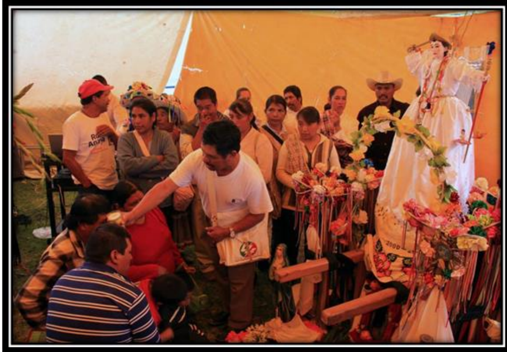
Imagen 13. Bendición de la semilla, “Día de la candelaria”, Foto por Iván López.

A continuación se hace una breve descripción de la festividad del señor Santiago o Santo Patrono registrada en un trabajo por ex alumnos del plantel 20 de COBAQ: