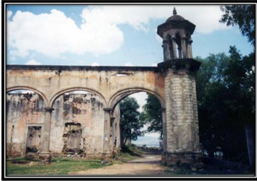
Imagen 3. Hacienda da San Nicolás de la Torre. Por Iván López.

“Cuentan los viejos en tiempos de las haciendas de la Torre y Solís, la gente pedía maíz a los hacendados, porque decían que el dinero no servía, lo único que querían era que no faltara tortilla, por día les daban tres cuartillos de maíz que vendría hacer como tres kilos y sino de cebada de eso se hacía tortilla....” (Misael)