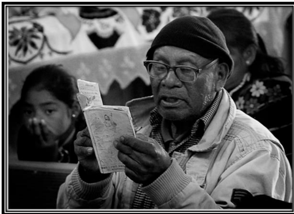
Imagen 7. Rezandero del latín, día de la candelaria o bendición de la semilla.

se pueden asociar con los mitos de origen: La Madre Vieja y el Padre Viejo el Sol o (San José), así como la dicotomía vida y muerte con la bendición de las semillas y las velas para los difuntos, ya que la semilla y las velas son puestas en los altares del hogar.