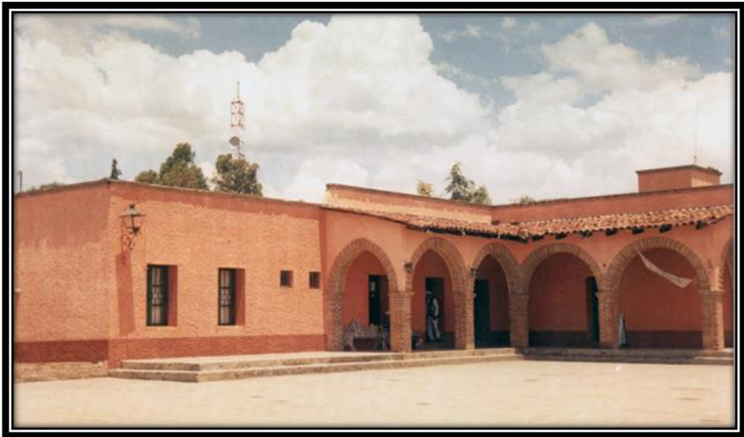
Imagen 6. Delegación Barrio I, Santiago Mexquititlán.

A pesar de las modificaciones a legislaciones e instituciones a través del paso del tiempo, el esquema moral heredado por la familia persiste, porque si bien las autoridades eclesiales y políticas no llevan los intereses comunes del pueblo, éste se manifiesta y explicita la injusticia y otras formas de impartir justicia tal como hemos citado en los documentos encontrados en el AHQ. En la época actual a través de la prensa con los incidentes de la policía sobre la mercancía decomisada en barrio I y también en algunas colonias donde se comercia en Querétaro.