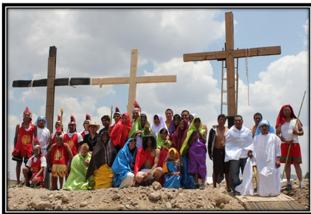
Imagen 10. Representación de Semana Santa 2011 con jóvenes de Santiago, Capilla Barrio I.

en rostro al realizar su papel en algunos de los pasajes bíblicos, le acompañaban en el peregrinar la virgen y los soldados romanos. Por otra parte el rito principal para esta sociedad otomiana, se realizaba en otro escenario ritual, a través de dos cargueros de barrio III, quienes por tradición heredan su ofrecimiento, año con año durante el mes de julio renovando autoridades religiosas, -claro, si es que la comunidad lo considera pertinente para seguir en el destinado cargo según su comportamiento moral (en el decir de Misael)-.”