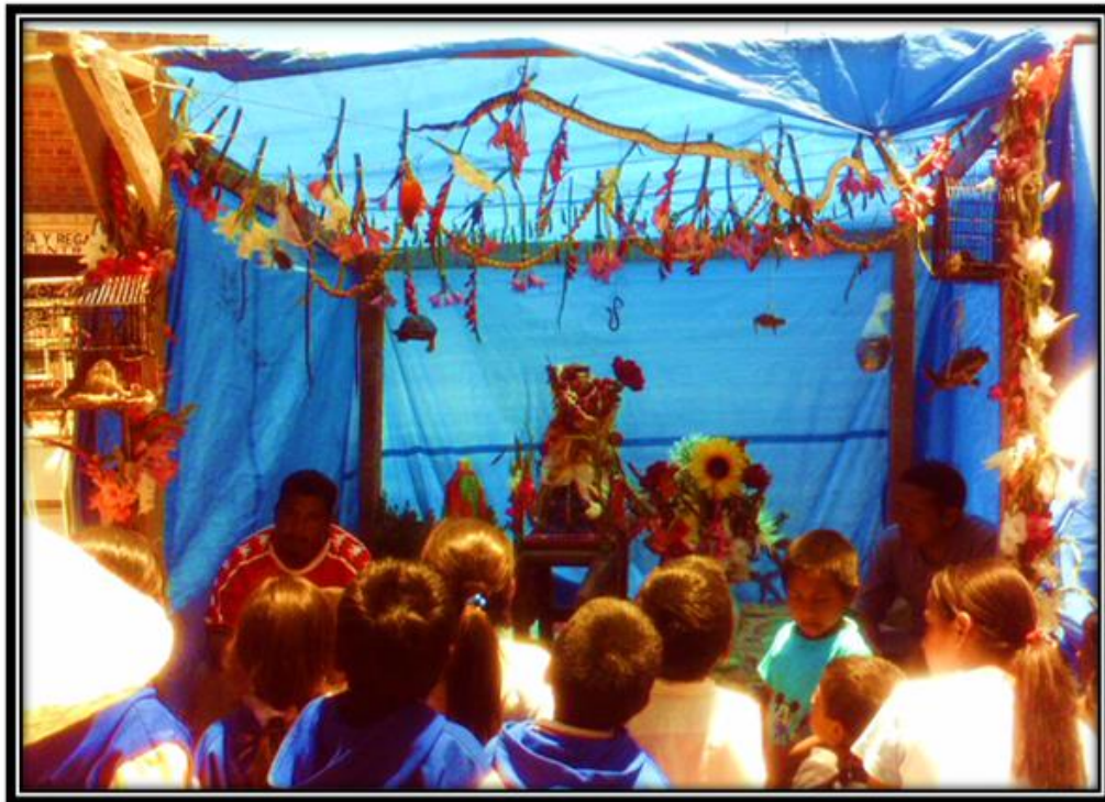
Imagen 12. Altar hecho por cargueros de Corpus Cristi, Santiago Mexquititlán 2010.

San Isidro y los santos son los intermediarios de Dios y los hombres” (Marcelo, Abramo:1999, 216) señala que los sacrificios muestran la comunicación que existe entre el hombre con sus dioses mediante la inmolación de las víctimas, no obstante esta festividad de Corpus no indica una inmolación puesto que no hay víctima ni victimario. Su interpretación sobre “el sacrificio” como una forma genérica se ha dado en todas las épocas de la historia y de un lado a otro del mundo. “...el sacrificio supone el paso de algo que pertenece al mundo de la cotidianidad humana al mundo de la divinidad.