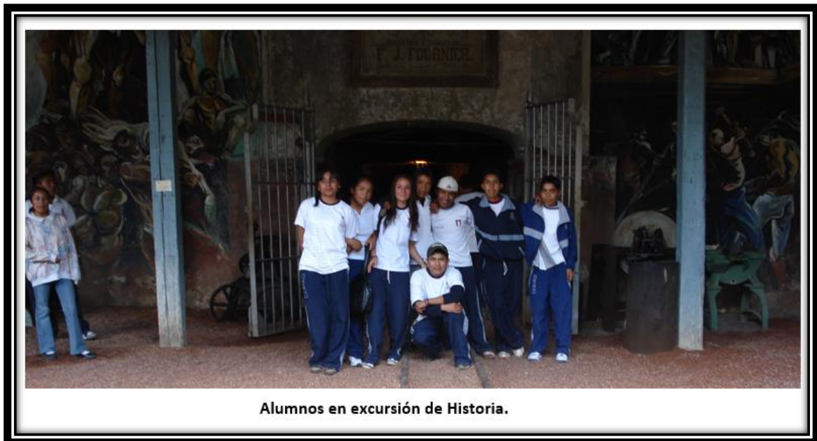
Alumnos en excursión de Historia.

Aun considerando este análisis crítico de la realidad, muchos alumnos ñahño del plantel 20 consideran que la escuela media superior les daría posibilidades de obtener una mejora en la calidad de vida, este discurso es contradictorio y se considera una retórica instituida que deviene del discurso de la mayoría de las instituciones gubernamentales, fomentado por el acompañamiento de acciones paternalistas populistas, como el hecho de proveerles de becas del programa oportunidades y de transporte escolar. Sin embargo algunos jóvenes saben que al concluir sus estudios no tendrán oportunidad de conseguir empleo fuera de lo que sus familiares realizan como una forma de ganarse el sustento: el comercio 27 suponen porque lo viven, que devienen un sin número de barreras que la sociedad mayoritaria así como empresarial les imponen, como por ejemplo los trabajos tres D (di confortantes y desagradables) que argumenta Reguillo de explotación laboral que sufren a nivel global los jóvenes sean ñahño o no. Pero además está su condición de raza que los sitúa en periferia: “por feo o mi color de piel no me contratan” como ya citamos en capítulos anteriores.