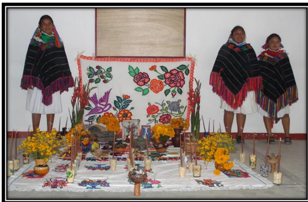
Imagen 15. Alumnas del COBAQ 20 en ofrenda del día de muertos, Santiago Mexquititlán.

“los niños” en el altar familiar se le ponen dulces y juguetes se pueden elaborar muñecas y juguetes de barro se encienden velas de sebo que si lloran es porque el alma del niño viene de vuelta, se nombran así también aquellas mujeres que murieron de parto, se juntan en ocasiones los padrinos de bautizo para cantar y orar por el difunto niño y antes se llevaba una Cruz a la capilla cercana a la casa del difunto o bien si murió de accidente los padrinos de bautizo le colocaban una Cruz en el lugar o le pintaban su cruz en el panteón” (Misael)