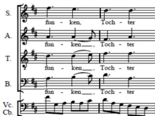
Fig. 13 Voz del bajo, tenor y contralto en el compás 216 y 217 de del tiempo allegro assai vivace, alla marcia , IV Movimiento 9ª Sinfonía de Beethoven

Con lo cual podemos justificar el concepto de la invención de la polifonía que utiliza Carpentier en el Treno , a lo que en Beethoven sería por un instante la invención de la armonía alterada: