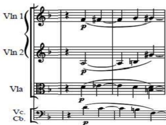
Fig. 5 Línea de las cuerdas frotadas del compases 14 y 15 del tiempo presto, IV Movimiento 9ª Sinfonía de Beethoven

En el compás 14 al 16 del cuarto movimiento de la novena sinfonía, las notas del violín 1º ascienden de manera cromática de fa natural a sol sostenido, formando el acorde de re menor en el segundo tiempo del compás 14, cambiando inmediatamente a do disminuido en el tercer tiempo del mismo compás con toda la frase en piano , en el segundo tiempo del compás 15 se forma el acorde de sol mayor en 1ª inversión, en razón de que el contrabajo y el violoncelo ejecutan la nota si . En el tercer tiempo se forma el acorde de fa disminuido pasando al acorde de mi mayor con 7ª de dominante, el cual se mantiene durante cinco compases más. De modo que estos cuatro enlaces armónicos en piano y con la 1ª voz ascendente de manera gradual y/o cromática, nos sugieren una enmarcación, encuadernación y delimitación del periodo normal del recitativo: O Freunde, nicht diese Töne! ” “ sondern lasst uns angenehmere anstimmen con la madera y cuerda – material de que están hechos los instrumentos de cuerda frotada – que son los únicos que enmarcan esta serie de compases, o frases musicales: