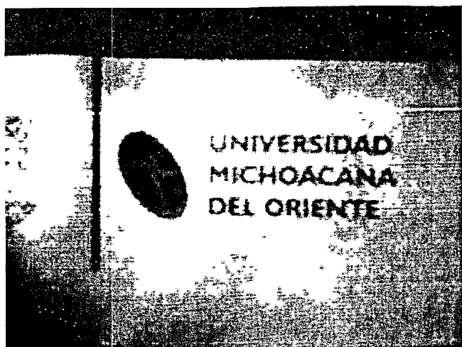
ESCUDO DE LA UNIVERSIDAD MICHOACANA DEL ORIENTE.