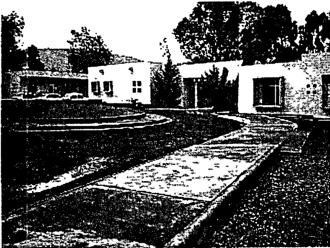
AREA DE ESTACIONAMIENTO Y FACHADA DE OFICINAS ADMINISTRATIVAS Y AULAS.