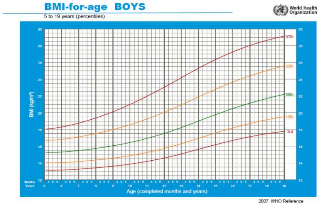
Tabla de índice de masa corporal en niños y niñas de 5 a 19 años de edad