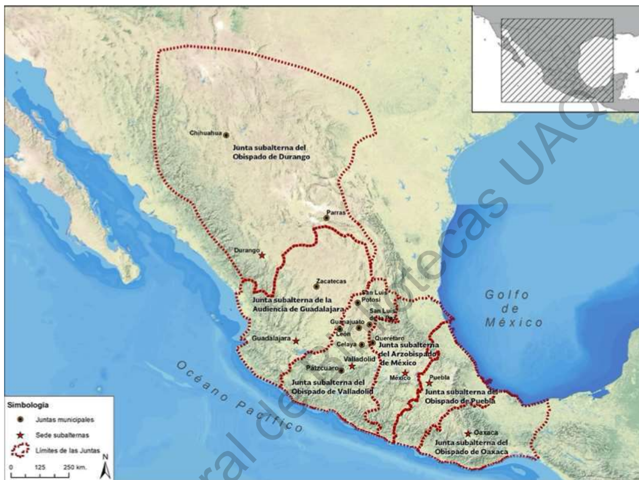
Imagen 1. Límites jurisdiccionales de las juntas Subalternas del Tribunal de Temporalidades de Nueva España, creadas en 1769.

El extrañamiento de la Compañía de los dominios de ultramar fue un acontecimiento determinado por Carlos III, 248 que formó parte de una crisis en la región del Bajío durante el decenio 1760-1770. Después de la guerra de los siete años (1756-1763) entre España, Francia e Inglaterra, el imperio español gravó con impuestos a sus súbditos coloniales que coincidió con un descenso de la minería y disminución económica en Guanajuato, lo que generó, según