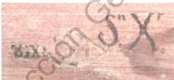
Imagen 11. Marca en tinta “Sn. Xr.” Junto a la marca de fuego atribuida a Antonio de la Vía y la del Colegio Real de San Francisco Xavier.

Por eso, es importante señalar sobre la posesión de los libros que la práctica de dejar anotaciones manuscritas de posesión quizá alumbre la práctica del préstamo de los impresos: anotar a quién pertenece el libro antes de prestarlo. De manera análoga, marcar con fuego responde hacia el exterior a una vindicación de la propiedad libresca que particularmente habían cambiado de poseedores dos veces para formar una “biblioteca común”, y al mismo es un mensaje del robustecido poder cultural de los miembros del clero regular en una ciudad perteneciente a la administración religiosa del Arzobispado de México. No extraña, por esto, encontrar dos impresos de gran formato con marca en tinta en el canto superior simulando ser otra marca de fuego 491 (Imagen 11). Incluso uno de los ejemplares contiene en la portada la ambigua anotación: “Del Seminario de Querétaro”. 492 ¿Será acaso un gesto anterior al sellado con hierros candentes en los costados del libro para expresar la propiedad de un libro requisado a los jesuitas, o un gesto de dominio y visibilidad sobre un objeto de autoridad cultural dentro de los ámbitos letrados de la ciudad?