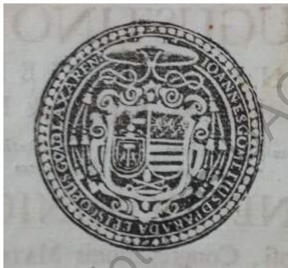
Imagen 5. Sello en seco del obispo Juan Gómez de Parada [ Ioannes Gomelius de Parada ].