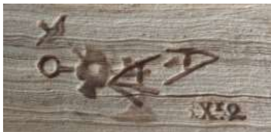
Imagen 4. Tres marcas de fuego en el canto de un libro. Marca de fuego agustina probablemente de San Pablo de la Ciudad de México.