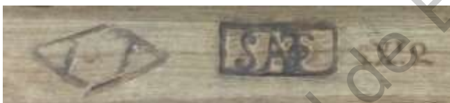
Imagen 6. Tres marcas de fuego en el canto de un libro. Marca de fuego del Colegio de Santa María de Todos los Santos de la Ciudad de México. 449