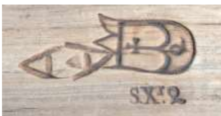
Imagen 7. Tres marcas de fuego en el canto de un libro. Marca de fuego del Convento del Carmen de Querétaro.