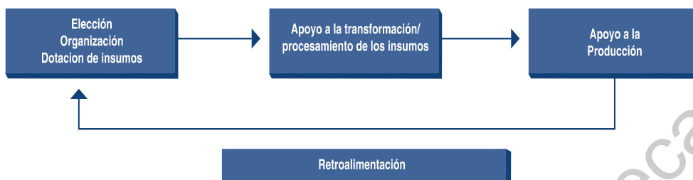
Figura 1. Diagrama de la Reforma Integral de la Educación Media Superior