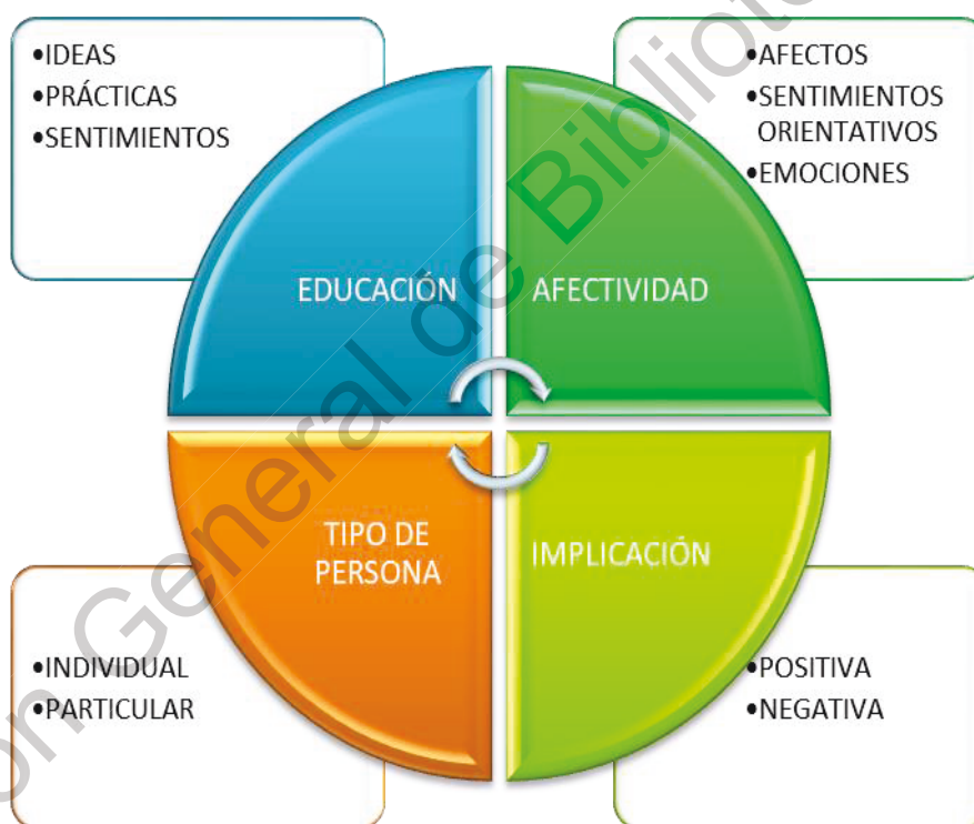
Figura1. Esquema de elaboración propia

El siguiente análisis lo realicé considerando las nuevas categorías emergidas de los resultados obtenidos en las técnicas e instrumentos utilizados: entrevista conversacional, cuestionario y observación participante. Para llevar a cabo el criterio de la interpretación, y así comprender el sentido y significado de la experiencia vivida por las maestras de la primaria ante su forma de ser y de valorar la afectividad, cuando se relacionaban con los alumnos que tenían alguna necesidad educativa especial, elaboré un esquema con las categorías que sustentan los resultados a los que llegué con esta investigación: