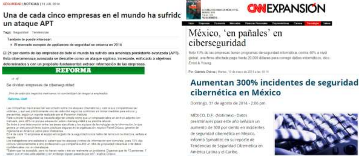
Figura 1-2 Datos oficiales sobre delitos informáticos en México.