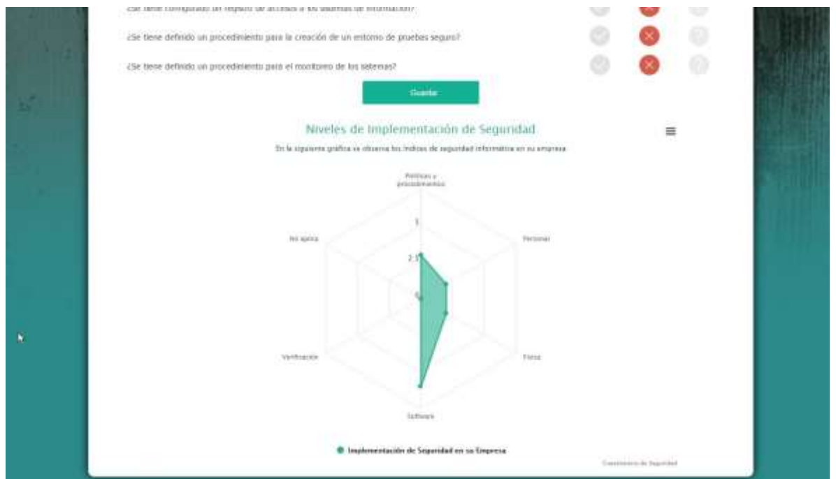
Figura 6-1 Resultado implementación metodología.

La recomendación en este diagnóstico fue la de implementar los controles necesarios para fortalecer las categorías restantes tales como seguridad física, la relacionada al personal y la orientada a la verificación.