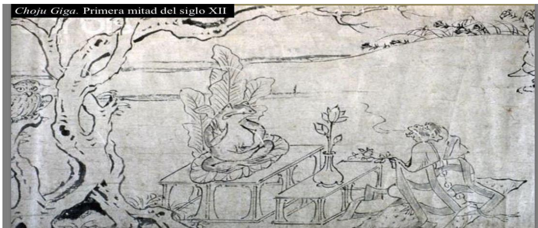
Imagen 1. Choju Giga , siglo XII.