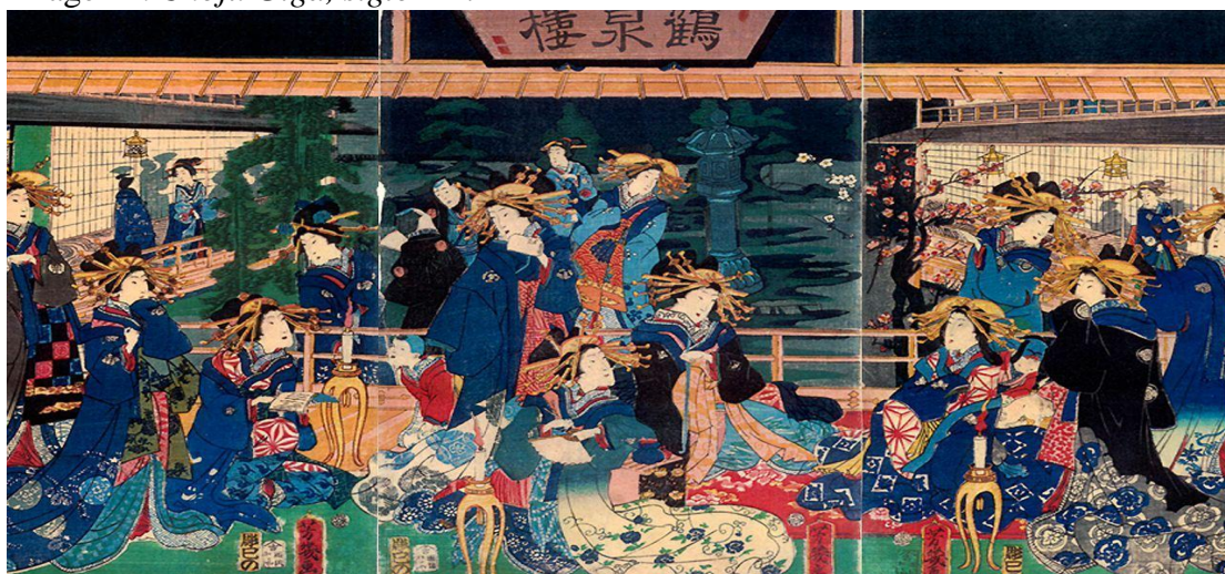
Imagen 2. Ukiyoe , siglo XVI- XVII