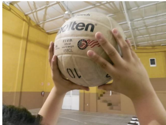
Figura 52. Dedos separados