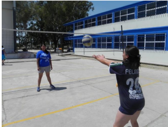
Figura 85. Lanzamiento con sentadilla

3.- Descripción: por parejas separados mínimo 5 metros, juntar los antebrazos y colocar el balón en la palma de las manos, realizar una sentadilla completa y al levantarse lanzar el balón simulando un golpe de antebrazo (Figura 85).