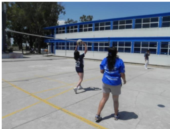
Figura 76. Cuerpo debajo del balón

4.- Descripción: lanzar el balón al aire, dejarlo que bote, posicionar el cuerpo debajo del balón con las manos arriba y realizar un boleo, el trabajo debe ser continuo por lo que la altura de los voleos será considerable para la buena ejecución del ejercicio (Figura 76).