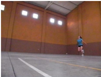
Figura 28. Inicia carrera

En la carrera el jugador controla los pasos que debe dar para realizar el servicio (Figura 28, 29 y 30), deberá dar tantos pasos sean posibles de acuerdo a la distancia de separación de la línea de servicio.