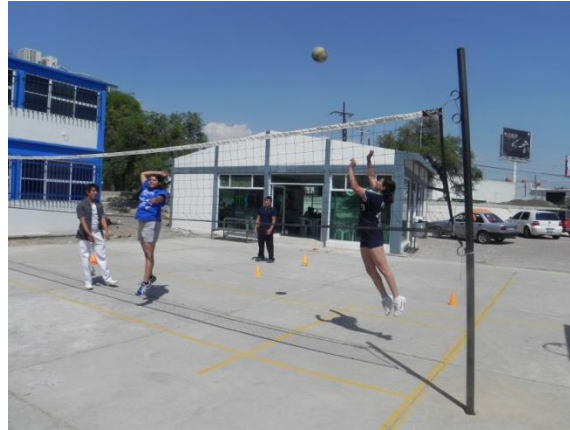
Figura 102. Remate alternado

9.- Descripción: por parejas, el entrenador lanzara balones a un acomodador fijo que colocara balones en el centro y por la banda alternando los lanzamientos, la pareja que trabaja rematará cierta cantidad de balones en cada posición para después hacer cambio. El resto de los jugadores surten de balones al entrenador (Figura 102).