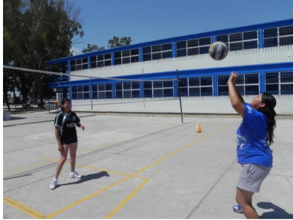
Figura 77. Voleo continuo en parejas

5.- Descripción: voleo por parejas comenzando en una distancia de dos metros y aumentando hasta llegar a nueve metros, no pueden aumentar distancia hasta terminar cierta cantidad de repeticiones en una misma distancia (Figura 77).