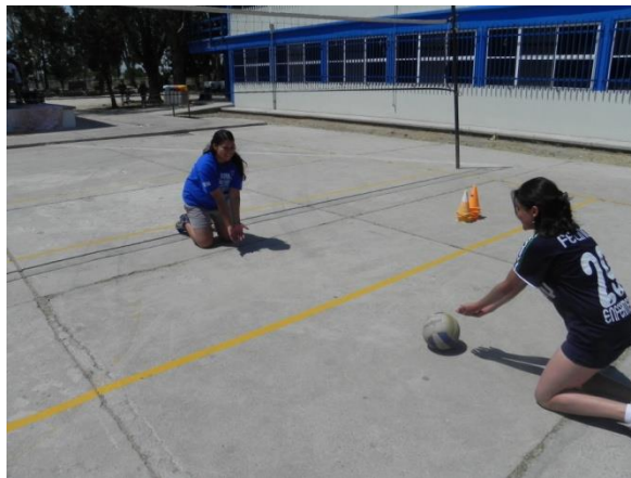
Figura 83. Preparación para golpe de antebrazo

1.- Descripción: hincados por parejas con una separación mínima de 5 metros, juntar los antebrazos y lanzar el balón rodando al compañero solo con el impulso de las manos, sin flexionar los codos (Figura 83).