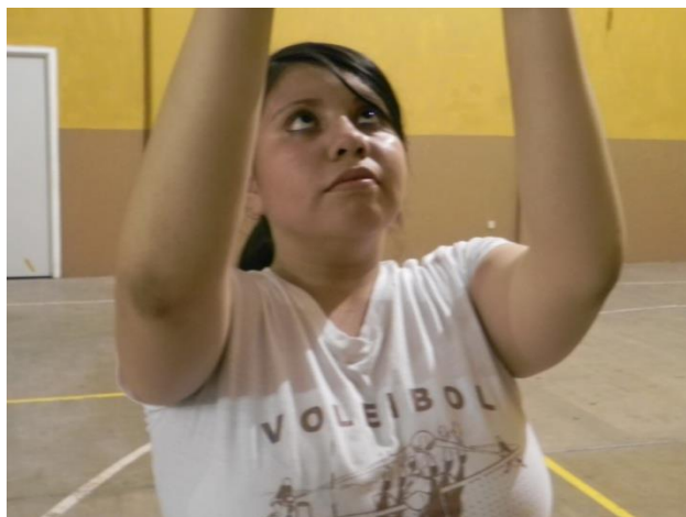
Figura 50. Codos

7. Codos: es muy importante que los codos no estén abiertos con dirección a los lados, deberán estar lo más juntos posibles (Figura 50), ya que el abrir los codos deforma la posición correcta de las manos y se puede llegar a hacer un mal contacto con el balón.