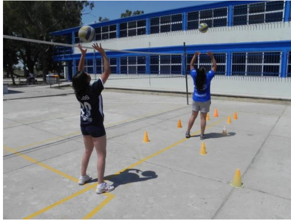
Figura 75. Voleo en cuadros

3.- Descripción: delimitar varios perímetros de diferente tamaño en orden de mayor a menor, en donde el jugador deberá realizar cierta cantidad de voleos empezando con el perímetro mayor y no podrá cambiar de perímetro hasta culminar en el actual (Figura 75).