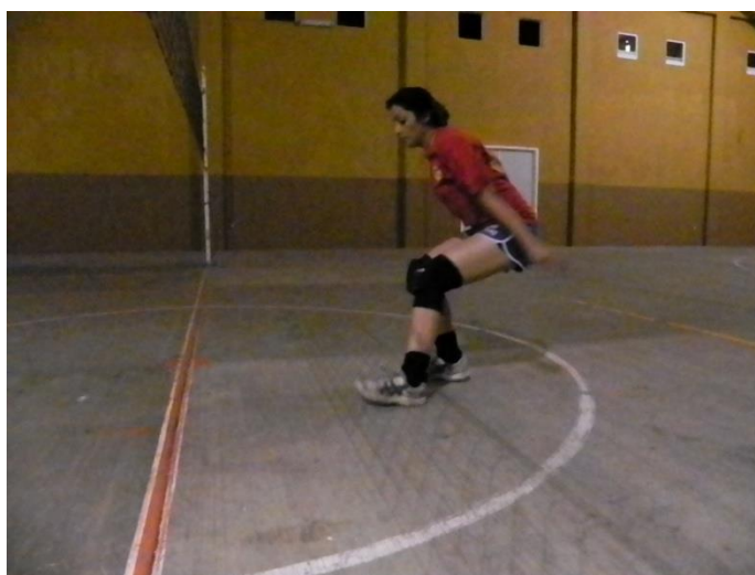
Figura 58. Paso de batida o ajuste