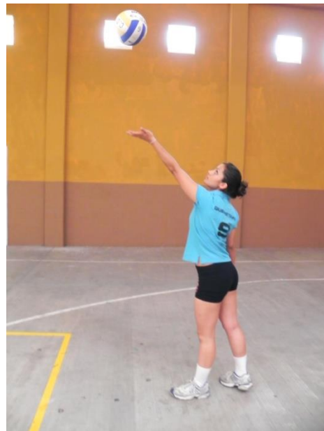
Figura 14. Balón al frente y arriba.