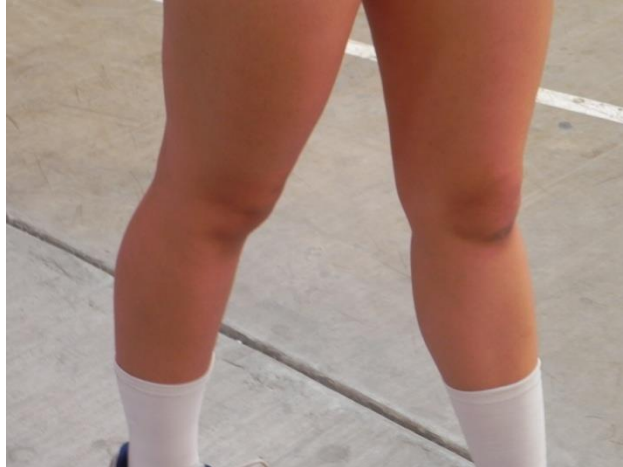
Figura 10. Rodillas

2. Rodillas: no se flexionaran durante el gesto técnico (Figura 10) ya que una variación en la posición inicial, al estar el balón en movimiento, dificultaría la ubicación espacio temporal del jugador para hacer el contacto con el balón.