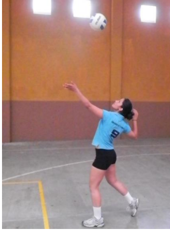
Figura 8. Servicio de tenis