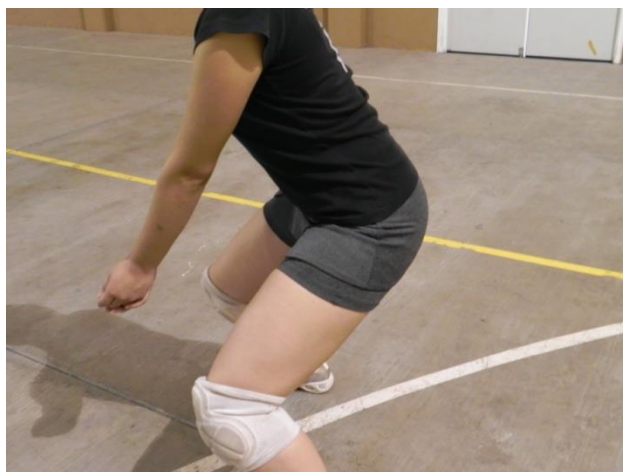
Figura 39. Espalda