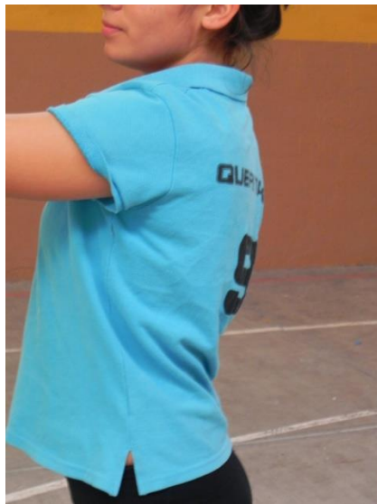
Figura 11. Espalda

3. Espalda: en posición natural de parado (Figura 11).