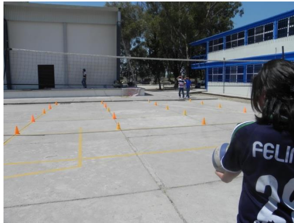
Figura 69. Servicio a carriles

7.- Descripción: realizar servicio de gancho intentando colocar el balón en cualquiera de los carriles de posición: dos, centro y cuatro (Figura 69).