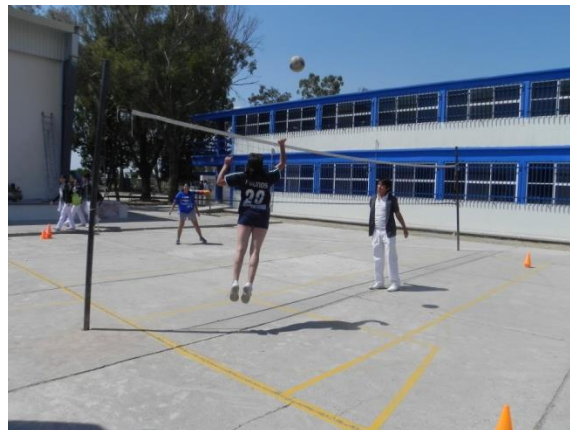
Figura 103. Remate alternado controlando el lanzamiento

10.- Descripción: formar dos filas, una en el centro y otra en la banda, habrá un acomodador fijo que colocara balones alternados a estas dos posiciones en donde cada jugador deberá lanzarle el balón para después realizar un remate (Figura 103).