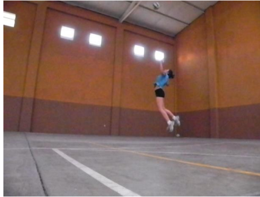
Figura 32. Fase aérea

El contacto con el balón se realiza con el brazo ejecutor que se desplazara desde atrás de la cabeza hasta la posición en el aire del balón (Figura 33), al realizar dicho contacto con la mano abierta completamente, esta toma la forma circular del balón y la articulación de la muñeca realizara una flexión inmediata que imprimirá un efecto extra al balón, lo que lo llevara a bajar hacia la cancha contraria una vez superada la altura y distancia de la red. En esta fase la hiper-extension de la cadera se pierde ya que la fuerza del brazo y de toda la musculatura del tren superior se utiliza para golpear el balón, lo cual por inercia hace que el cuerpo pierda dicha hiper-extension y se invierta.