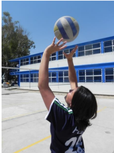
Figura 73. Posición de manos

1.- Descripción: Tomar el balón con la posición correcta (ver figura 50 y 51), realizar una flexo-extensión de brazos y lanzar el balón al aire, al caer se deberá tomar con la posición antes mencionada (Figura 73).