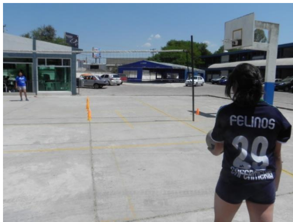
Figura 70. Servicio recto

9.- Descripción: se formaran 2 filas colocadas en las 2 líneas de servicio, los jugadores que se encuentren a la derecha de la zona de servicio realizaran un saque cruzado por encima de la red a zona 1 y 2 y correrán en línea recta a formarse en la fila contraria, y así pasaran sucesivamente todos los jugadores a realizar su servicio. El servicio debe ser paulatino, es decir, primero ejecutara el jugador de una fila y una vez realizado le seguirá el de la fila contraria, para así evitar un probable choque de balones en el aire (Figura 71).