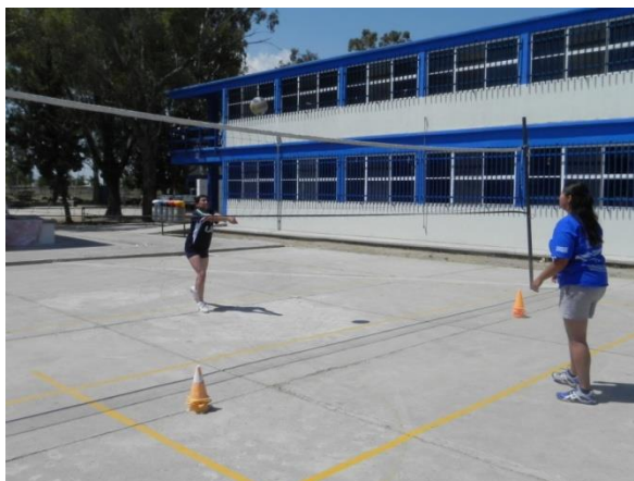
Figura 92. Golpe de antebrazo en tren

10.- Descripción: dos filas en canchas opuestas y de frente, realizar golpe de antebrazo por encima de la red sin dejar caer el balón, al golpear se deberán formar detrás de su fila (Figura 92).