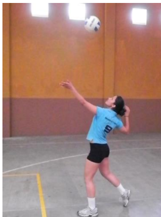
Figura 15. Brazo atrás