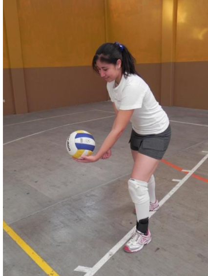
Figura 1. Servicio de gancho