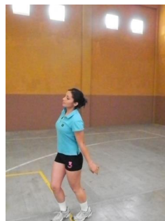
Figura 17. Ingreso