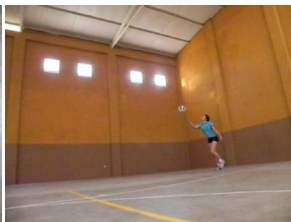
Figura 26. Lanzamiento