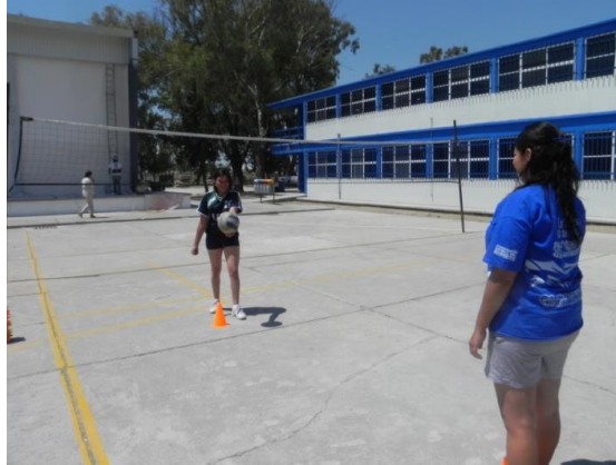
Figura 64. Servicio de gancho en pareja

3.- Descripción: realizar servicio de gancho desde la línea de saque intentando pasar la red (Figura 65).