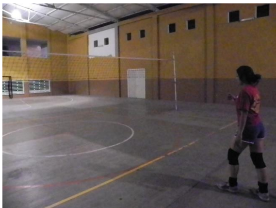
Figura 54. Primer paso