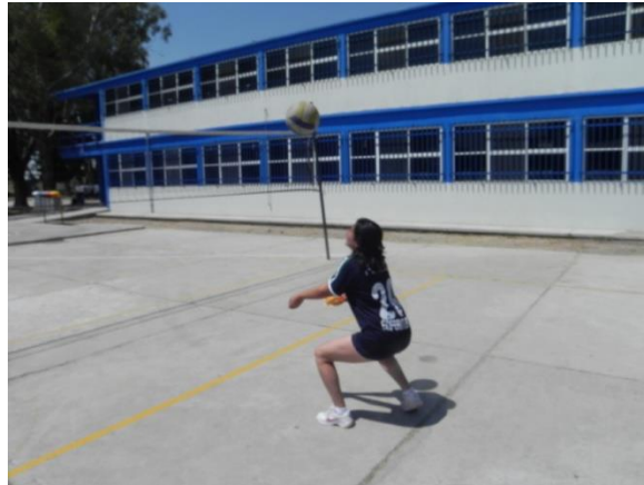
Figura 87. Bote y golpe de antebrazo

5.- Descripción: lanzar el balón al aire, dejar que de un bote y realizar un golpe de antebrazo que lo eleve nuevamente para repetir el ejercicio (Figura 87).