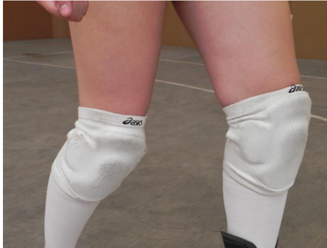
Figura 3. Rodillas

2. Rodillas: deberán estar flexionadas al momento de iniciar el gesto técnico (Figura 3) y cambiarán constantemente su angulación desde el inicio del mismo hasta su finalización, buscando que ayuden junto con los pies a mantener el equilibrio corporal además de proveer de fuerza al balón.