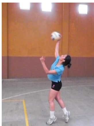
Figura 16. Contacto