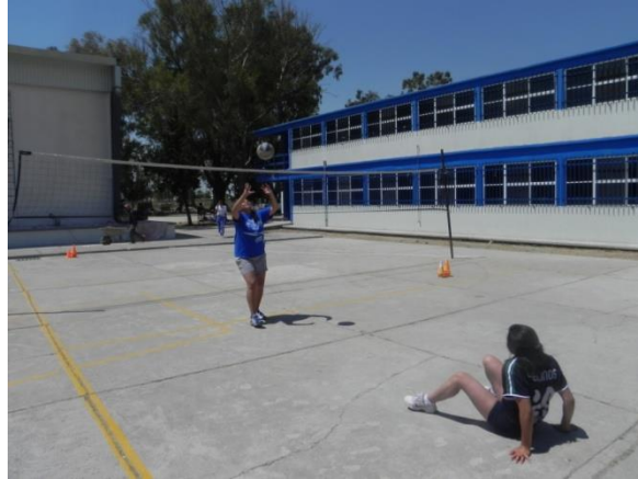
Figura 79. Voleo y sentarse

7.- Descripción: por parejas a una distancia de 4 metros mínimo, realizar cierta cantidad de voleos en donde después de haber realizado el gesto técnico deberá sentarse y pararse rápidamente para volear nuevamente (Figura 79).