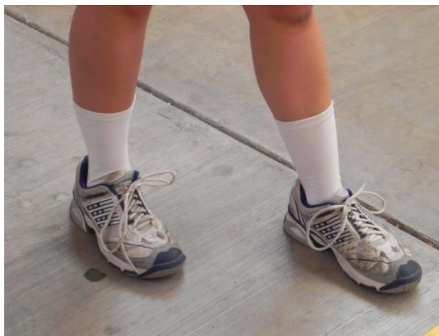
Figura 19. Pies

1. Pies: deberán estar uno adelante de otro dependiendo la lateralidad del jugador, si el mismo es diestro el pie adelantado será el izquierdo, por el contrario si el jugador es zurdo el pie adelantado será el derecho. Los pies mantendrán una separación con referencia a la anchura de los hombros para así mantener una buena estabilidad corporal antes de comenzar el movimiento (Figura 19).