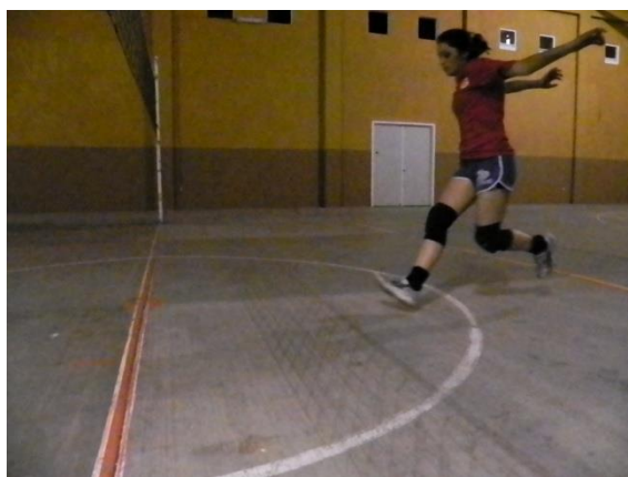
Figura 57. Paso amplio y potente