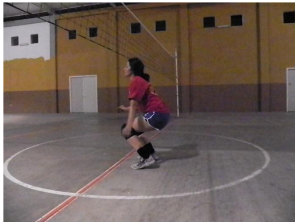
Figura 62. Punta-talón