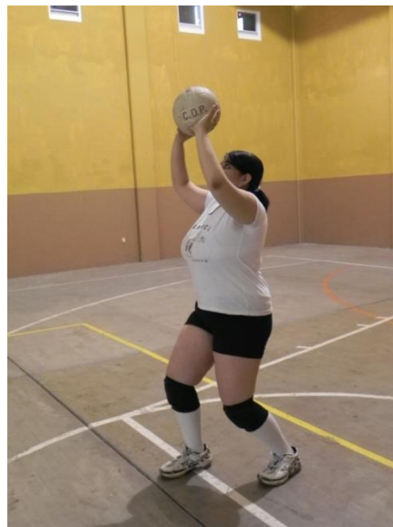
Figura 48. Vista al balón