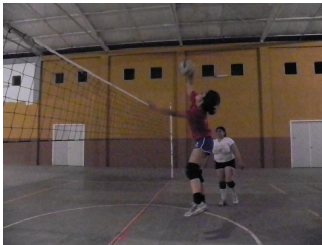
Figura 60. Contacto y posición del cuerpo

En esta fase el jugador lanza el brazo ejecutor hacia delante y abajo, al mismo tiempo que flexiona el tronco y las piernas hacia delante. El balón es golpeado con el brazo totalmente extendido por delante del eje del cuerpo con la mano abierta y rígida para imprimirle fuerza (Figura 60). Se le imprime un efecto hacia abajo al balón al momento del golpe, esto se realiza con una flexión de la articulación de la muñeca. Después del golpeo, el brazo sigue su recorrido hacia abajo lo más próximo posible al cuerpo evitando tocar la red.