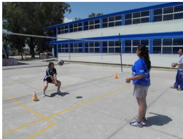
Figura 90. Golpe de antebrazo y desplazamiento lateral

8.- Descripción: por tercias uno trabaja y 2 con balón, los que tienen balón lo lanzaran paulatinamente a cada lado del jugador que deberá responder con golpe de antebrazo cada balón constantemente (Figura 90).