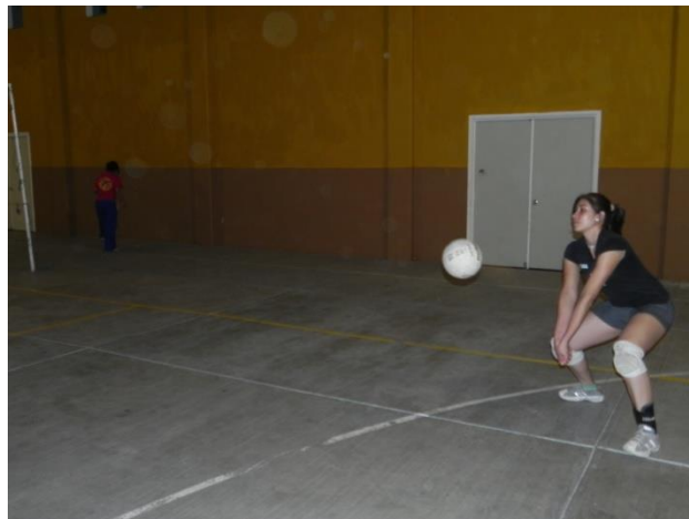
Figura 35. Golpe de antebrazo

En su apartado de recepción, Jeff Lucas con su libro "RECEPCION, COLOCACION Y ATAQUE EN EL VOLEIBOL" muestra teórica y gráficamente la posición fundamental del golpe de antebrazo, con explicaciones detalladas en los movimientos y posiciones de segmentos corporales para la realización de una buena técnica. Muchos de los puntos expuestos en esta bibliografía se exponen en la siguiente descripción del ejercicio.