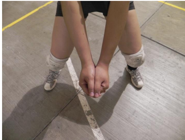
Figura 42. Posición de manos

7. Manos: para mantener la posición de los antebrazos estable es necesario que la posición de las manos los fortalezca y esto se logra empuñando una de las manos y cubriéndola con la otra permitiendo que los pulgares se encuentren juntos y paralelos (Figura 42).