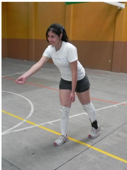
Figura 7. Introducción a la cancha