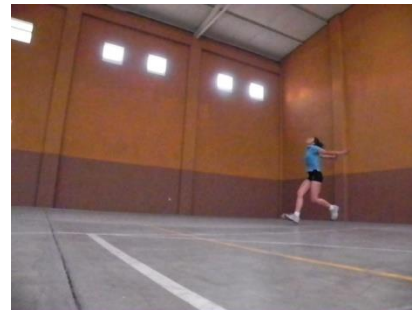
Figura 29. Preparación de salto