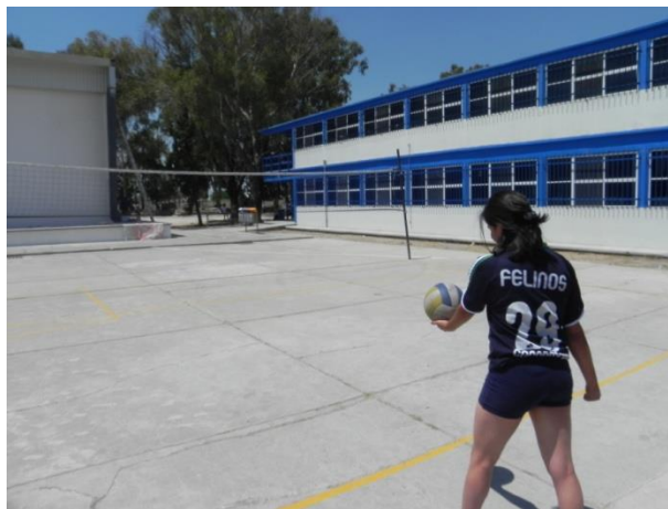
Figura 65. Servicio de gancho desde línea de saque

3.- Descripción: realizar servicio de gancho desde la línea de saque intentando pasar la red (Figura 65).