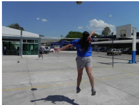
Figura 99. Remate con salto superando la red

6.- Descripción: por parejas, situarse de frente una de cada lado de la cancha, lanzar el balón al frente, realizar carrera de remate y golpear el balón para que pase del otro lado con un remate. Con principiantes bajar la altura de la red (Figura 99).