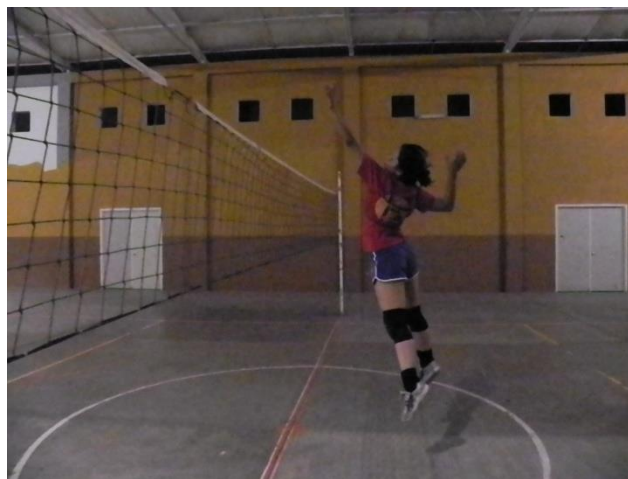
Figura 59 Especificidad de segmentos en el remate

Cuando el jugador alcanza su máxima altura la posición correcta sería: hiperextensión de columna, flexión de rodillas, brazo ejecutor preparado por detrás de la cabeza, codo cerca de la oreja, lo que supone una flexión del codo, mano del mismo brazo abierta, y el brazo contrario ligeramente adelantado para medir la posición de golpeo de balón como se muestra en la figura 59, sin embargo en algunos jugadores pueden existir deformaciones en la técnica que pueden o no afectar el resultado del elemento, dependiendo de la capacidad del jugador y el nivel de entrenamiento que posee, como se muestra con la flexión de rodillas en dicha figura.