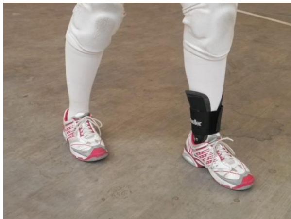
Figura 2. Pies

1. Pies: deberán estar uno adelante de otro dependiendo la lateralidad del jugador, si el mismo es diestro el pie adelantado será el izquierdo, por el contrario si el jugador es zurdo el pie adelantado será el derecho. Los pies mantendrán una separación con referencia a la anchura de los hombros (Figura 2) para así mantener una buena estabilidad corporal y deberán encontrarse con las puntas hacia el frente.