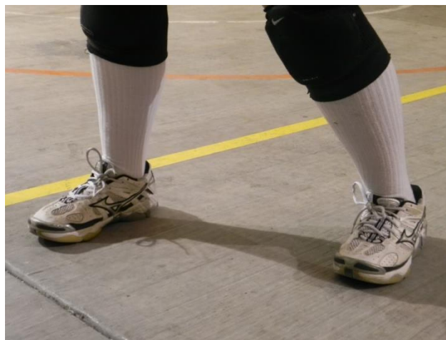
Figura 44. Pies