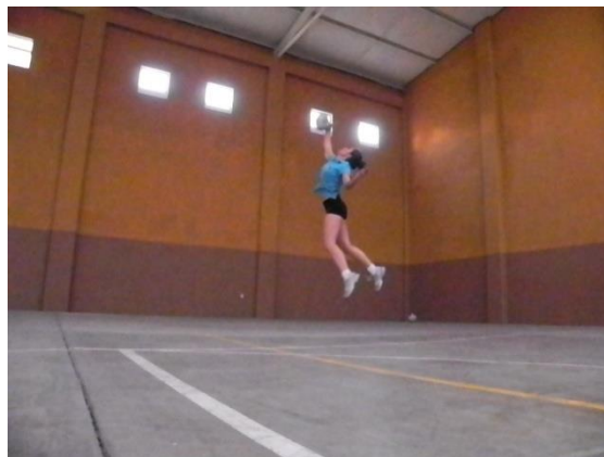
Figura 33. Contacto con el balón

El contacto con el balón se realiza con el brazo ejecutor que se desplazara desde atrás de la cabeza hasta la posición en el aire del balón (Figura 33), al realizar dicho contacto con la mano abierta completamente, esta toma la forma circular del balón y la articulación de la muñeca realizara una flexión inmediata que imprimirá un efecto extra al balón, lo que lo llevara a bajar hacia la cancha contraria una vez superada la altura y distancia de la red. En esta fase la hiper-extension de la cadera se pierde ya que la fuerza del brazo y de toda la musculatura del tren superior se utiliza para golpear el balón, lo cual por inercia hace que el cuerpo pierda dicha hiper-extension y se invierta.