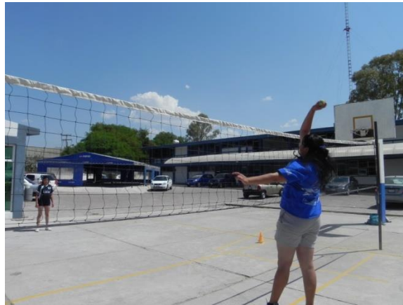
Figura 98. Remate con pelota de tenis

5.- Descripción: con una pelota de tenis realizar carrera de remate y al saltar tratar de impactar la pelota en la cancha contraria lo más cercano a la red posible (Figura 98).