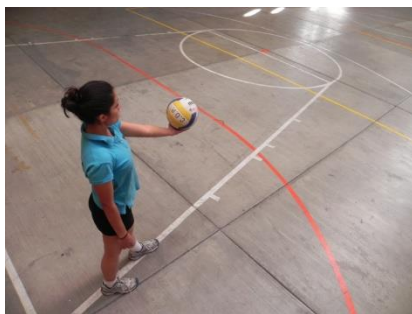
Figura 25. Distancia

Al momento de comenzar el movimiento para realizar el servicio con salto, el ejecutante deberá estar varios metros detrás de la línea de servicio (Figura 25) con la finalidad de emprender una carrera libre y no cometer una sanción al pisar la línea. El balón deberá ser lanzado a una altura aproximada de 3 a 5 metros (Figura 26 y 27), esto, dependiendo de la potencia de salto que tenga el jugador y la colocación del balón deberá ser al frente del jugador.