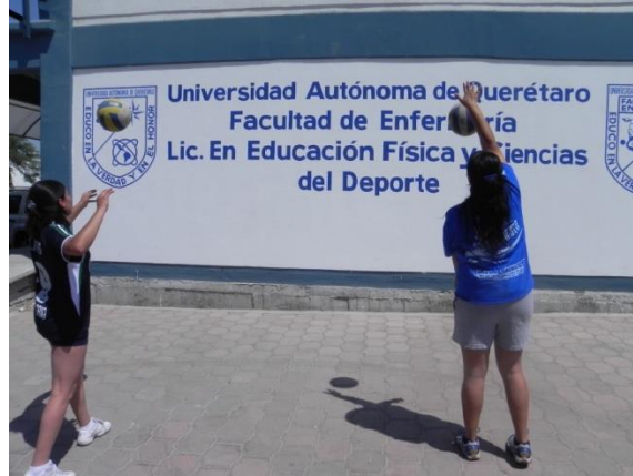
Figura 96. Remate en pared

3.- Descripción: lanzar el balón al aire con las dos manos y realizar remate contra la pared tratando que el balón toque el suelo antes de hacer contacto con la pared (Figura 96).