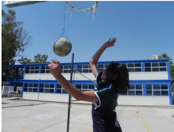
Figura 100. Remate a balón fijo

7.- Descripción: se cuelga un balón de una superficie alta y al saltar para contactarlo se trata de golpear en la parte superior del balón (Figura 100).