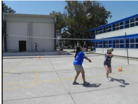
Figura 89. Golpe de control y ejecución

7.- Descripción: lanzar el balón al aire, dejar que de un bote y realizar 2 golpes de antebrazo continuos, uno de control (poca altura) y uno de lanzamiento (altura media a alta) (Figura 89).