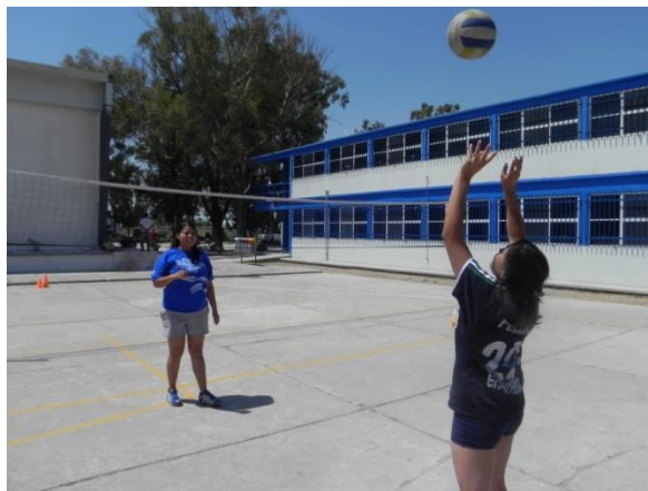
Figura 80. Voleo corto y pase

8.- Descripción: por parejas estarán voleando continuamente realizando 2 ejecuciones en el mismo turno, un voleo de control a poca altura, y un voleo de ejecución para pasar al compañero (Figura 80).