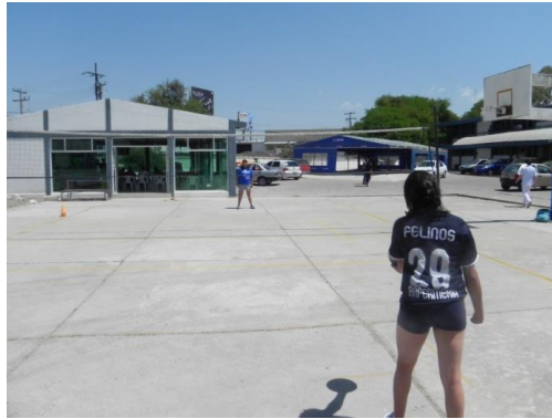
Figura 72. Servicio constante

10.- Descripción: una fila de jugadores en línea de saque, el resto distribuidos en la cancha contraria. El jugador que realizara el trabajo deberá hacer 3 series en diferentes zonas de la línea de servicio de una cantidad numerosa en cada una con el objetivo de practicar y perfeccionar el servicio de gancho. Habrá 2 jugadores ayudando a surtir de balones y los demás recogiendo los mismos para no perder tiempo (Figura 72).