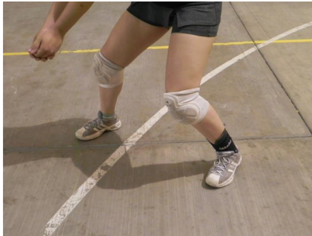
Figura 36. Pies

1. Pies: colocados a una anchura un tanto mayor a la separación de los hombros, con las puntas de los pies apuntando hacia el frente y la planta del pie completamente unida al suelo al momento del contacto con el balón (Figura 36).