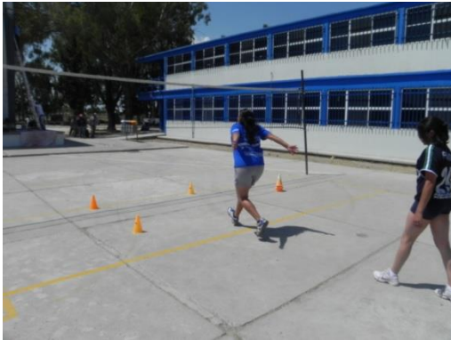
Figura 93. Zona de salto

1.- Descripción: marcar la zona de salto (Figura 93) y la zona de caída (Figura 94) y realizar múltiples ejecuciones de la carrera de remate cuidando no adelantarse de la zona de salto y no tocar la red o cometer invasión al caer.