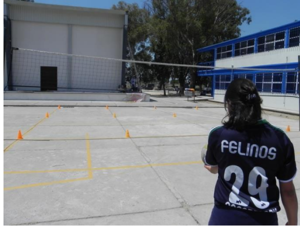
Figura 68. Servicio dirigido a zonas

7.- Descripción: realizar servicio de gancho intentando colocar el balón en cualquiera de los carriles de posición: dos, centro y cuatro (Figura 69).