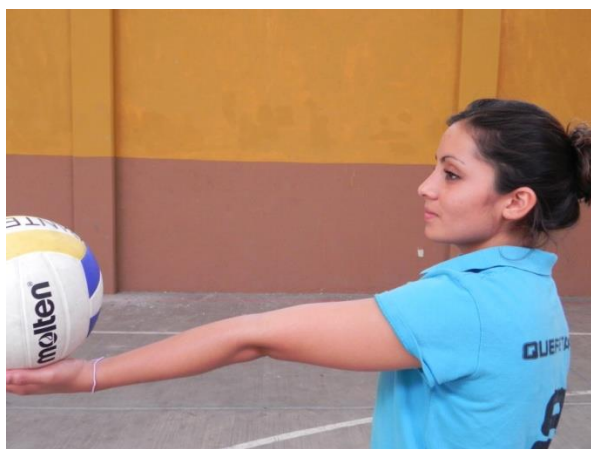
Figura 22. Mirada a la cancha contraria

4. Cabeza: deberá estar en dirección a la cancha contraria (Figura 22), ya que aunque no se puede controlar completamente la dirección que se le da al balón, el jugador debe asegurarse de pasar el balón por encima de la red y que caiga dentro de las líneas que limitan el campo contrario. Posteriormente la vista y por ende la cabeza deberá ubicar la distancia entre el jugador y la línea de servicio para no pisarla y realizar un servicio erróneo (Figura 23). Por último la vista se enfoca en la trayectoria del balón, lo cual requiere de una especialización en la coordinación óculo motriz para hacer un contacto efectivo en la fase aérea.