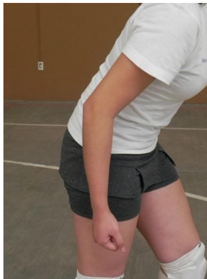
Figura 4. Espalda

3. Espalda: inclinada ligeramente hacia delante y recta en todo momento para favorecer la postura de la cabeza y con esto la visión del campo (Figura 4).