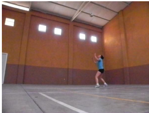
Figura 31. Contacto y flexión

El contacto es el momento de la fase en el que el jugador planta los 2 pies en el suelo, acompañado de una inminente flexión de rodillas, cadera y balanceo de brazos de atrás hacia delante y arriba, lo cual permitirá hacer un despegue más potente del suelo hacia la altura en que se hará contacto con el balón, los pies deberán estar uno delante de otro dependiendo la lateralidad del jugador con una separación mínima aproximada a la anchura de los hombros que ayudara a la estabilidad del salto como se muestra en la figura 31.