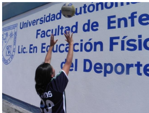
Figura 74. Voleo continuo en pared

2.- Descripción: realizar series de voleos cortos a poca distancia de la pared, haciendo que el balón rebote en esta para seguir voleando continuamente. Aumentar la distancia progresivamente (Figura 74).