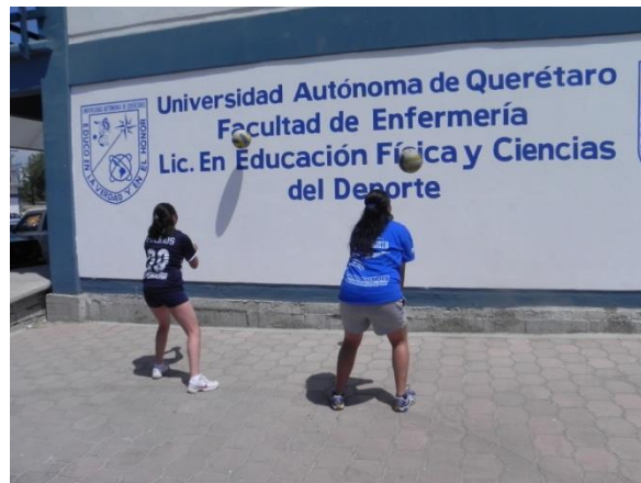
Figura 88. Golpe de antebrazo en pared

6.- Descripción: parados frente a una pared realizar golpe de antebrazo continuo tratando de controlar la fuerza y dirección del golpe (Figura 88).