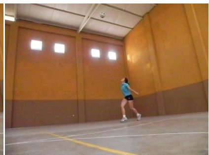
Figura 27. Altura