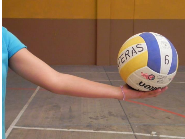
Figura 13. El brazo que lanza sostiene el balón.