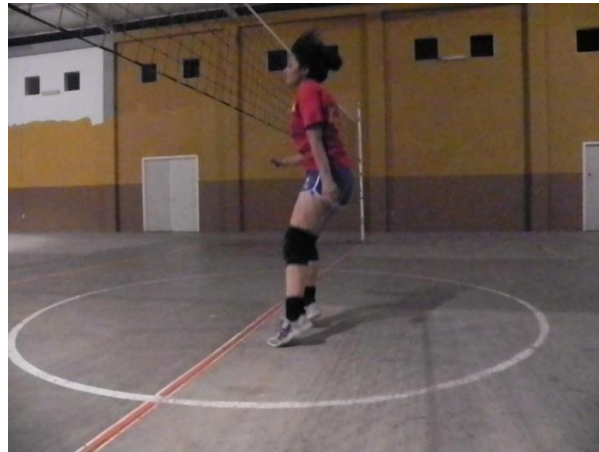
Figura 61. Inicio de caída

este realiza su caída desequilibrada con un solo pie, ya que en este caso todo el peso del cuerpo mas la fuerza de gravedad al caer impacta directamente sobre la rodilla y generalmente cuando se cometen este tipo de errores el jugador también incurre en no amortiguar su caída correctamente por falta de equilibrio y fuerza.