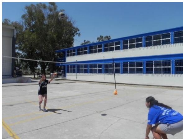
Figura 78. Voleo y tocar el suelo

6.- Descripción: por parejas a una distancia de cuatro metros mínimo, realizar cierta cantidad de voleos en donde después de haber realizado el elemento deberá tocar el suelo con las 2 manos y esperar el balón que viene de regreso (Figura 78).