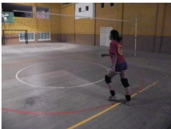
Figura 56. Tercer paso en carrera