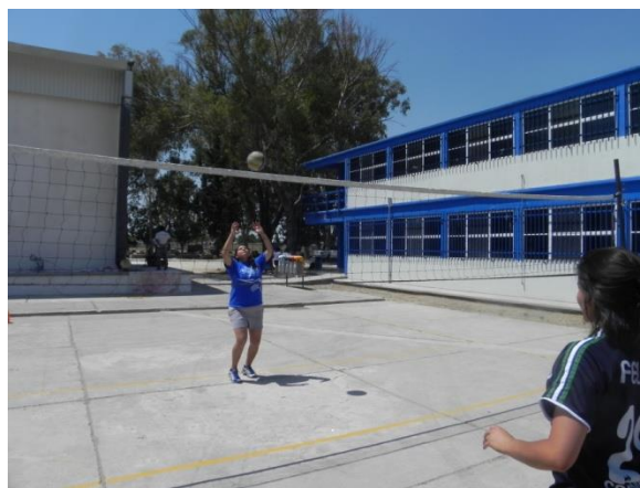
Figura 82. Voleo en tren

10.- Descripción: se formaran 2 filas de frente separadas por la red a una distancia equivalente a la zona de delanteros. Realizar voleo continuo por encima de la red en donde después de haber ejecutado el movimiento el jugador se formara en su misma fila atrás (Figura 82).