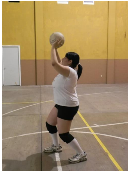
Figura 47. Espalda