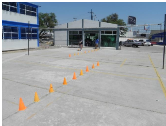
Figura 71. Servicio cruzado

9.- Descripción: se formaran 2 filas colocadas en las 2 líneas de servicio, los jugadores que se encuentren a la derecha de la zona de servicio realizaran un saque cruzado por encima de la red a zona 1 y 2 y correrán en línea recta a formarse en la fila contraria, y así pasaran sucesivamente todos los jugadores a realizar su servicio. El servicio debe ser paulatino, es decir, primero ejecutara el jugador de una fila y una vez realizado le seguirá el de la fila contraria, para así evitar un probable choque de balones en el aire (Figura 71).