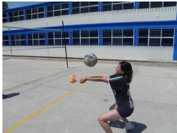
Figura 86. Lanzamiento y contacto

4.- Descripción: lanzar el balón al aire, realizar posición de golpe de antebrazo y hacer contacto con el balón sin darle fuerza (Figura 86).