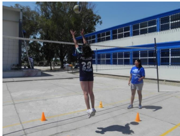
Figura 95. Atrapar el balón

2.- Descripción: por parejas, uno lanza el balón al aire y el otro realiza carrera de remate, salta y lo atrapa en el punto más alto posible con las dos manos (Figura 95).