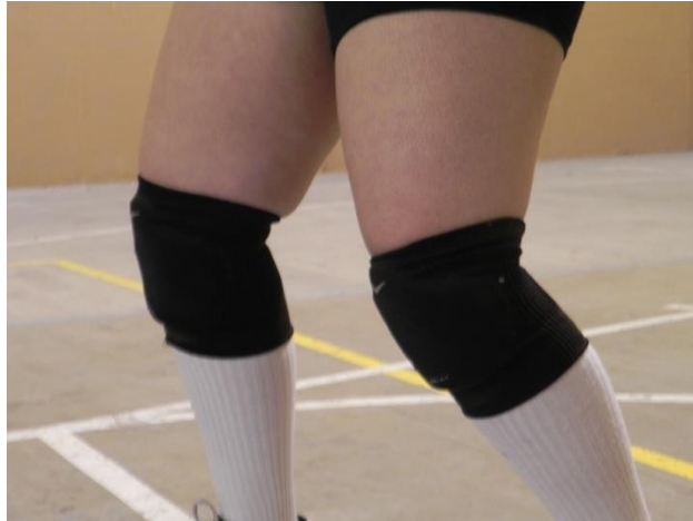
Figura 45. Rodillas

2. Rodillas: antes del contacto con el balón estas se mantendrán ligeramente flexionadas (Figura 45) con el objetivo de que, al hacer contacto con el balón, se puedan extender completamente para agregarle fuerza al movimiento y el balón llegue a su destino.