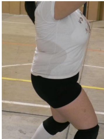
Figura 46. Cadera

3. Cadera: flexionada ligeramente hacia delante sin perder la visibilidad del balón (Figura 46).