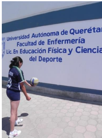
Figura 63. Servicio de gancho

1.- Descripción: parados frente a una pared con una separación de 2 metros, el jugador se preparara para realizar un servicio de gancho en dirección a la pared sin que el balón caiga al rebotar en ella (Figura 63).