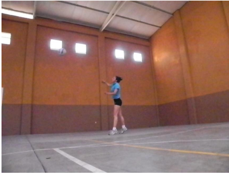
Figura 34. Caída con puntas

La caída es igual de importante que cualquiera de las fases, específicamente porque si no se hace una buena técnica de contacto con el suelo el atleta corre el riesgo de sufrir lesiones importantes. En esta fase el jugador se prepara para terminar el movimiento con la caída al mismo tiempo de los 2 pies, comenzando el contacto con el suelo con la punta de los pies (Figura 34) y conforme el peso se distribuye en las rodillas realizar una flexión de las mismas así como de la cadera para amortiguar la fuerza de impacto con el suelo.