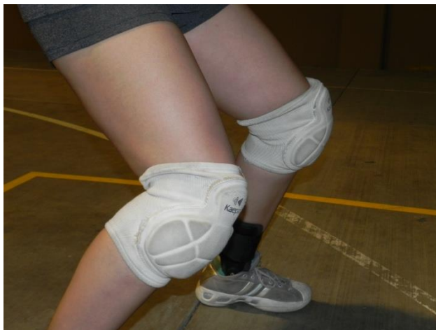
Figura 37. Rodillas

2. Rodillas: estas se mantendrán flexionadas a una angulación un poco mayor a 90 grados, lo que permite al jugador mantener una posición estática cómoda y mantener el equilibrio como se muestra en la figura 37.