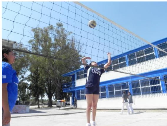
Figura 101. Remate al centro

8.- Descripción: por tercias entrar a rematar uno por uno un balón en el centro colocado por el entrenador, al rematar formarse en fila y esperar el siguiente turno, los demás jugadores recogen balones para abastecer al entrenador (Figura 101).