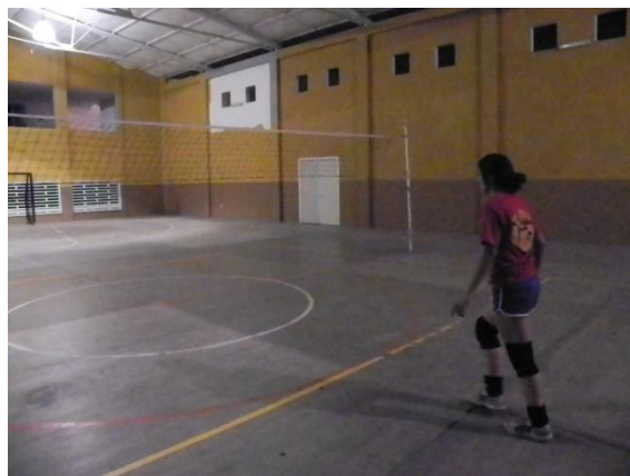
Figura 55. Segundo paso