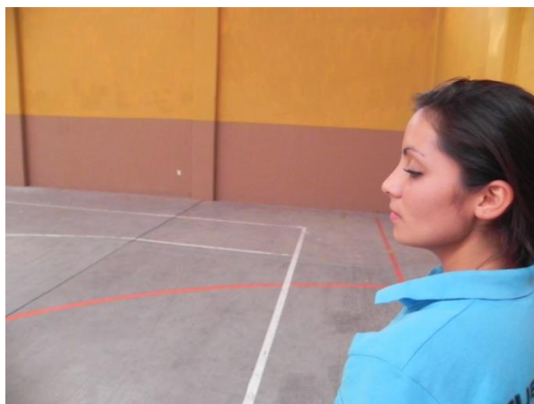
Figura 23. Ubicar la posición.

5. Brazos: el balón se lanzara con un brazo (regularmente el contrario al brazo ejecutor, sin embargo si se entrena se puede especializar el lanzamiento con el brazo ejecutor), el cual estará posado al frente del cuerpo en una altura cómoda para el jugador y que le permita realizar un lanzamiento de balón con la altura y distancia adecuadas para él, sosteniendo dicho balón con la palma de la mano, el brazo ejecutor se encuentra en posición normal en espera de iniciar el movimiento (Figura 24).