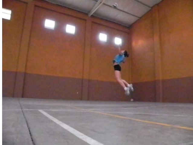
Figura 18. Servicio saltando