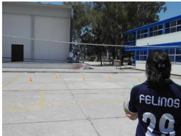
Figura 67. Servicio a conos

5.- Descripción: Realizar servicio de gancho intentando golpear diferentes objetos que estarán colocados en la cancha contraria (Figura 67).