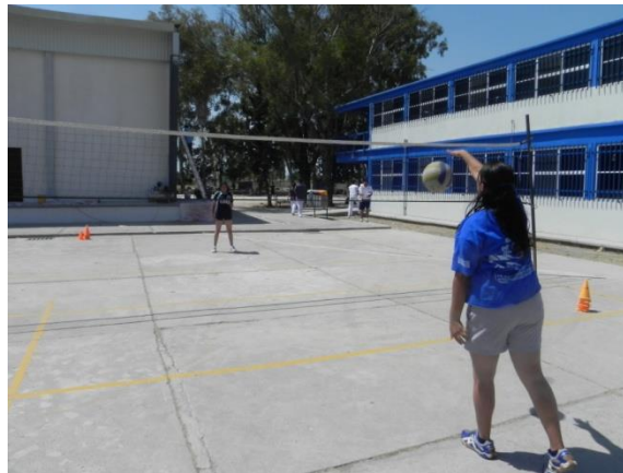
Figura 97. Remate al suelo superando la red

4.- Descripción: detrás de la línea de zagueros lanzar el balón al aire y rematar contra el suelo para que el balón pique y pase por encima de la red (Figura 97).