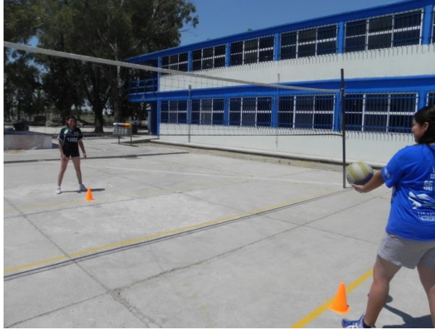
Figura 66. Servicio superando la red

5.- Descripción: Realizar servicio de gancho intentando golpear diferentes objetos que estarán colocados en la cancha contraria (Figura 67).