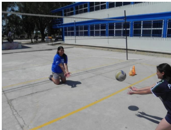
Figura 84. Elevar balón

2.- Descripción: hincados por parejas con una separación mínima de 5 metros, juntar los antebrazos y lanzar el balón por el aire al compañero con el impulso de todo el brazo, sin flexionar los codos (Figura 84).