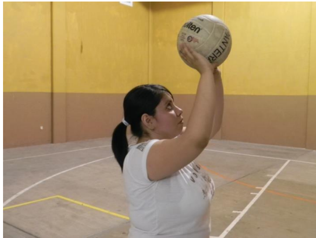
Figura 49. Brazos

6. Brazos: estarán elevados por encima de la cabeza sin llegar a una extensión completa (Figura 49), ya que a la hora de hacer contacto con el balón los codos realizaran un movimiento continuo de flexo-extensión para elevar el balón en la dirección deseada.