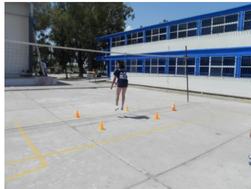
Figura 94. Zona de caída

2.- Descripción: por parejas, uno lanza el balón al aire y el otro realiza carrera de remate, salta y lo atrapa en el punto más alto posible con las dos manos (Figura 95).