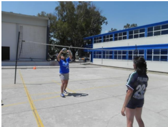
Figura 81. Voleos corto, medio y pase

9.- Descripción: por parejas estarán voleando continuamente realizando 3 ejecuciones en el mismo turno, dos voleos de control, uno corto y uno a altura media, y un voleo de ejecución para pasar al compañero (Figura 81).