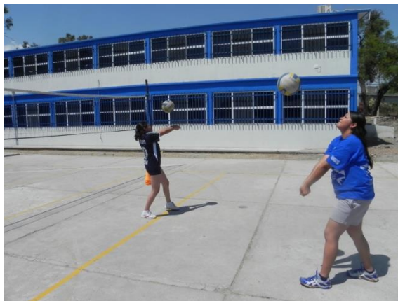
Figura 91. Golpe de antebrazo de control, medio y alto

9.- Descripción: realizar golpe de antebrazo constante sin dejar caer el balón, se hará uno corto, uno a altura media y uno con altura mayor, en ese orden específico (Figura 91).