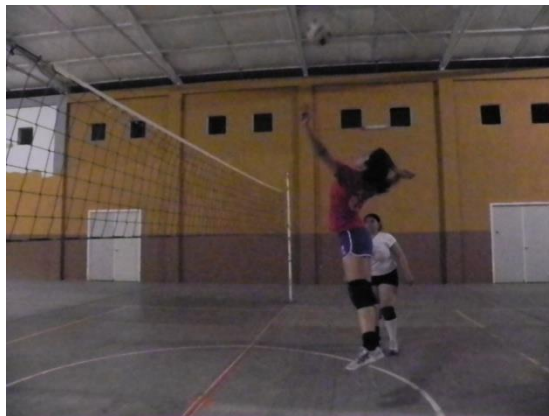
Figura 53. Remate

El remate es el elemento que culmina la fase ofensiva de una jugada, teniendo que superar la altura de la red y la defensa contraria (bloqueo y defensa de campo). Por mucho este elemento goza de una gran espectacularidad en comparación con los demás, debido a su destreza técnica y gran potencia (Figura 53).