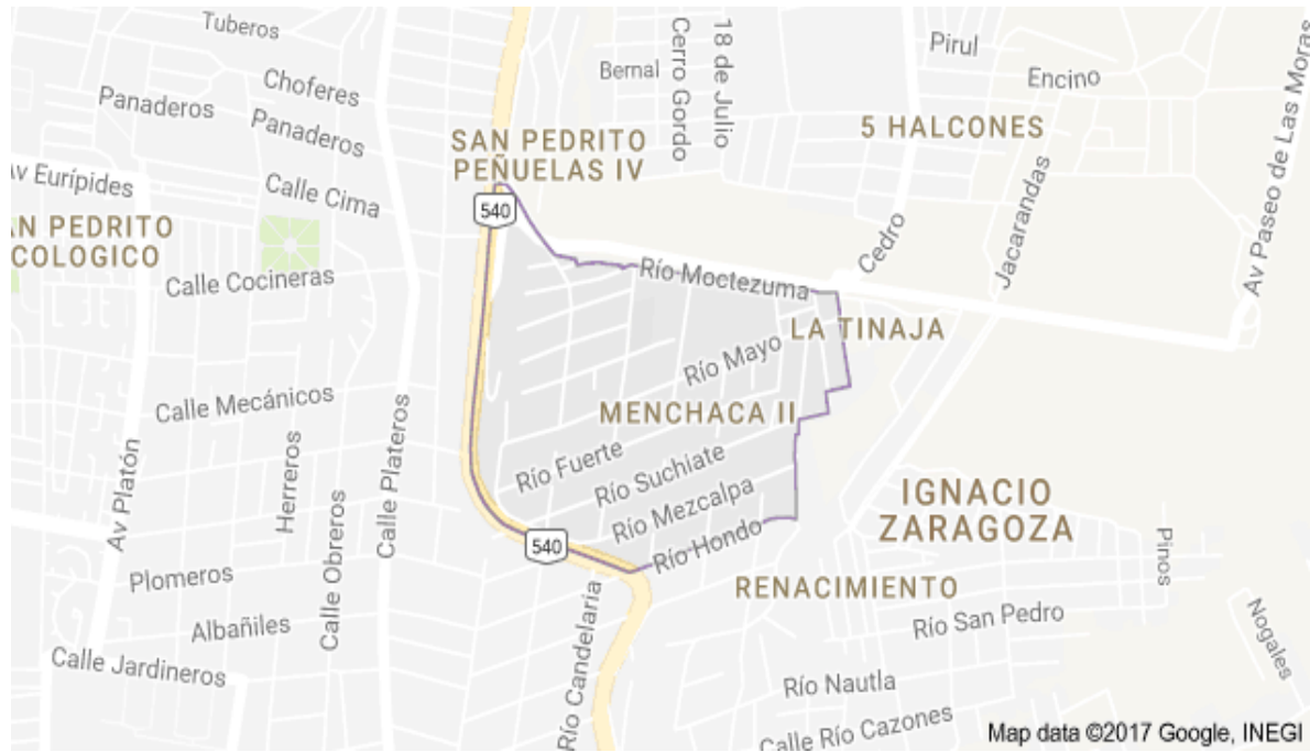
Mapa 2. Menchaca