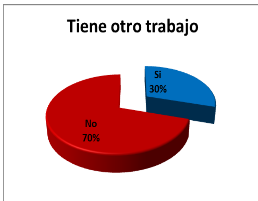
Gráfica 4.2 Tiene otro trabajo

Y acerca de la pregunta “Tiene otro trabajo”, del personal de salud que participó en la encuesta (n=81), el 29.6% contestó que “Sí” y el 70.4% que “No”, como se muestra en la gráfica 4.2.