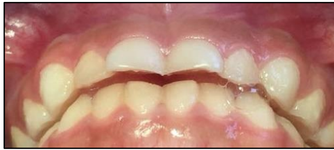
Fig. 6. Paciente con arco tipo III tanto en maxilar como en mandíbula

5.- Al finalizar la sesión se llevó al paciente con su tutor y se recogió la encuesta proporcionada al inicio de la cita.