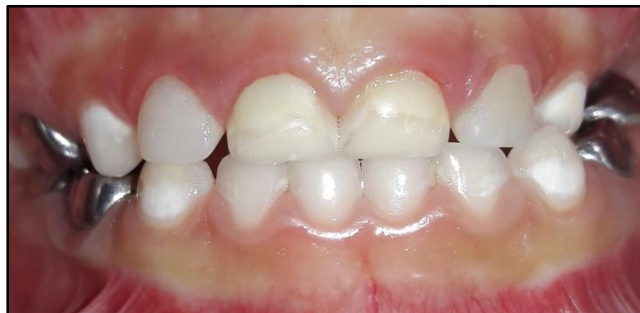
Fig. 5. Paciente con arco tipo II de Baume en mandíbula