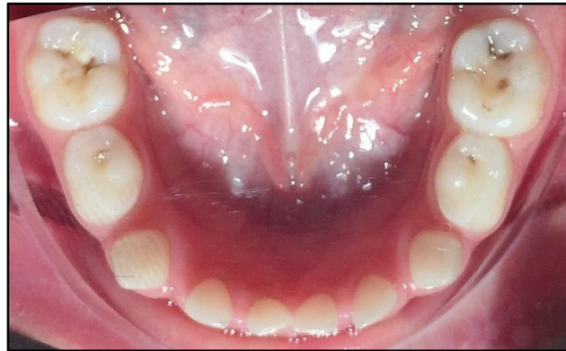
Fig. 4. Paciente con arco tipo I de Baume en mandíbula