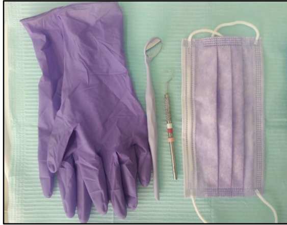
Fig. 3. Material utilizado durante la exploración clínica