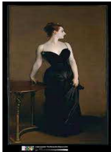
Figura 7. John Singer Sargent, Madame X (Madame Pierre Gautreau) (1884).

aquel momento y decidió retirarla del Salón de París. Tanto fue el disgusto en la comunidad que el pintor tuvo que mudarse a Londres. El autor guardó la pintura en su estudio por más de treinta años, no sin antes cubrir el hombro. Los derechos de la pintura le pertenecen al Metropolitan Museum of Art desde 1916, después de comprársela a Sargent por 1000 libras esterlinas, además, le prometieron cuidar la identidad de Madame Gautreau, pues se vió afectada en su vida personal por aquel lienzo.