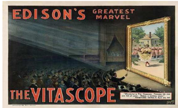
Figura 3. The Vitascope Advertisement (1896).

marco estaba presente incluso en la reproducción al inicio de la película, momento en el cual se presentaba el título y aparecía un fondo con un marco que se calificaba como adorno, hoy se le conoce como old movie title frame .