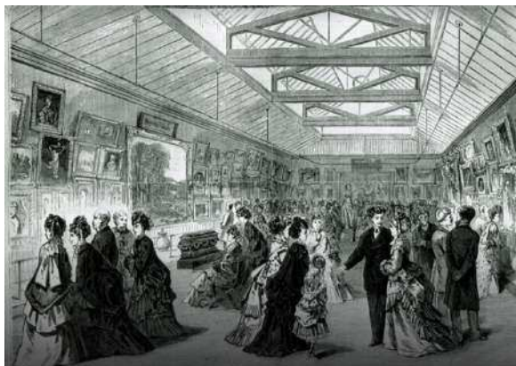
Figura 4. Harper's Weekly, The Metropolitan Museum of Art, opening reception in Dodworth Mansion, 1872

En referencia al passe-partout , es momento de hablar del espacio vacío del marco. Al estar abierto en el interior de su estructura, el marco deja aparecer la obra, así como el lugar donde puede ser reemplazada por otra que se desliza igualmente en el encuadre. Lo mismo pasa con las exposiciones o las salas de un museo, son espacios vacíos en donde se alojan y circulan distintas obras de arte, enmarcadas o encasilladas de acuerdo con el tema, la interpretación o el significado que las instituciones quieren presentar. Este gran espacio de paredes vacías, encuadra a las obras de arte que a su vez tienen un marco. Si bien estos sitios han sufrido cambios y han pasado de ser ostentosos, grandes y dorados, a tener una presentación más sencilla, pero siempre están presentes.