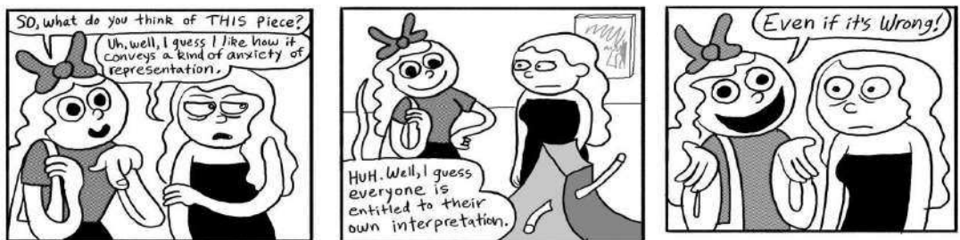
Figura 1. Walter Scott, Sandy, the Most Unlikable Person Ever, Visited the Museum (2022).

Se da por sentado lo que dicen los textos sobre la obra de arte. Estos juicios emitidos previamente no permiten ver a la obra desde la descripción, la perspectiva o la interpretación de cada receptor, sino que se ve a través de la mirada de otros, como se ejemplifica en las Figura 1. Pero también existen diferentes tipos de receptores que se sentirán invitados a interactuar con la obra de arte, desde su interpretación, dándole un sentido singular a esta a través de la apertura de la visión y reflexión propia, descentralizando la institucionalización del arte.