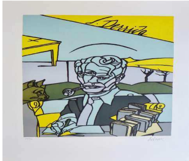
Figura 6. Valerio Adami, Portrait de Jacques Derrida (2004).

permite que el receptor reconstruya el todo de la obra. Sus pinturas hablan sobre poesía, literatura, visitas a India, a Latinoamérica, a Israel, es decir, los viajes que marcaron su trabajo. En sus obras también se encuentran retratos de otros artistas y personalidades, tales como Jacques Derrida.