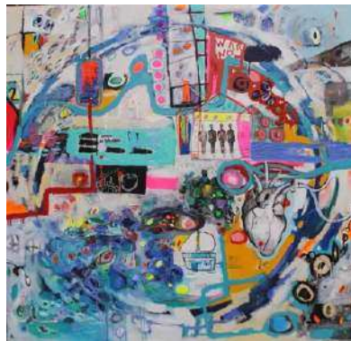
Figura 5. Xavier García, Tierra no car (la deriva) 2018.

La influencia del happening llegó para quedarse, pues ciertas expresiones empezaron a tomar las calles en reacción a problemáticas sociales o políticas. “Suele decirse que lo que callan los medios lo gritan las paredes” (Concepto, 2021) y el graffiti apareció como vía alternativa de expresión en lugares públicos y visibles. Este fenómeno trata de transmitir un mensaje de carácter crítico o simplemente intenta marcar un territorio de manera anónima e ilegal sin perder el sentido de la armonía. El graffiti , como expresión personal, no estaba regulado por instituciones. En las calles de las grandes ciudades apareció esta manifestación de manera colorida y no solamente se valía del aerosol para plasmarse, ya que tenía relación con otras corrientes artísticas del momento. Esta expresión, considerada como una de las grandes revoluciones artísticas, tomó al espacio urbano como lienzo para que cualquiera pudiera crear obras de arte por medio de técnicas informales que, con el tiempo, se profesionalizaron (ver Figura 5). A pesar del reducido tiempo siendo considerado como arte, tiene distintos formatos: los tradicionales, los abstractos, los fotográficos, el morfing 14 y ahora ya en instalaciones.