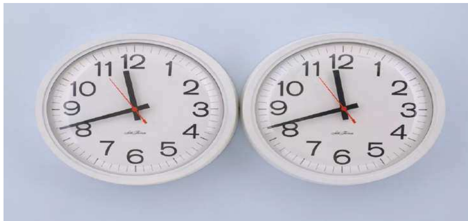
Figura 9. Félix González-Torres, Untitled (Perfect lovers) (1991).

Este tipo de obras ejemplifica la conexión entre un tiempo y un espacio determinado, ya que habla de una problemática en una época específica. En dichos momentos el SIDA se disparó, particularmente en parejas del mismo sexo y se consideraba que estaban siendo castigados por su elección de pareja, así de simple. De igual manera, es una obra que lleva a pensar en el amor en general, que se dice eterno, que no termina a pesar de las distancias, las decisiones tomadas, las circunstancias o el tiempo finito. Aunque la escultura habla del amor en pareja, también se puede pensar en el amor hacia la familia, los amigos, los animales de compañía; estos últimos quizás en aquellos años eran tratados de una manera distinta a la actual en términos de amor y procuración. En fin, si se piensa en la obra de González-Torres en la actualidad, también se relaciona con la comunidad LGBT, que si bien no se encuentra en la misma situación que en décadas pasadas, sigue siendo objeto de discriminación, así como de omisiones.