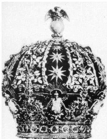
Imagen 3. Corona de la Virgen de Guadalupe, modelo elegido y hecho de oro y piedras preciosas.

Por acuerdo de los arzobispos y obispos mexicanos se acordó que la ceremonia de coronación se realizaría el 12 de octubre de 1895. 312 Se eligió la ceremonia en octubre y no el 12 de diciembre como una manera de expresar regocijo no solo para México, sino para toda América. El arzobispo de México, Alarcón y Sánchez de la Barquera, publicó en el periódico capitalino La Voz de México de los días 20 y 21 de junio, su carta apostólica con motivo de la ceremonia de Coronación, explicó de qué manera se llevó a cabo tal acto, con invitados de Cuba, Estados Unidos, Canadá, y los prelados mexicanos, se calendarizaron los festejos del 1 al 19 octubre. 313 Pero en esta primera publicación no se habló de la actuación de Orfeón de Querétaro. 314