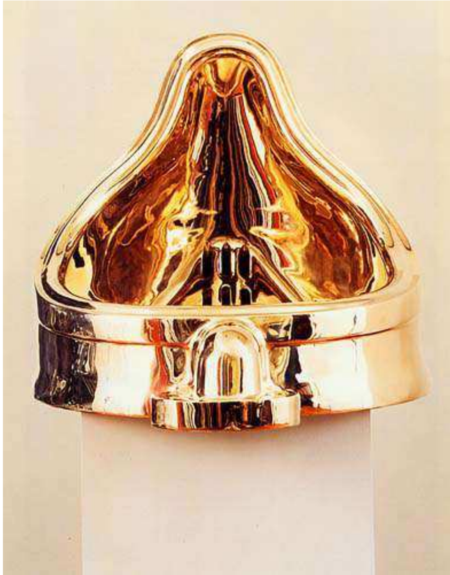
Imagen 4 - "Fountain (After Marcel Duchamp)", Sherrie Levine, 1991.