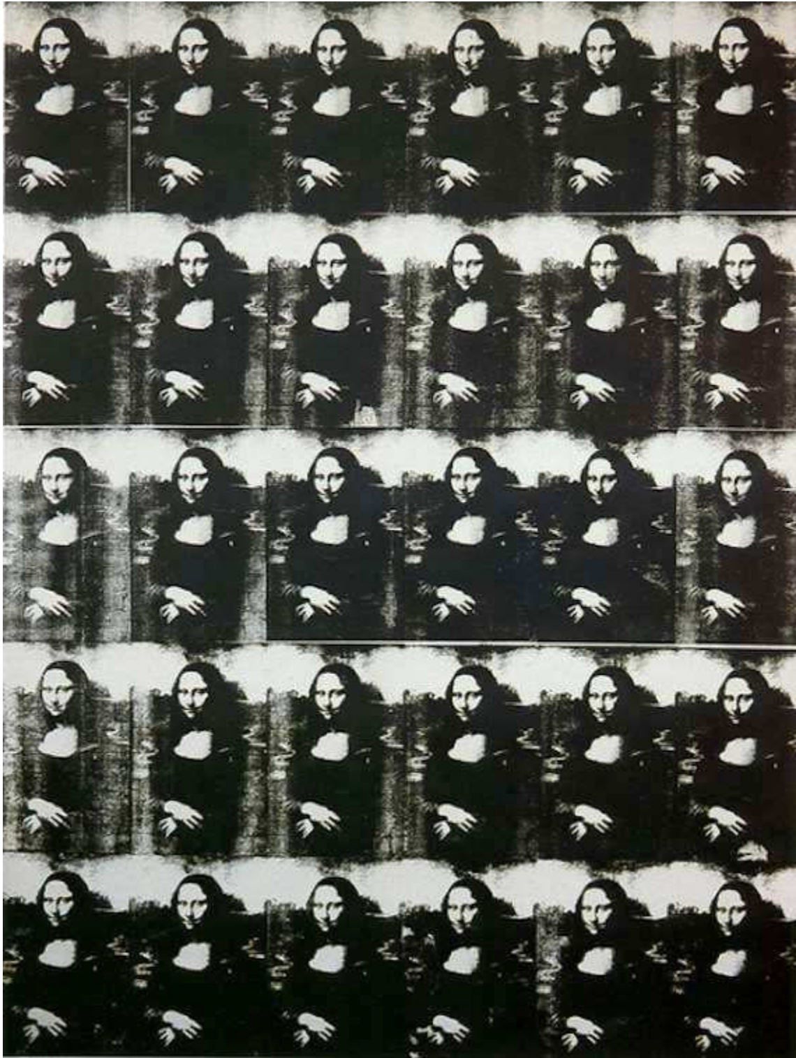
Imagen 1. Thirty are better than one, Andy Warhol, 1963.