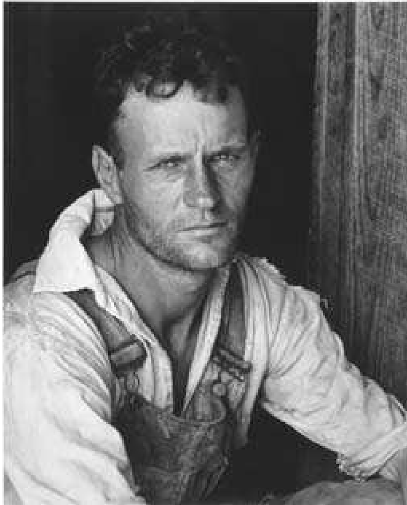
Imagen 3 – After Edward Weston, Sherrie Levine.