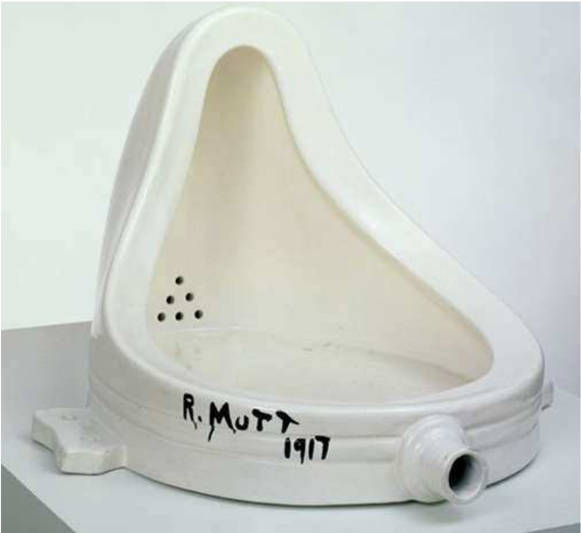
IMAGEN 5 – Fuente, Marcel Duchamp, 1917.