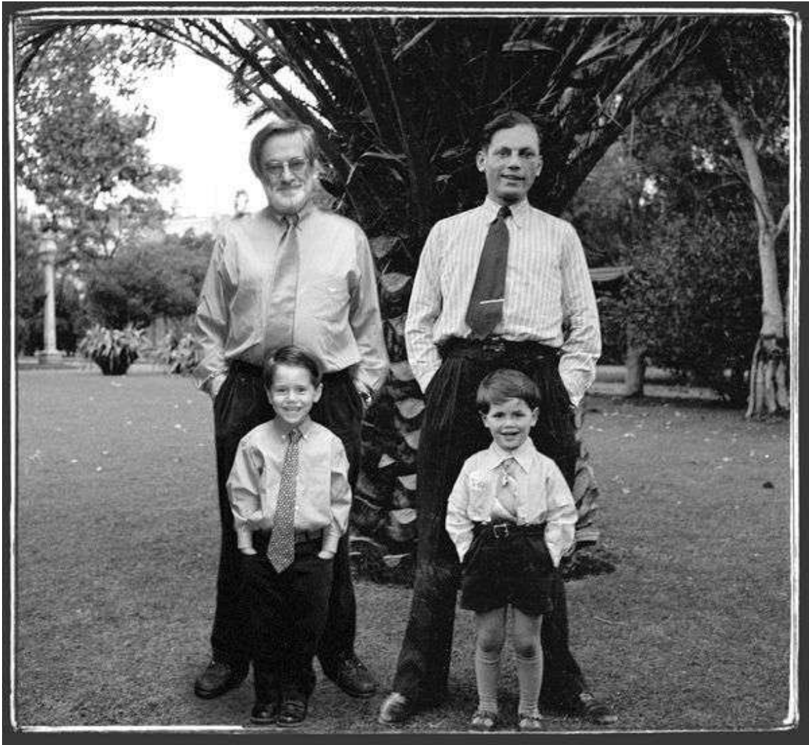
Imagen 6 – Álbum de familia, Pedro Meyer, 2000.