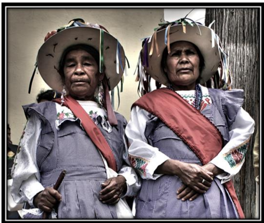
Imagen 17. Mujeres danza de “Las Pastoras” el día del señor Santiago.