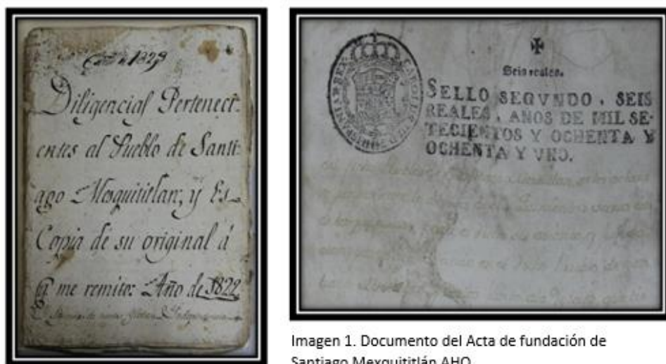
Imagen 1. Documento del Acta de fundación de Santiago Mexquititlán AHQ.

“.....por lo cual todos damos y concedemos licencia y facultad para que dicha parte y lugar funden el dicho pueblo, que se llame y intitule de nombre el Pueblo de Santiago Mestitlán... en el dicho pueblo de Santiago Mestitlán lo que por dichos naturales hab de fundar dentro de dicho año, el dicho pueblo de Santiago dentro de dichas quinientas baras, y demás de edificación, obligándose a la dicha fundación de dicho pueblo, los susodichos Don Diego Indio Casique y gobernador de dicho pueblo y cabecera de dicho pueblo San Miguel Cambay,... fecho en México a diez, y nueve de maio de mil quinientos y setenta y ocho años, por mandado de los señores precidente y oidores Don Juan de Laez escribano de su magestad” (AHQ, judicial, legajo 124 1823 Diligencias pertenecientes al Pueblo de Santiago Mesquititlán fojas 9-11)