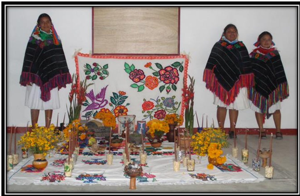
Imagen 15. Alumnas del COBAQ 20 en ofrenda del día de muertos, Santiago Mexquititlán.

“los niños” en el altar familiar se le ponen dulces y juguetes se pueden elaborar muñecas y juguetes de barro se encienden velas de sebo que si lloran es porque el alma del niño viene de vuelta, se nombran así también aquellas mujeres que murieron de parto, se juntan en ocasiones los padrinos de bautizo para cantar y orar por el difunto niño y antes se llevaba una Cruz a la capilla cercana a la casa del difunto o bien si murió de accidente los padrinos de bautizo le colocaban una Cruz en el lugar o le pintaban su cruz en el panteón” (Misael)