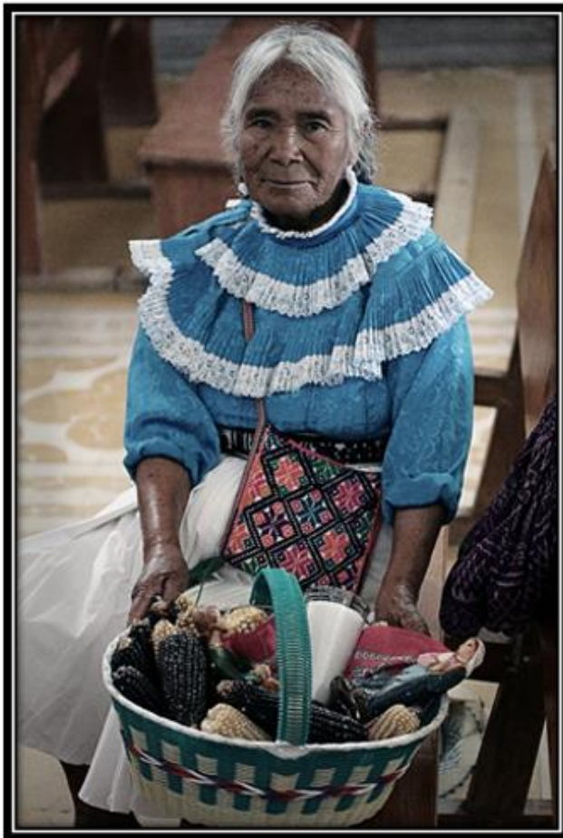
Imagen 8. Bendición de la semilla.

figura de la Virgen María y San José al Templo de Barrio I, o a la capilla ubicada en ese mismo barrio, de esta forma el sacerdote o mayor bendice los granos que se han de sembrar en la milpa en el mes que viene. Los cargueros son la autoridad religiosa principal de la comunidad y se encargan de hacer mole, pan y antes se usaba el zeinthö (así se escribió) (pulque de maíz fermentado con chile de árbol) ahora se llevan cervezas (caguamas) luego del rito a las afueras de la Iglesia, se tiene convite con música interpretada por “los maestros” interpreta melodías con el violín y el tambor (trabajo de alumnos plantel 20 del concurso Itzamná 2007)