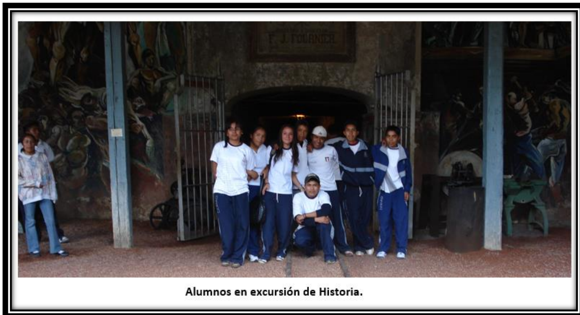
Alumnos en excursión de Historia.

Aun considerando este análisis crítico de la realidad, muchos alumnos ñaño del plantel 20 consideran que la escuela media superior les daría posibilidades de obtener una mejora en la calidad de vida, este discurso es contradictorio y se considera una retórica instituida que deviene del discurso de la mayoría de las instituciones gubernamentales, fomentado por el acompañamiento de acciones paternalistas populistas, como el hecho de proveerles de becas del programa oportunidades y de transporte escolar. Sin embargo algunos jóvenes saben que al concluir sus estudios no tendrán oportunidad de conseguir empleo fuera de lo que sus familiares realizan como una forma de ganarse el sustento: el comercio 27 suponen porque lo viven, que devienen un sin número de barreras que la sociedad mayoritaria así como empresarial les imponen, como por ejemplo los trabajos tres D (di confortantes y desagradables) que argumenta Reguillo de explotación laboral que sufren a nivel global los jóvenes sean ñaño o no. Pero además está su condición de raza que los sitúa en periferia: “por feo o mi color de piel no me contratan” como ya citamos en capítulos anteriores.