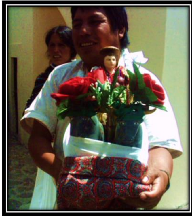
Imagen 9. San Isidro Labrador.

Vemos en estas breves citas porqué es tan relevante el culto a San Isidro pues evidencia la cosmovisión sobre la importancia que la naturaleza tiene para los ñaño y donde nos muestra una posición ética sobre el cuidado ambiental, expresado en la sacralidad que los ñaño otorgan a los objetos de la naturaleza, incluyendo los árboles, la luna, la tierra etc. Este culto a la naturaleza, y a los elementos que de ella emanan son vistos y ejercidos como un fenómeno ritual, el culto al pino Cuecuex al que a su vez se le relaciona con Octontecutli según Carrasco y a la luna asociada a la Madre Vieja y Xochiquetzal, “dios de la curiosidad.-, Dios-jorobado” (Pedro, Carrasco:1979,157) asociado este último al dios del fuego.