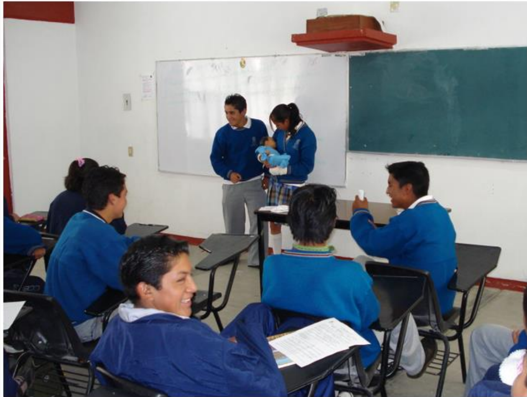
Alumnos COBAQ 20 de Santiago Mexquititlán en JOCAAS