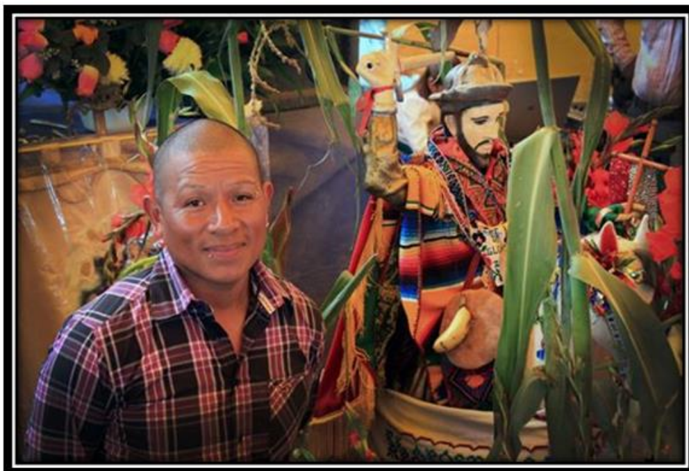
Imagen 14. Joven de Santiago Mexquititlán, "Día del Santo Patrono"