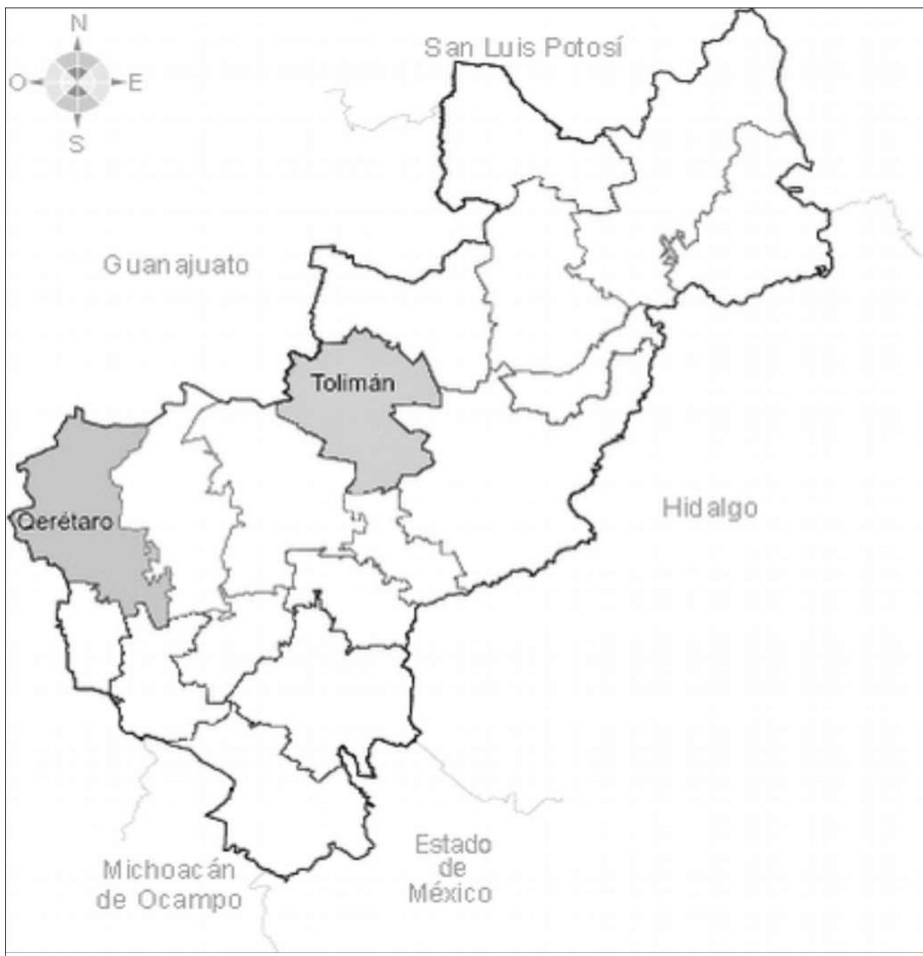
Fig. 1. Mapa del estado de Querétaro, indicando en gris la localización de la capital y el municipio de Toluán.