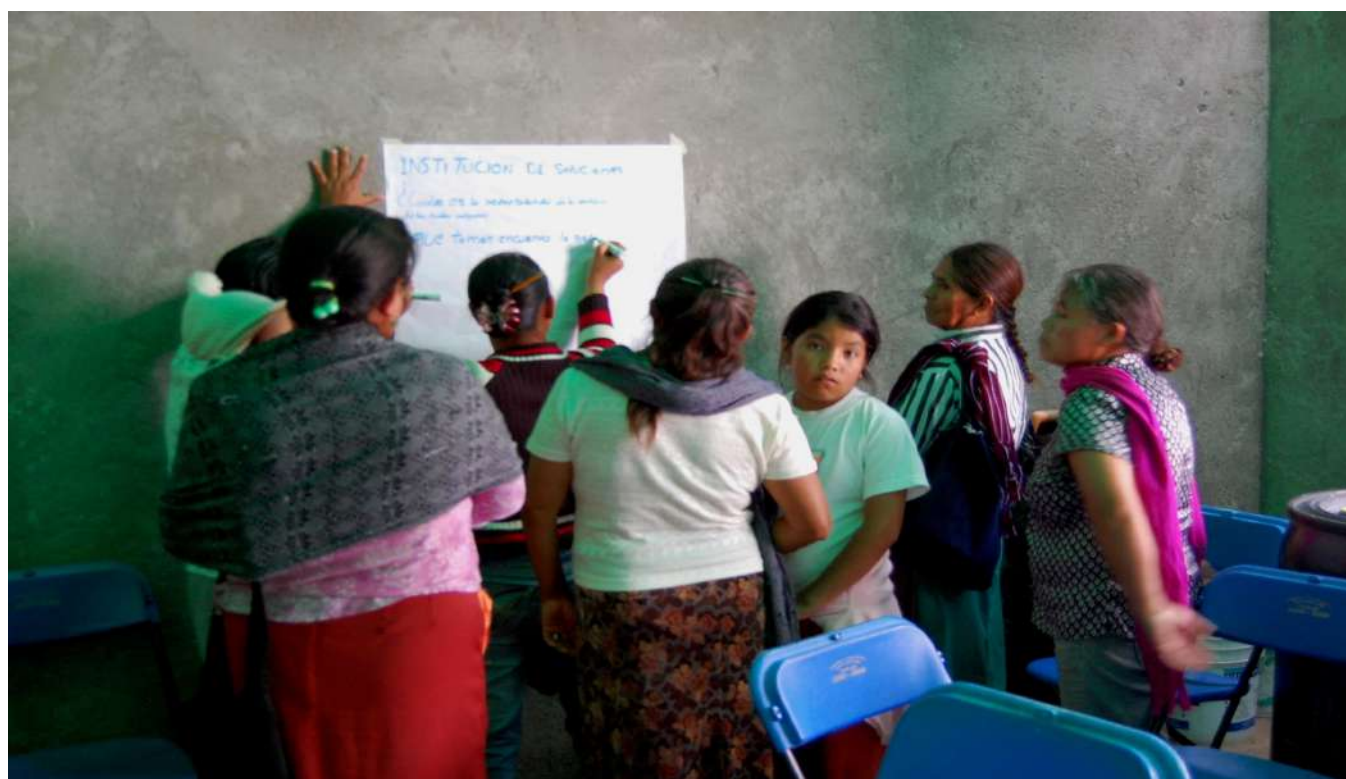
Imagen 10. Reflexión grupal en sesión de taller en Sabino de San Ambrosio 16-11-13.