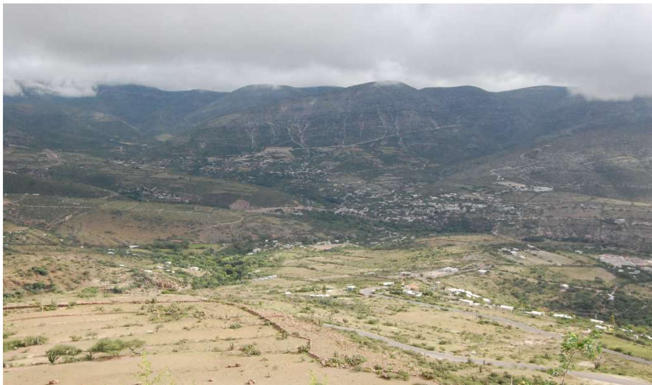
Imagen 1. Panorámica de la Micro-región de Higueras en Tolimán, 28-08-13. Octavio Cabrera Serrano