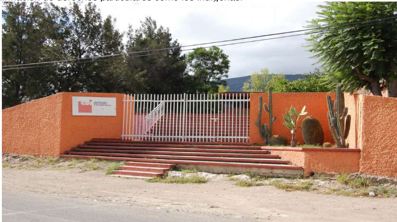
Imagen 8. Fachada de las instalaciones de CDI en San Pedro Tolimán 23-08-13. Octavio Cabrera Serrano.

Por lo tocante a la participación ciudadana, en el taller se muestra que los otomíes del Comité Regional y los delegados y subdelegados poseen un gran conocimiento e interacción fuerte con distintos actores sociales locales, que además muestra la manera en que se vinculan social, política y económicamente con las organizaciones independientes y con las del Estado. Asimismo, se observa como desde su perspectiva del Comité, los otomíes inciden o reclaman la necesidad de tomar decisiones en las esfera pública local, es decir, hay una búsqueda por su inclusión desde la participación ciudadana tomando como estandarte la afirmación de derechos particulares como los indígenas.