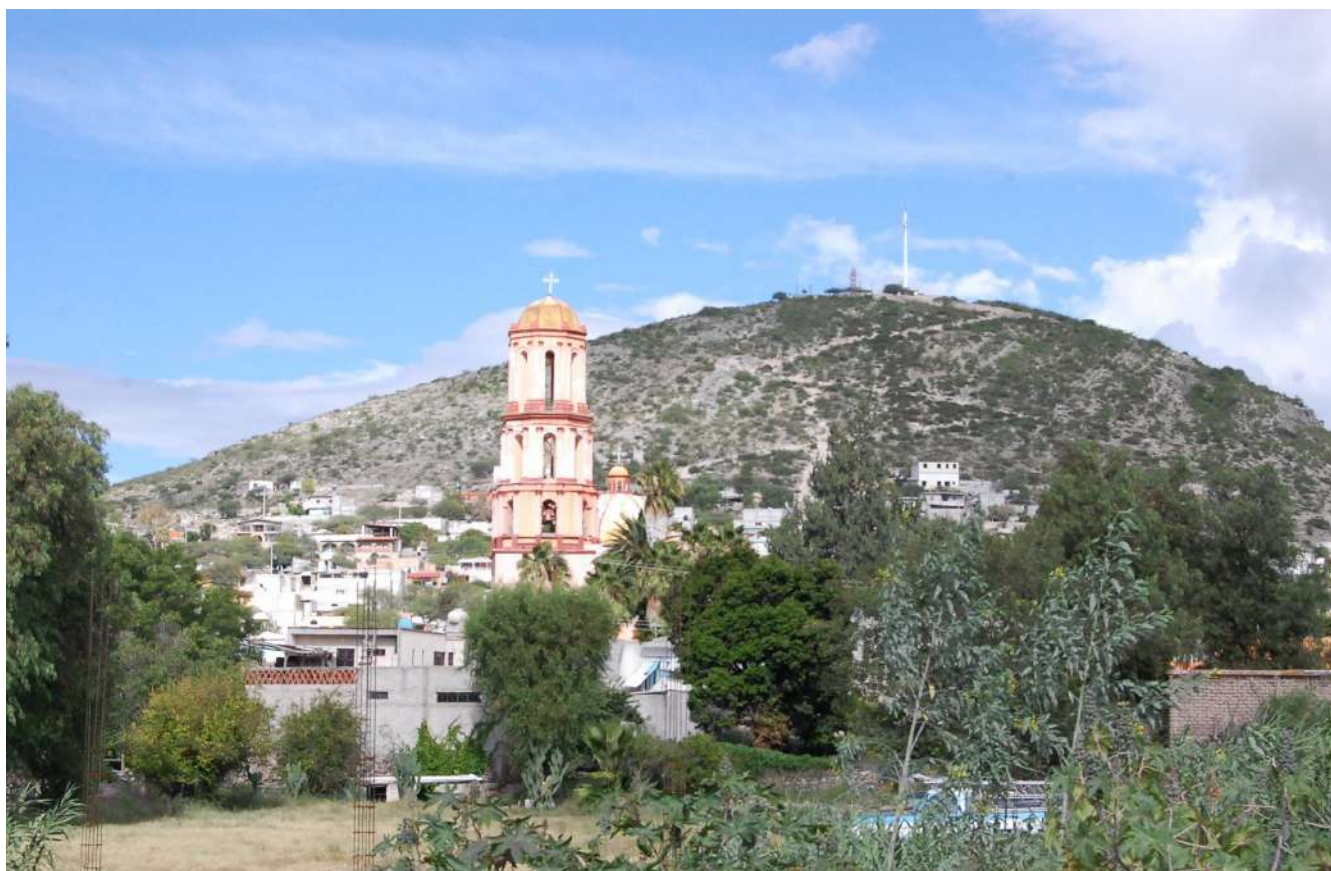
Imagen 3. Vista de la cabecera municipal, San Pedro Tolimán 23-08-13. Octavio Cabrera Serrano.