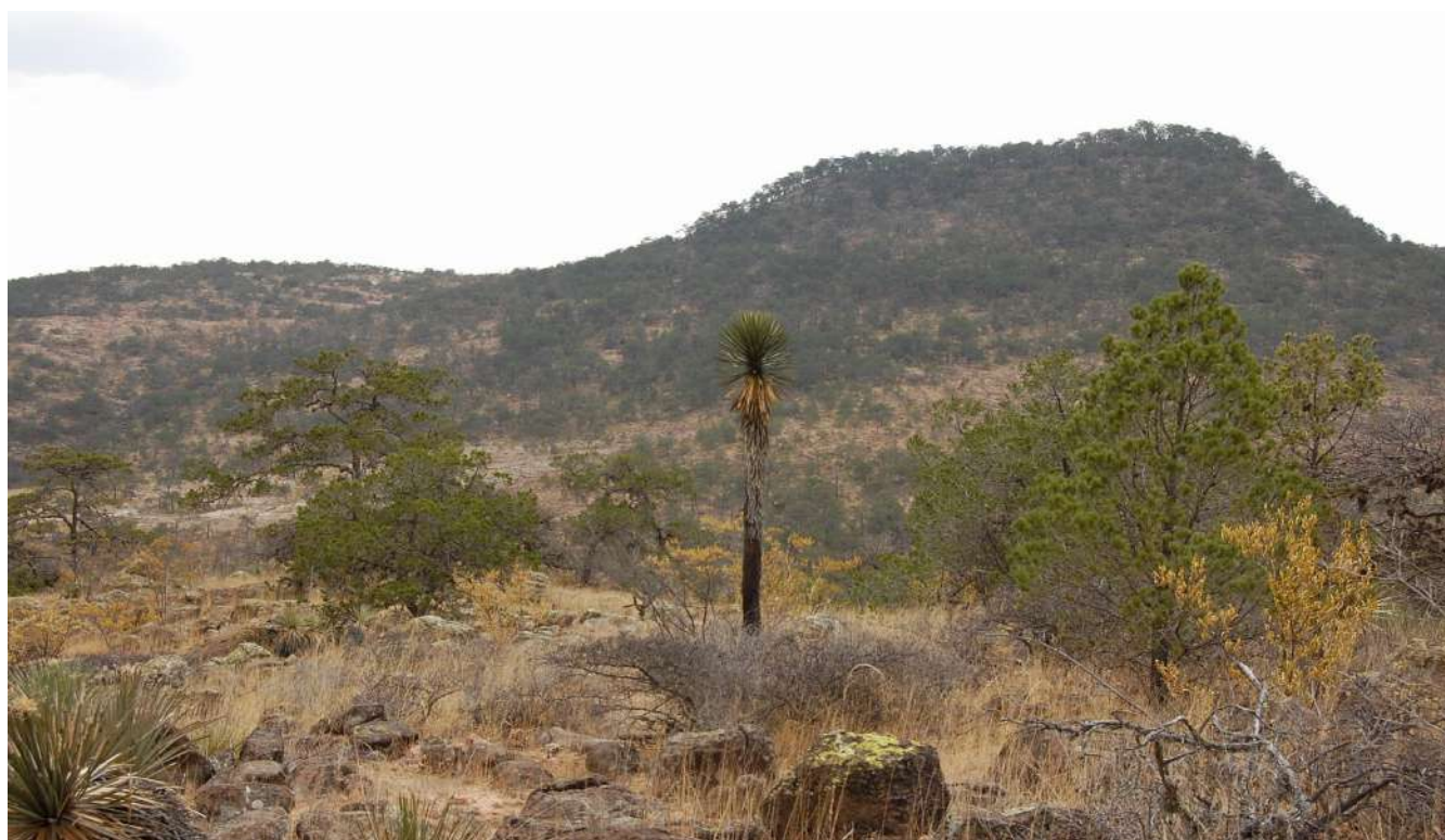
Imagen 2. Paisaje del semidesierto en Tolimán 30-08-13. Octavio Cabrera Serrano