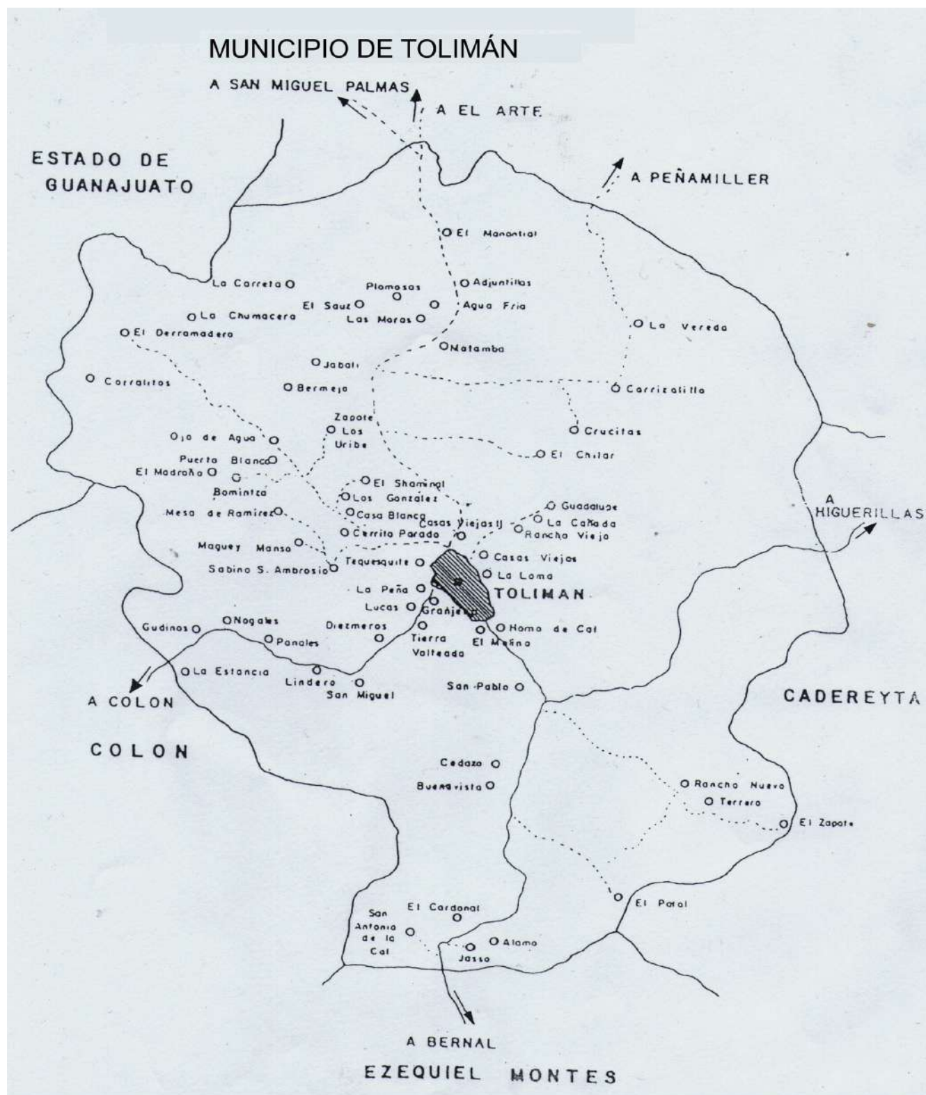
Fig. 2. Mapa del municipio de Toluán donde se muestran las localidades que lo componen.