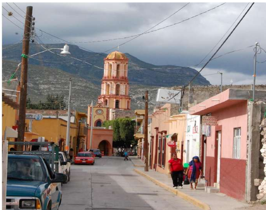
Imagen 4. Aspecto de una calle de San Pedro Tolimán 23-08-13. Octavio Cabrera Serrano.