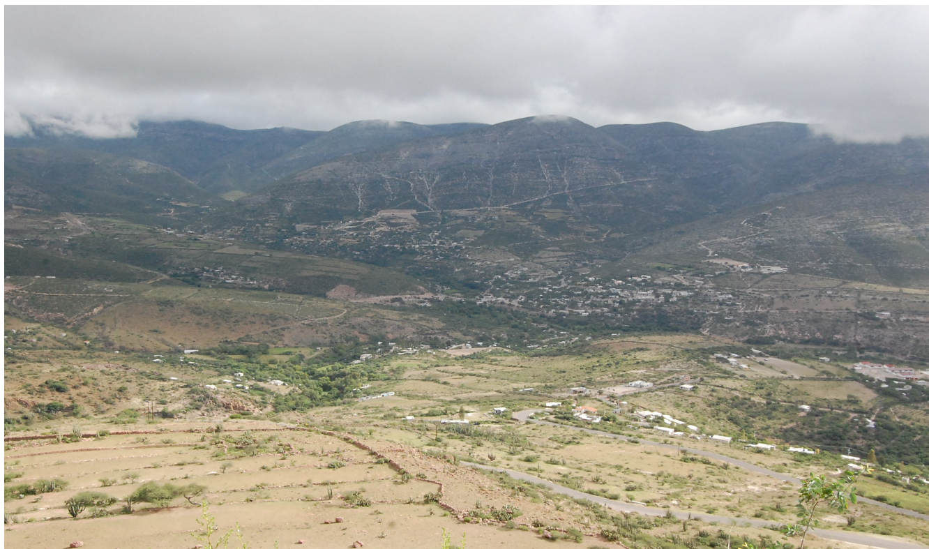
Imagen 1. Panorámica de la Micro-región de Higueras en Tolimán, 28-08-13. Octavio Cabrera Serrano