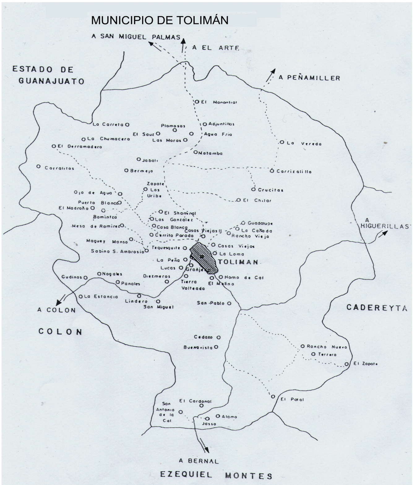
Fig. 2. Mapa del municipio de Tolimán donde se muestran las localidades que lo componen.