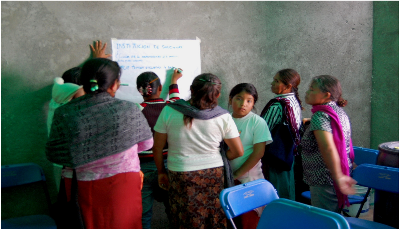
Imagen 10. Reflexión grupal en sesión de taller en Sabino de San Ambrosio 16-11-13.