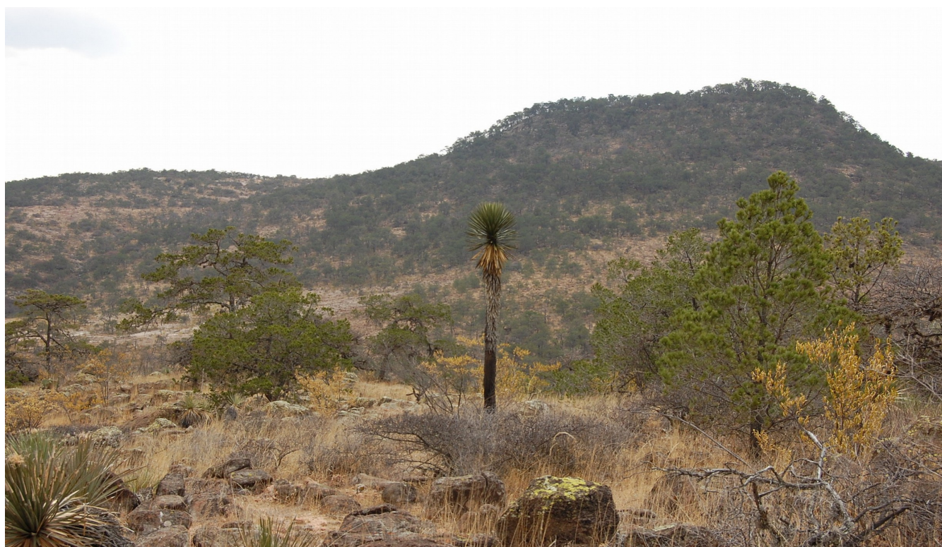
Imagen 2. Paisaje del semidesierto en Tolimán 30-08-13. Octavio Cabrera Serrano