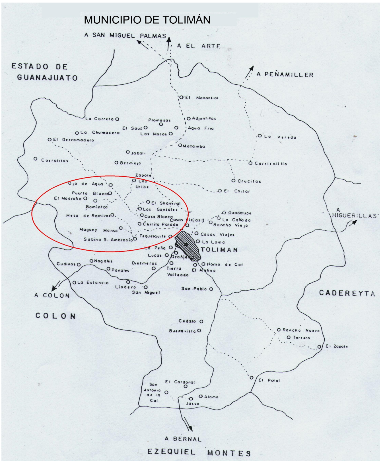
Fig.3. Mapa de Toluimán, donde se muestran encerradas en un círculo las comunidades de la micro-región de Higuera, en Toluimán.