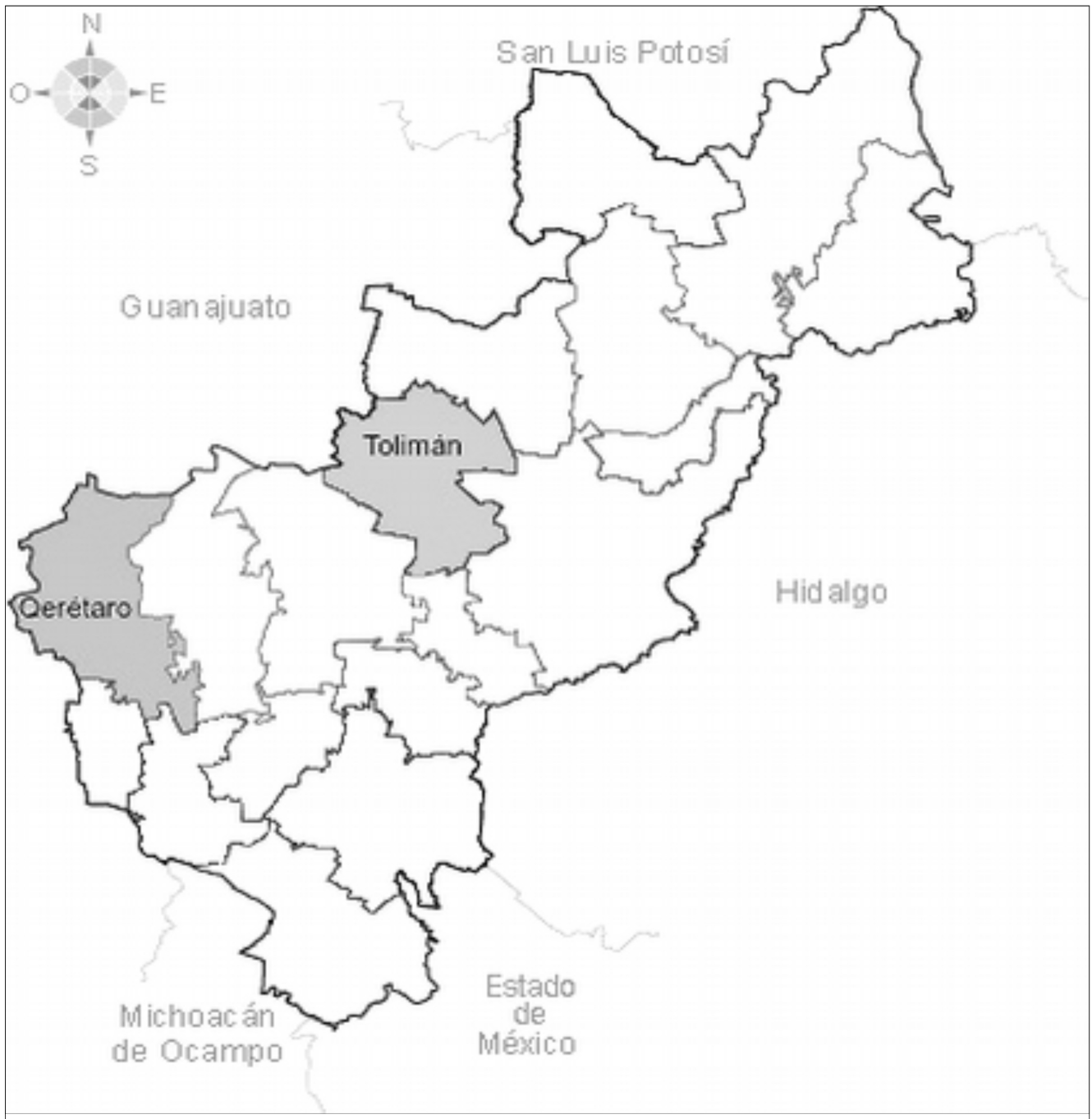
Fig. 1. Mapa del estado de Querétaro, indicando en gris la localización de la capital y el municipio de Toluán.