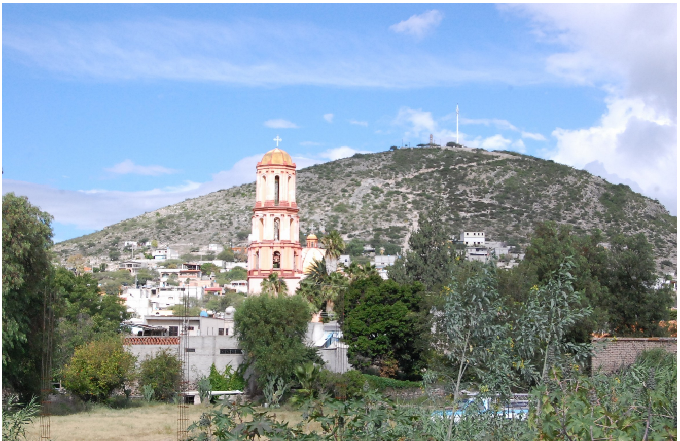
Imagen 3. Vista de la cabecera municipal, San Pedro Tolimán 23-08-13. Octavio Cabrera Serrano.