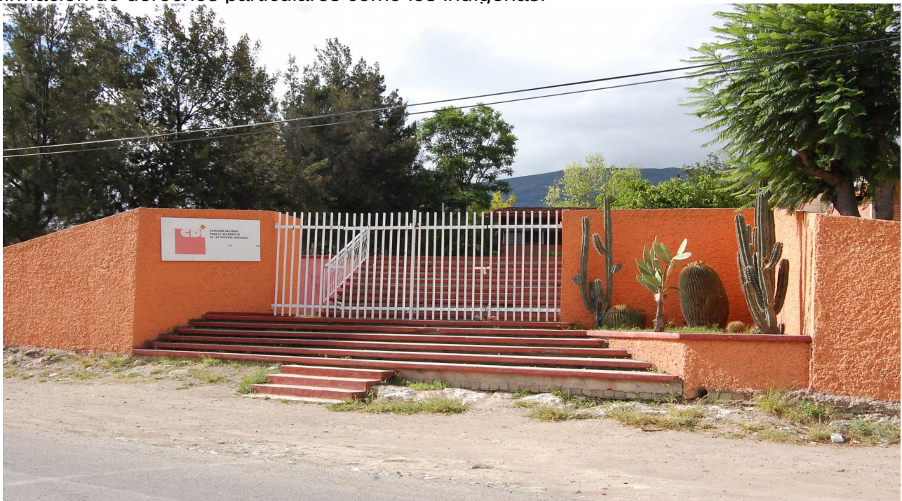
Imagen 8. Fachada de las instalaciones de CDI en San Pedro Tolimán 23-08-13. Octavio Cabrera Serrano.

Por lo tocante a la participación ciudadana, en el taller se muestra que los otomíes del Comité Regional y los delegados y subdelegados poseen un gran conocimiento e interacción fuerte con distintos actores sociales locales, que además muestra la manera en que se vinculan social, política y económicamente con las organizaciones independientes y con las del Estado. Asimismo, se observa como desde su perspectiva del Comité, los otomíes inciden o reclaman la necesidad de tomar decisiones en las esfera pública local, es decir, hay una búsqueda por su inclusión desde la participación ciudadana tomando como estandarte la afirmación de derechos particulares como los indígenas.