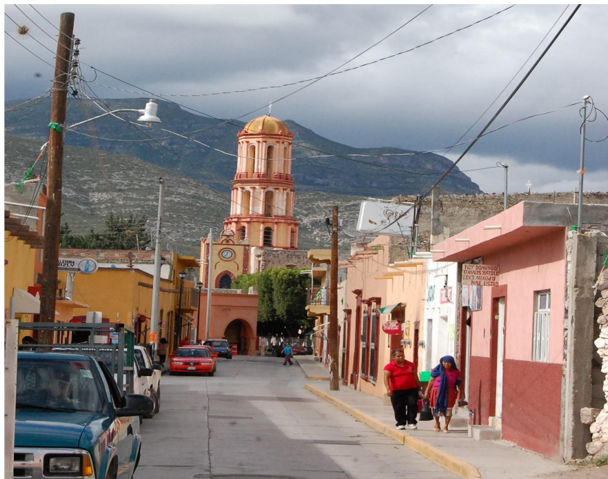
Imagen 4. Aspecto de una calle de San Pedro Tolimán 23-08-13. Octavio Cabrera Serrano.