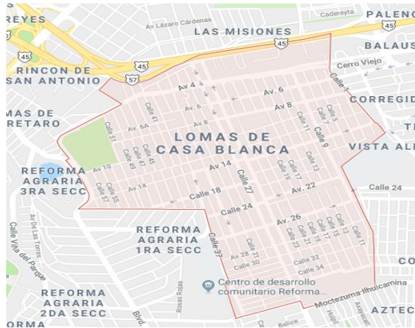
Figura 1. Elaboración propia desde el portal de Google Maps.

La escuela primaria en la que se realizó el diagnóstico es pública, con turno matutino en el cual en el ciclo escolar 2018-2019 se encuentran inscritos 440 niños y niñas, divididos en 12 grupos, en cuanto a los grupos específicos con los que se trabajó, uno cuenta con 38 alumnos y otro con 37.