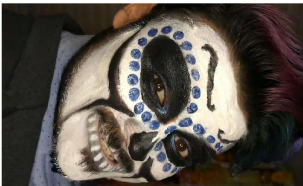
Figura 8. Las desventuras de Severo Mazapanni. (Fotograma, video de autoría propia, 2020).

hegemónica y sus prácticas han sido equiparadas con el mazapán, un dulce tradicional que se elabora prensando harina de cacahuete y otros ingredientes hasta formar una masa compacta, de manera que el dulce es aparentemente duro pero en realidad es tremendamente frágil. Esta analogía fue el punto de partida para dar nombre a este personaje y mostrar, a través suyo, algunos de los privilegios que la masculinidad hegemónica tiene por encima de algunas interseccionalidades (mujeres, personas no heterosexuales, identidades de género disímiles a las binarias, niñxs). Desde la queja de Severo Mazapanni en torno a que la masculinidad ha muerto porque las feministas la asesinaron, se evidencian los mencionados privilegios. El teatro cabaret fue el vehículo ideal para llevar a cabo la crítica mencionada desde un lenguaje cercano e irónico. Los personajes del teatro cabaret suelen ser exagerados, son hipérboles de vicios o virtudes. Esta caricaturización de las prácticas de masculinidad hegemónica me permitió exponer las problemáticas mencionadas a través de la identificación, es decir, nadie se ríe de algo que no entiende, que no identifica, que no conoce. A continuación presento un fotograma de la cápsula referida: