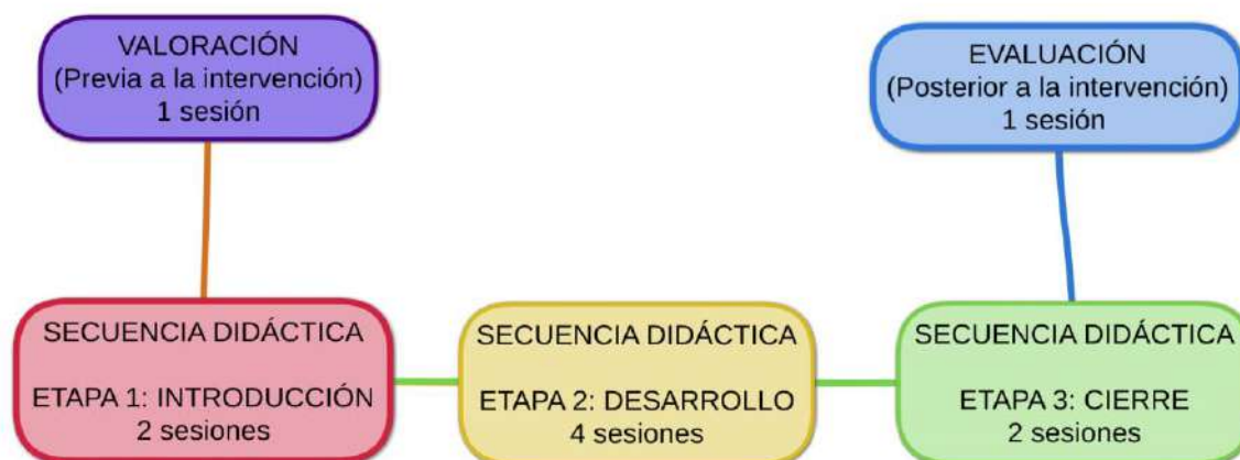
Figura 2. Estructura del proyecto de intervención. Autoría propia (2021).

Como se observa en el diagrama, esta intervención está diseñada en dos etapas: la valoración- evaluación y la secuencia didáctica que, a su vez, está compuesta de tres fases (introducción, desarrollo y cierre). Más adelante se ahondará en cada una de las etapas y fases que componen el diseño del proyecto de intervención.