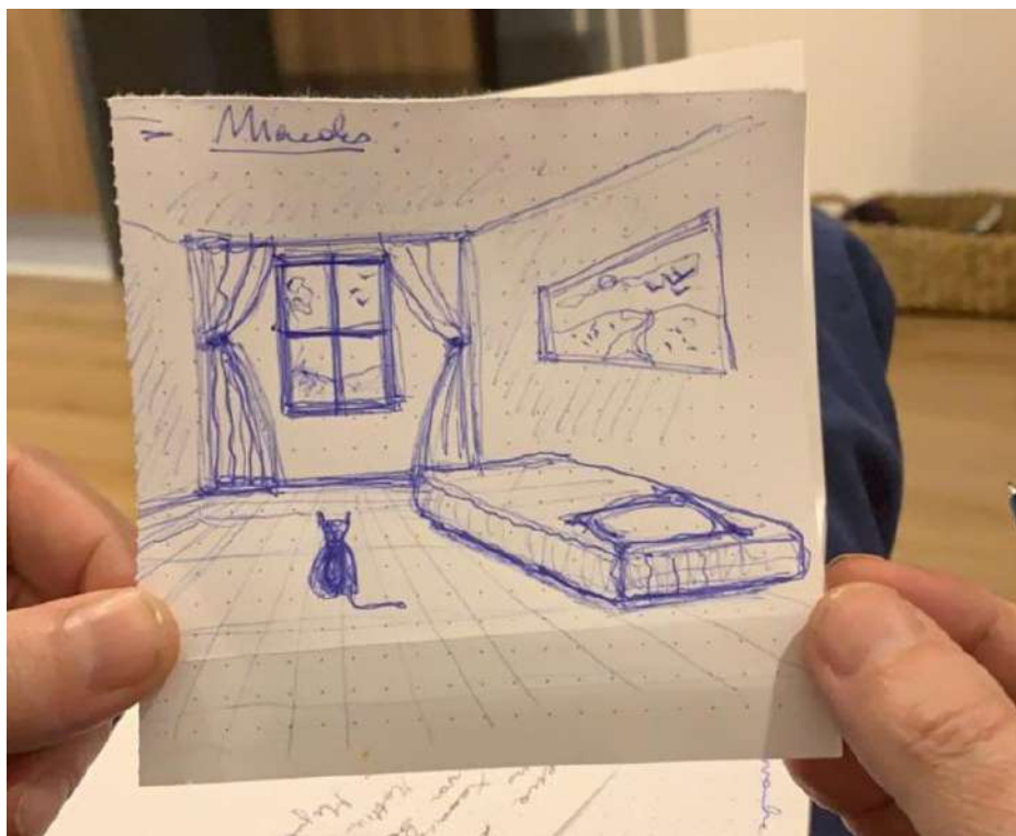
Figura 6. Mirando. (Hombre que asistió a la función virtual, noviembre, 2020).

poder llegar a ella. Todas las personas mencionaron haber podido conectarse emocionalmente con el video, así como haber registrado las emociones a través de las sensaciones corporales.