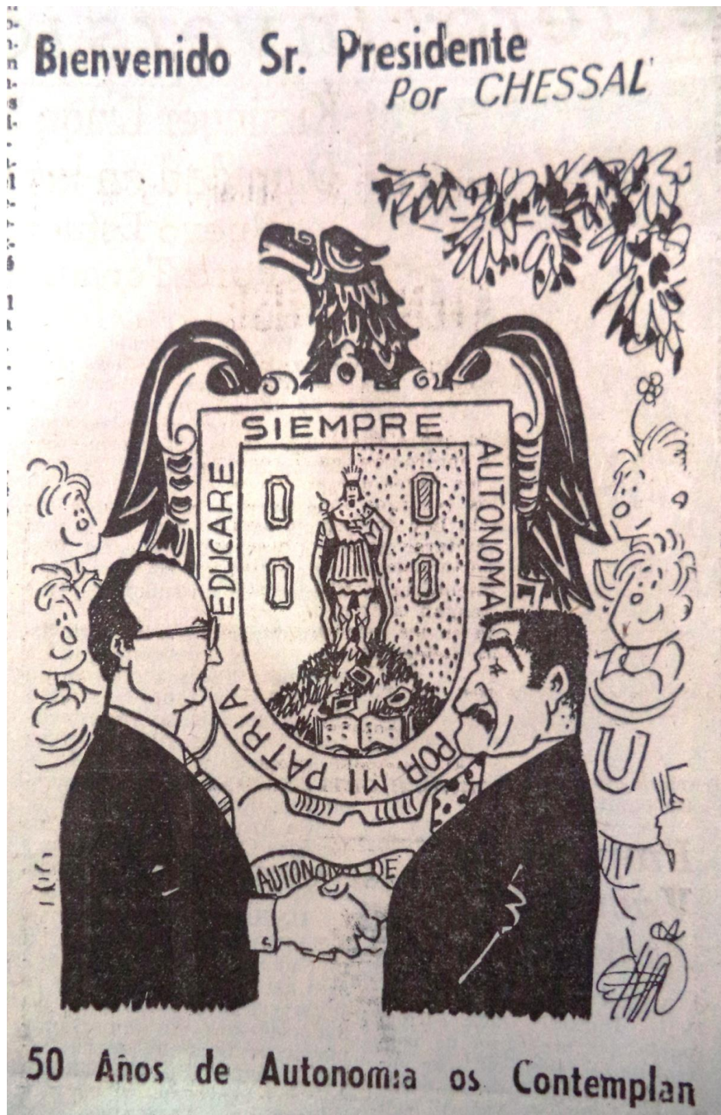
El Sol de San Luis, 8 de enero de 1973.