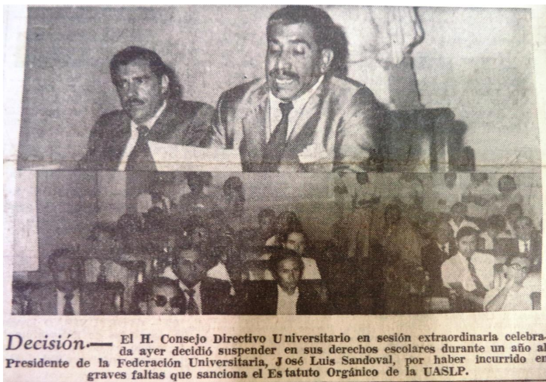
El Sol de San Luis, 2 de agosto de 1973.