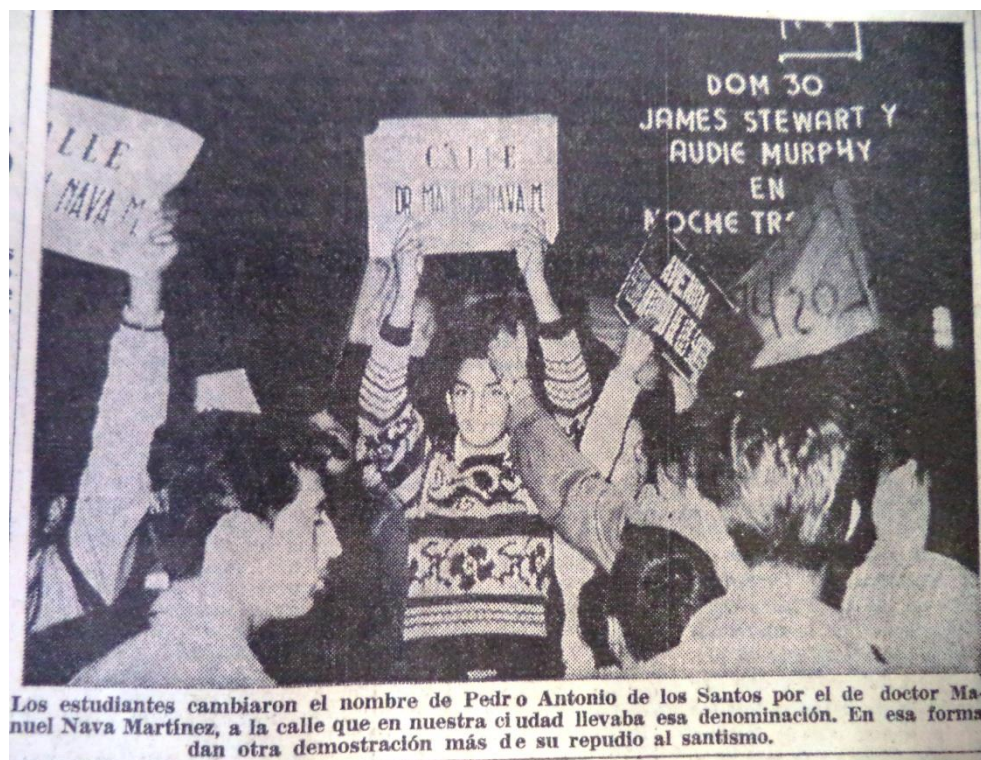
El Herald, 25 de noviembre de 1958