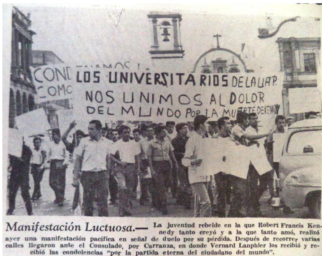
El Sol de San Luis, 13 de agosto de 1961