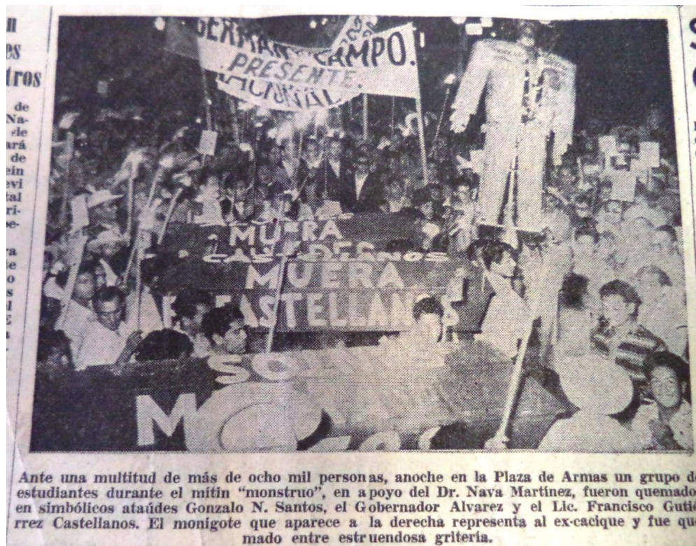
El Herald, 16 de noviembre de 1958