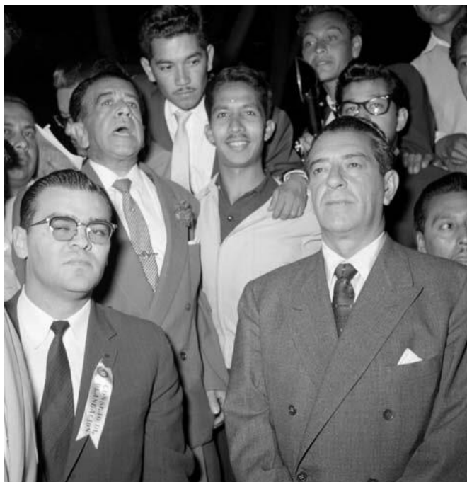
López Mateos en la UASLP. Febrero de 1958.