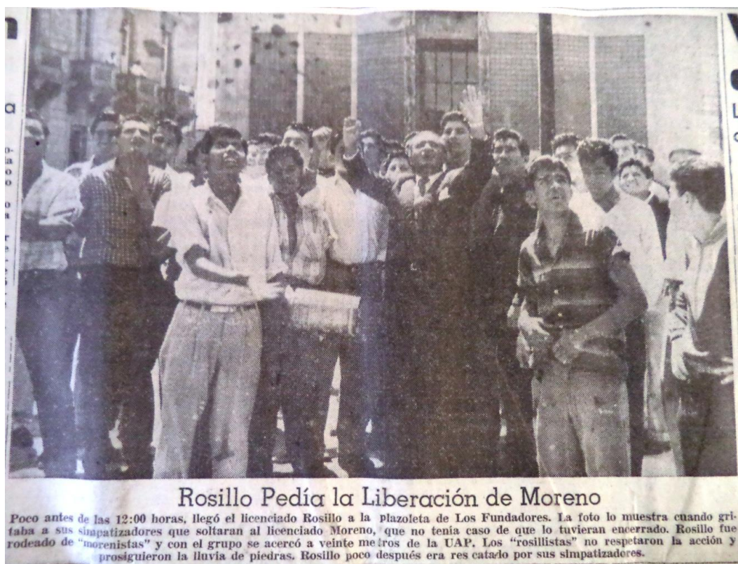
El Heraldo, 19 de septiembre de 1958.