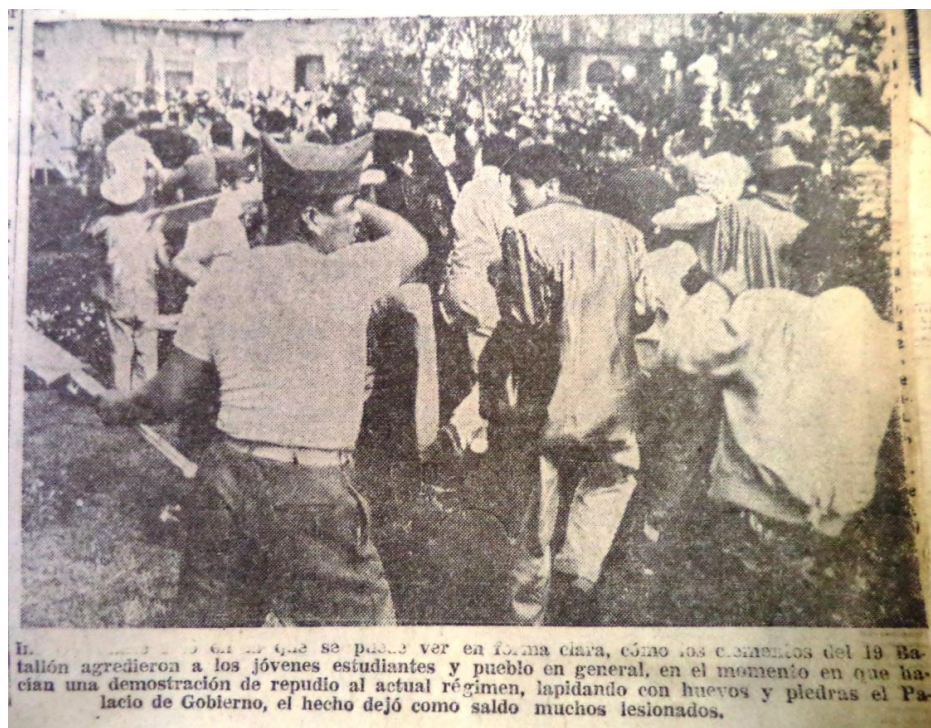
El Herald, 21 de noviembre de 1958