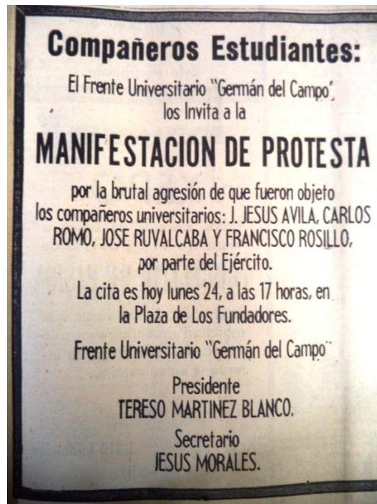
El Herald, 24 de noviembre de 1958