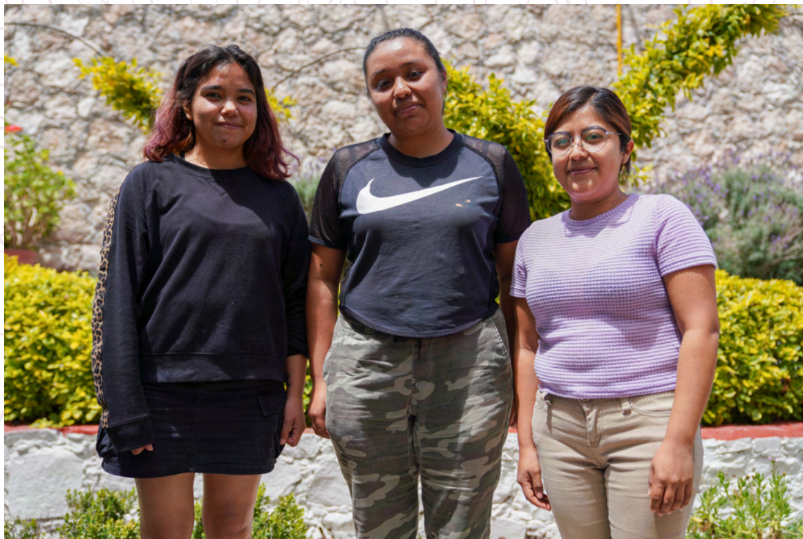
CUIDADORAS DE UNA CASA HOGAR

Lugar: Querétaro, México Fecha: Julio, 2022