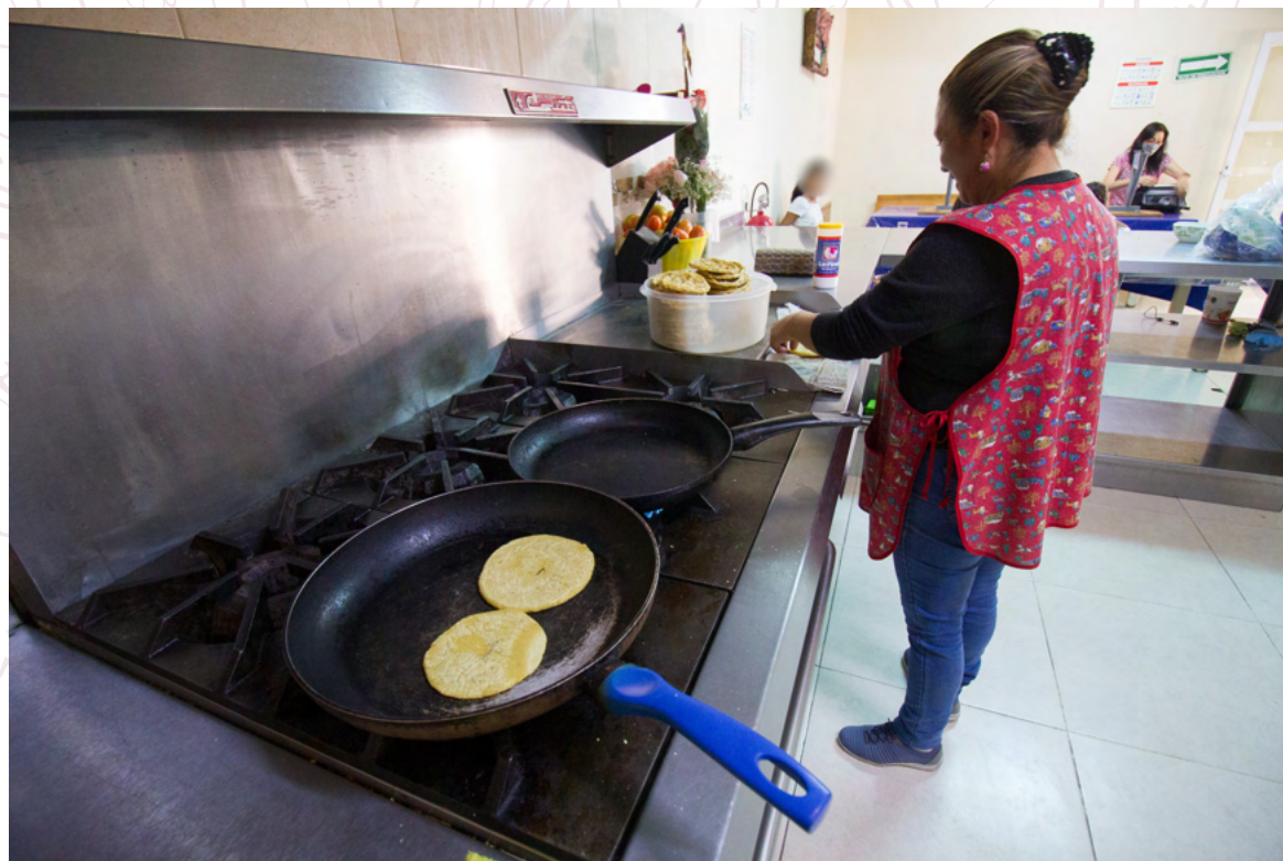
PREPARACIÓN DE GORDITAS EN CASA HOGAR

Lugar: Querétaro, México Fecha: Julio, 2022