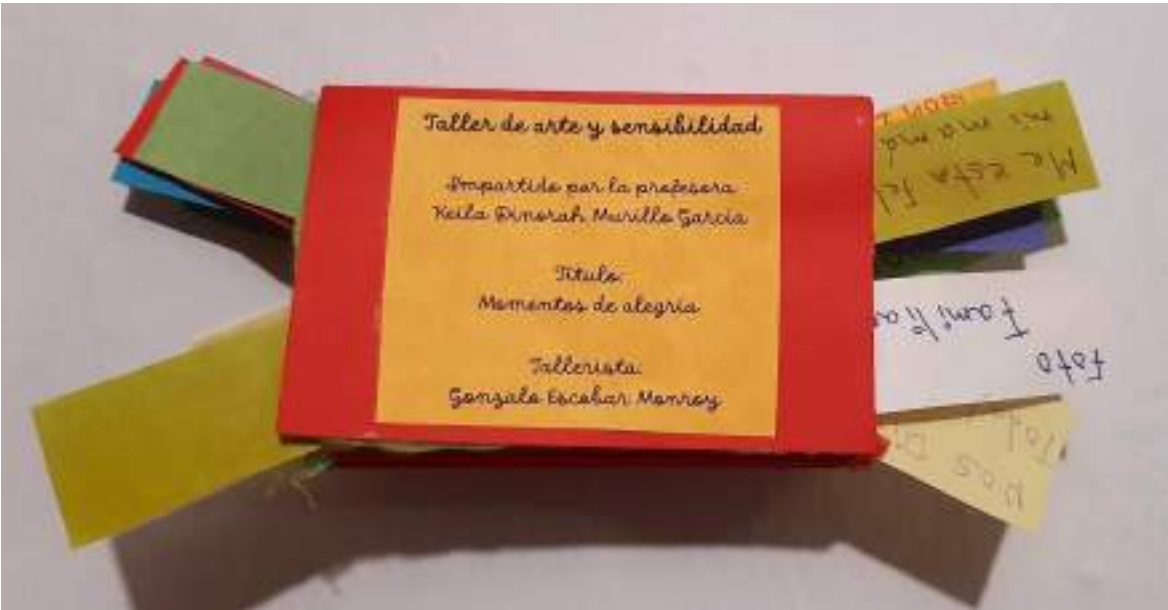
Libro objeto Gonzalo