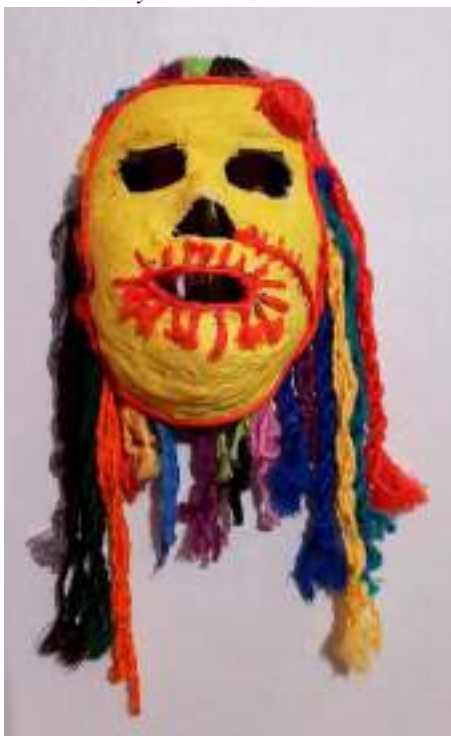
Máscara de yeso: Gonzalo