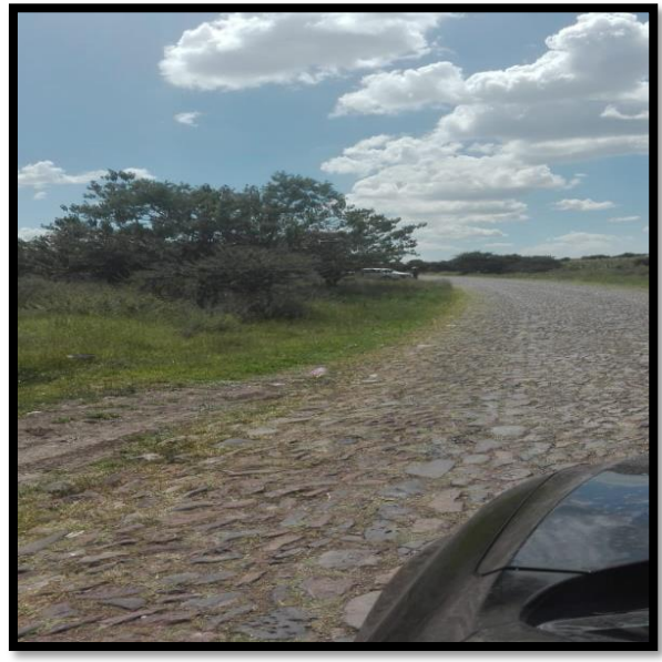
Imagen 2. Falta de banquetas