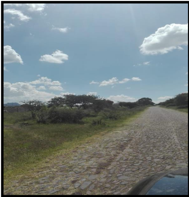
Imagen 3. Muy poco tránsito de personas