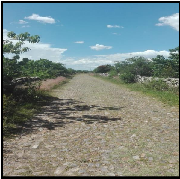
Imagen 1. Falta de iluminación