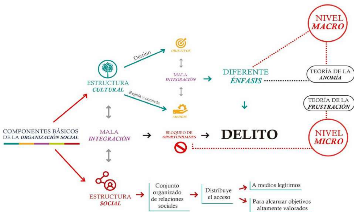
Figura 1. Esquema de los niveles de análisis de la teoría de la anomia de Merton.

Siguiendo en este orden de ideas, analizaremos la teoría de la anomia propuesta por Merton, la cual “se divide realmente en dos modelos, que se corresponden con diferentes niveles de análisis ; nivel macro o colectivo, y nivel micro o individual (Cohen, D, 1995; Cullen, 1984; Kaufman, 2017; Menard, 1995). El primero se relacionaría con la teoría de la anomia (LaFree, 1998; Menard, 1995; Messner, 1988; Messner y Rosenfeld, 2012), mientras que el micro lo haría con la teoría de la frustración (Agnew, 1985; Cloward y Ohlin, 1960; Cohen, 1955).”. (Teijón, Anomia, frustración y delito: una propuesta de medición para la variable principal de las teorías clásicas, 2018)