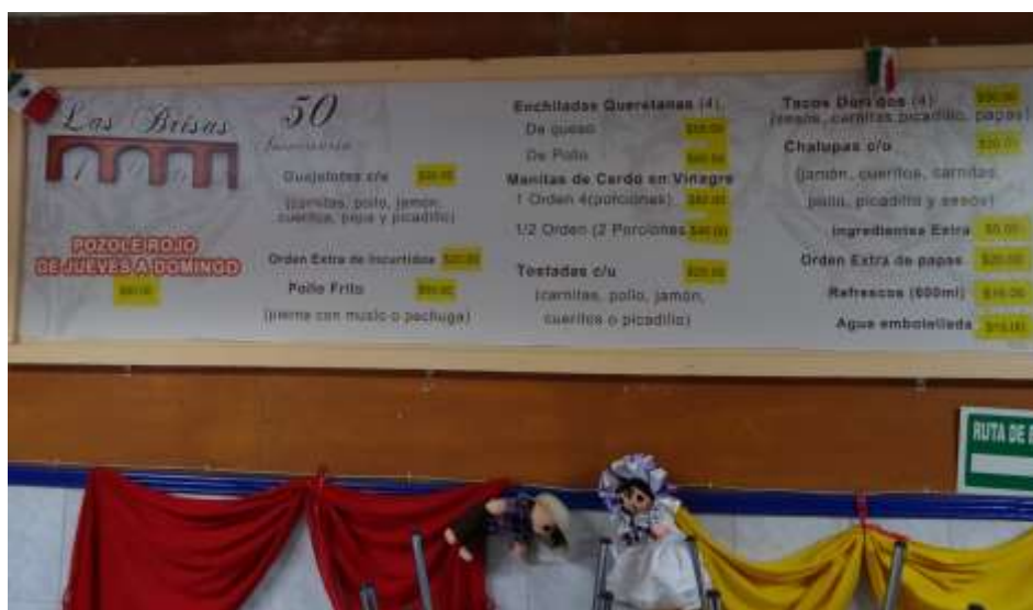
Imagen 7. El menú en Las Brisas, marco colocado en la planta alta.