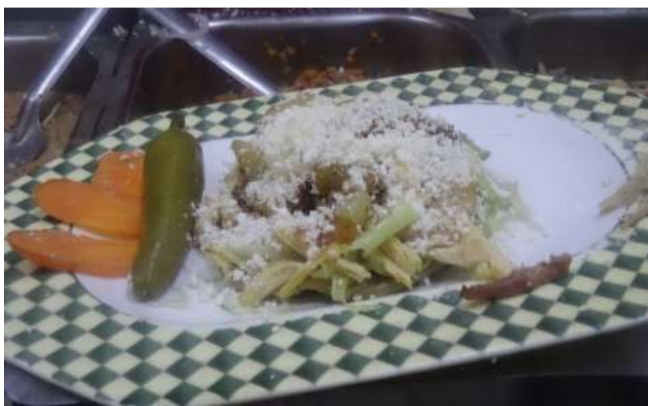
Imagen 8. Antes de llegar al cliente, una chalupa de pollo en la zona de preparación, agregándole los acompañamientos.