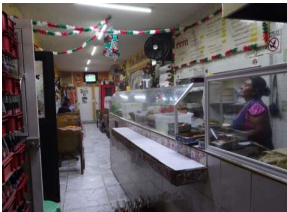
Imagen 4. Vista de la entrada sobre la calle de Hidalgo, se puede observar y comparar con la imagen 3, el detalle del azulejo de la pared debajo de la lista de precios, así como la contra barra intacta.