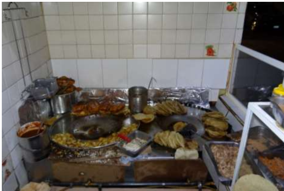
Imagen 6. Dos comales. A la izquierda se puede observar el comal para las enchiladas y guajolotes, a un lado la salsa para sumergir tanto tortillas como pan y las papas fritas escurriéndose en la orilla. Del lado derecho el comal para los tacos dorados y a un lado los recipientes con los sesos y el picadillo.