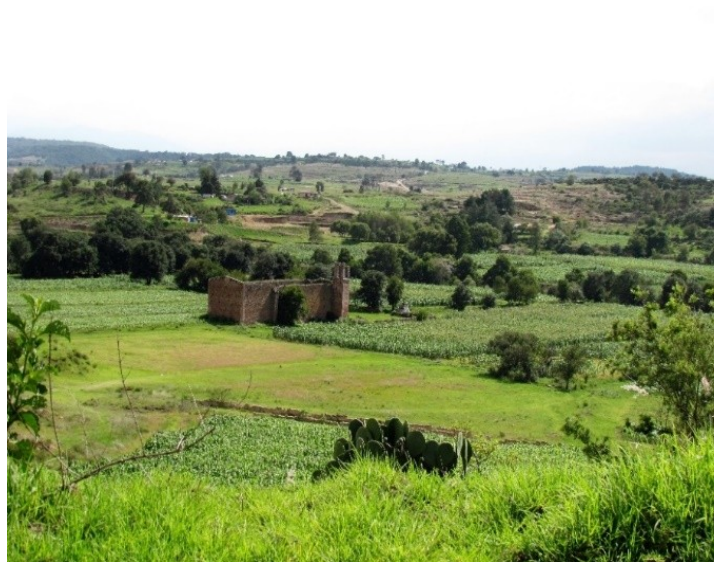
Figura 1. La antigua capilla.

San Ildefonso centro cuenta con dos capillas principales: la antigua, ubicada rumbo a Tenasdá y la nueva, en el centro de la localidad. De acuerdo con el mito de fundación, el águila primero se posó en la antigua capilla y como no podía extender las alas con libertad voló a un nuevo lugar donde edificaron la nueva iglesia (Figura 1).