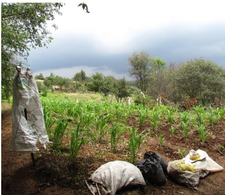
Figura 7. Maíz de temporal.

acompañan el espacio. Las plantas con propiedades medicinales que albergan las casas siempre están cerca del espacio con agua, por ejemplo, donde se lava la ropa.