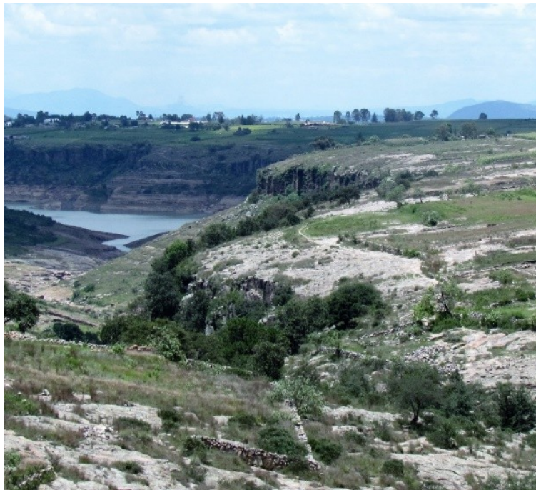
Figura 11. San Ildefonso El Rincón, 2017.

época más fría del año y durante la época más caliente 35 se sufra tos y calentura. La época más caliente es conocida como la canícula, durante ella las propiedades y efectos curativos de las plantas desaparecen, los animales son ponzoñosos y los efectos de sus picaduras son más severos y las plantas pierden sus efectos. Al terminar esta época adquieren nuevamente sus propiedades curativas. Para estos fines habrá que esperar la primera lluvia que limpiará todo y ahora sí volver a recolectar.