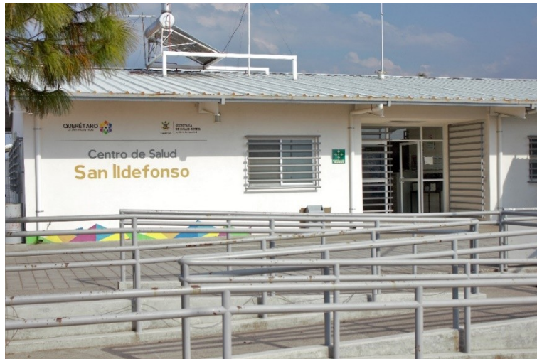
Figura 6. Centro de Salud.

Los médicos encargados del Centro de Salud son cuatro: dos son practicantes y dos médicos asignado por la SSA. Las enfermedades que se atienden con mayor frecuencia son las crónicas-degenerativas, infecciones en vías respiratorias, hipertensión, sobrepeso, infecciones estomacales, control de embarazos y heridas expuestas (Comunicación personal, 28 de febrero de 2018). Los habitantes a los que se brinda atención pertenecen a las comunidades de El Rincón, Cuisillo, Tesquedó, Yospí, San Ildefonso, San Pablo, El Bothé y Mesillas.