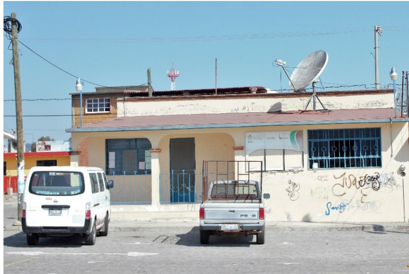
Figura 5. Centro de capacitación, monitoreo y prevención.

Rincón, se les da prioridad por considerarse las más alejadas de la zona centro. Además de las charlas, se realizan revisiones mensuales de rutina para todos los integrantes de la familia afiliados al programa; dicho monitoreo determina el nivel nutricional de las familias. Las campañas generales de vacunación de febrero, mayo y octubre se realizan en este espacio (Figura 5).