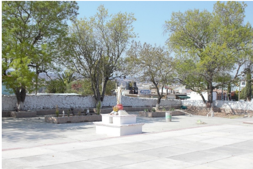
Figura 3. Atrio de la iglesia nueva.

Durante el ritual los y las cargueras se colocan en dos filas delante de la cruz que está en el centro del cementerio; la ceremonia se acompaña del sumerio y el copal, que humea hacia los cuatro puntos: las dos filas de cargueros se colocan frente a frente, quienes entregan pronuncian palabras en idioma hñähñu; posteriormente se extiende una felicitación y se procede a compartir la comida; antes de repartir los alimentos se coloca un mantel sobre el piso, “se pone la mesa” y entonces pasan los nuevos cargueros a repartir la comida, mientras toca un grupo musical en vivo.