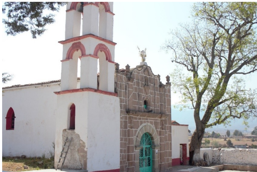
Figura 2. Iglesia nueva de San Ildefonso Tultepec.

La fiesta del santo patrono San Ildefonso Tultepec se realiza del 22 al 24 de enero. Los bautizos, las confirmaciones y las primeras comuniones colectivas son parte de los festejos religiosos. Las familias de quienes reciben el sacramento preparan como plato central mole, guajolote y tortillas de maíz. Entre las principales bebidas están el pulque y la cerveza. Además de festejar a San Ildefonso llegan otros santos del Estado de México para ser celebrados.