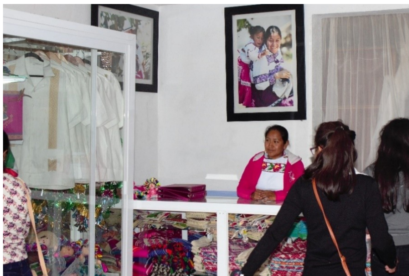
Figura 4. Taller de muñecas.

productos de patente. Adjunto a dicha farmacia hay un taller de artesanías, visitado por escuelas de distintos municipios de Querétaro para observar el proceso de elaboración de muñecas hñähñu y venta de bordados en blusas, carteras, cojines y caminos de mesa (Figura 4).