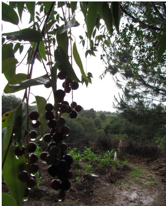
Figura 10. Planta medicina, 2017.

recolección de la planta, además de la guía de una divinidad para sanar.