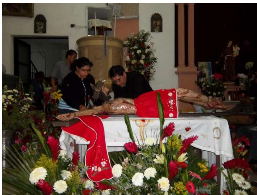
Figura 3.1 Velación de la imagen de El Señor de Las Maravillas.