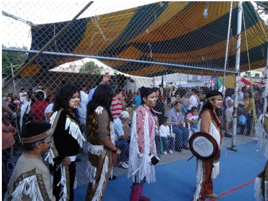
Danza en la cancha de usos múltiples durante la festividad