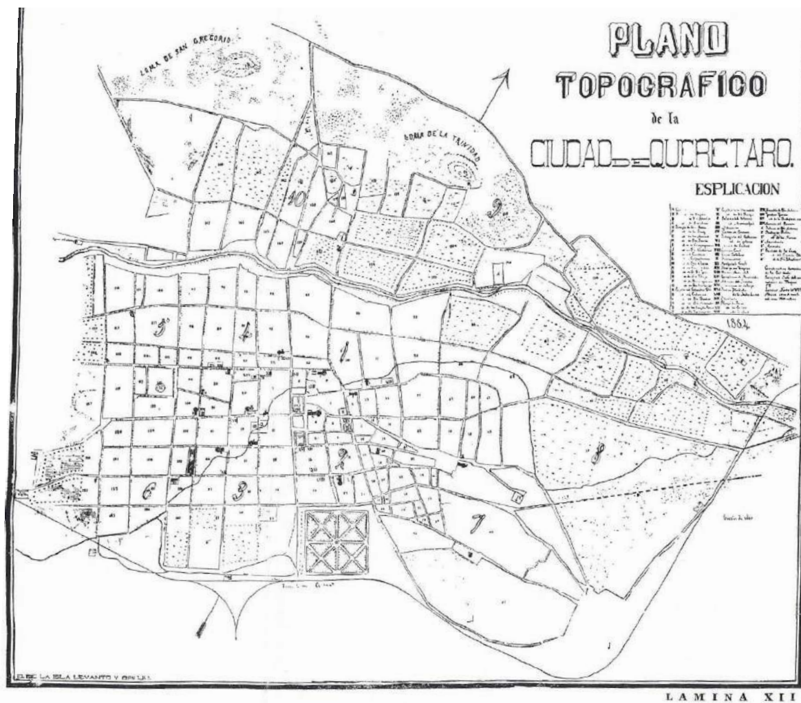
Mapa 3.2 Ciudad de Querétaro 1884.

1884 — PLANO LEVANTADO POR EL ING. EDMUNDO DE LA ISLA.