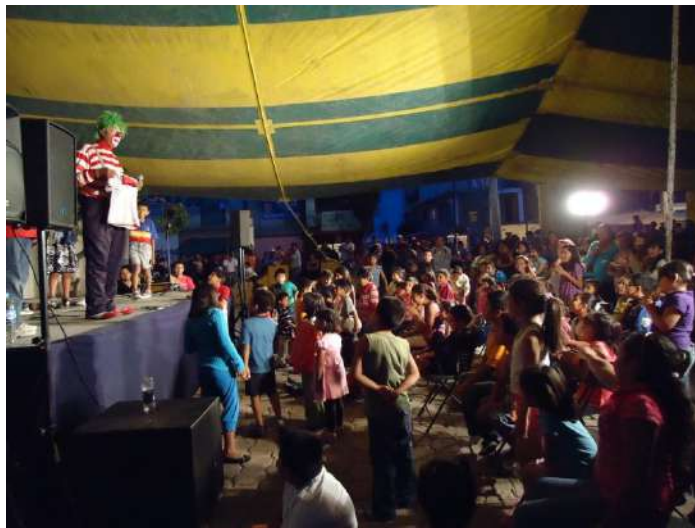
Figura 1.1 Evento recreativo en el atrio de la capilla durante la semana de la festividad de El Señor de las Maravillas.

Además, este trabajo de investigación puede convertirse en un modelo de análisis que contribuya al entendimiento de otros barrios, considerando ciertos aspectos compartidos y tradicionales; en este sentido, para conocer cómo mantienen rasgos culturales únicos que los distinguen y diferencian.