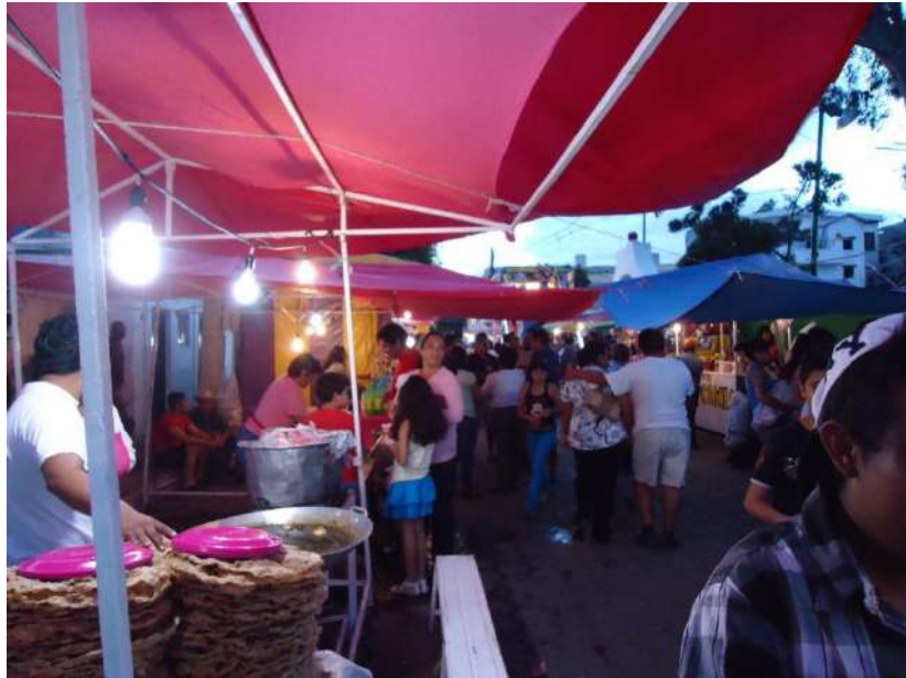
Puestos de antojitos ubicados en la calle Galeana