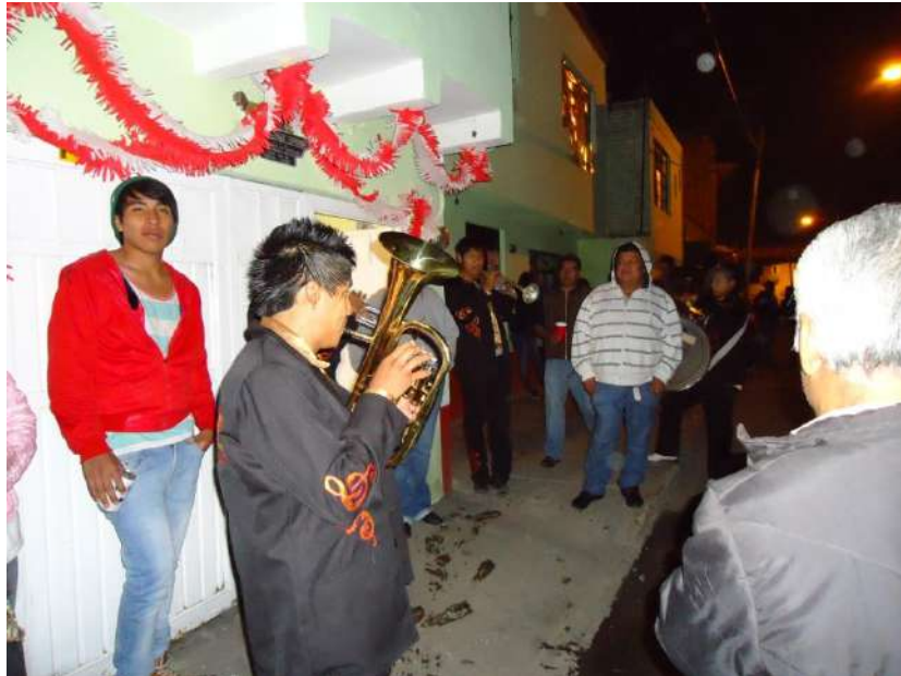
Familia Reséndiz entregando alimentos durante el recorrido del Gallo.