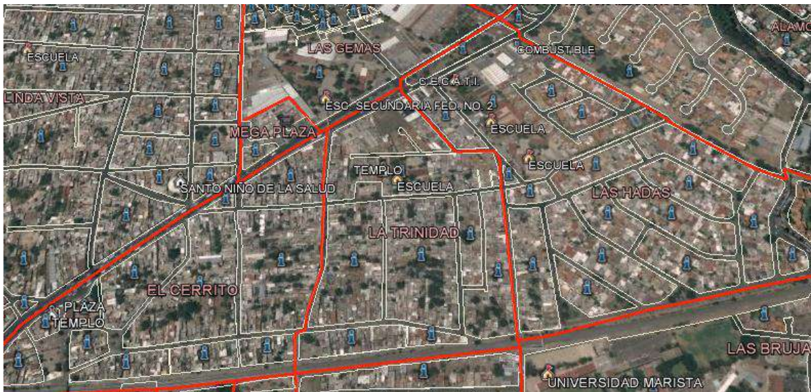
Figura 3.1 Límites del barrio La Trinidad.

El Barrio de la Trinidad, definido por los mismos habitantes como “El Barrio Cuetero” , se ubica al noreste del municipio de Querétaro, perteneciente al Estado de Santiago de Querétaro. Se encuentra entre las colonias: El Cerrito, las Hadas y Guadalupe Victoria. Integrado por siete manzanas y las siguientes calles: una avenida principal Avenida Corregidora; seis calles (en disposición vertical, tomado como referente la avenida principal) Ignacio López Rayón, Comonfort, Garambullo, Ignacio Salvador Vázquez y Marte; una privada y dos calles (en disposición horizontal, tomado como referente la avenida Corregidora) Privada Rayón, Hermenegildo Galeana y Mártires de Tacubaya.