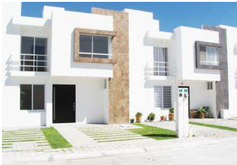
Foto 3.32. Tipo de vivienda fraccionamiento mediterráneo.

Fuente: Elaboración ventas del fraccionamiento, noviembre 2011.