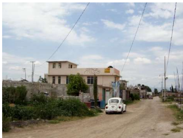
Foto 3.30. Tipo de viviendas en la parcela 105.

Fuente: Elaboración propia, septiembre 2010.