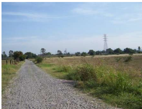
Foto 3.3. Parcela sin actividad agrícola aparente.