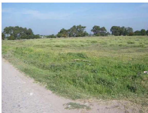
Foto 3.4. Tipo de parcela que no hay mucho interés por comprarlas.