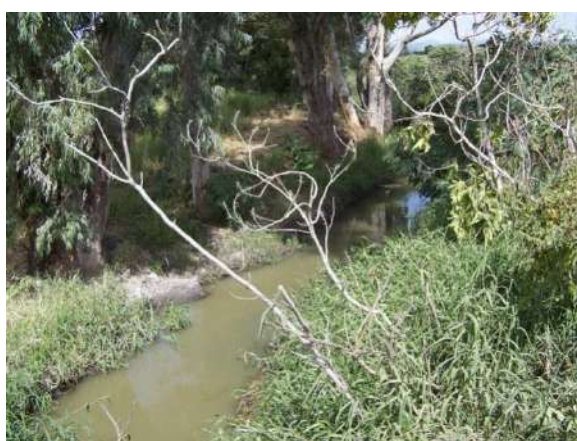
Foto 3.12. Salida del depósito a la acequia.

Fuente: Elaboración propia, septiembre 2010.