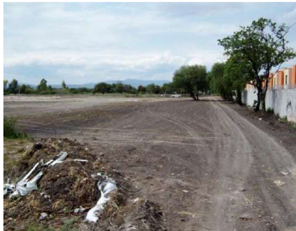
Foto 3.55. Terreno vendido a fraccionamiento Puerta Real.

Fuente: Elaboración propia, agosto 2011.