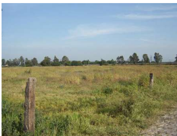
Foto 3.1. Parcela sin agua para riego.

Fuente: Elaboración propia, agosto 2010.