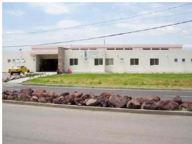
Foto 3.45. Prolongación avenida el Jacal.

Fuente: Elaboración propia, septiembre 2011.