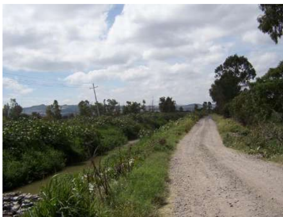
Foto 3.13. Acequia de aguas tratadas.

Fuente: Elaboración propia, septiembre 2010.