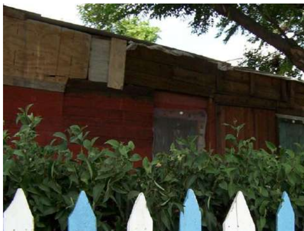
Foto 3.20. Vivienda tres.

Fuente: Elaboración propia, septiembre 2010.