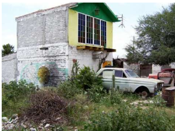
Foto 3.35. Diferentes tipos de viviendas.

Fuente: Elaboración propia, septiembre 2010.