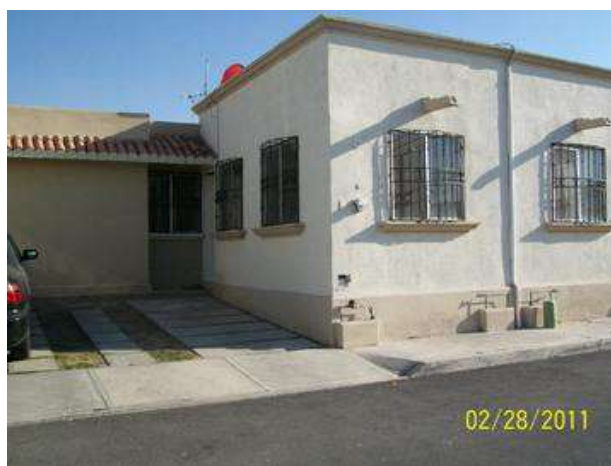
Foto 3.31. Tipo de vivienda fraccionamiento pirámides.

Fuente: Elaboración ventas del fraccionamiento, febrero 2011.