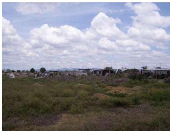
Foto 3.2 Parcela sin interés por la agricultura.

Fuente: Elaboración propia, agosto 2010.