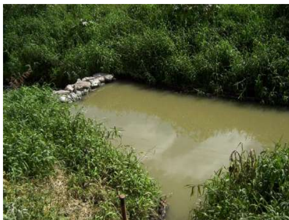
Foto 3.11. Depósito de aguas tratadas.