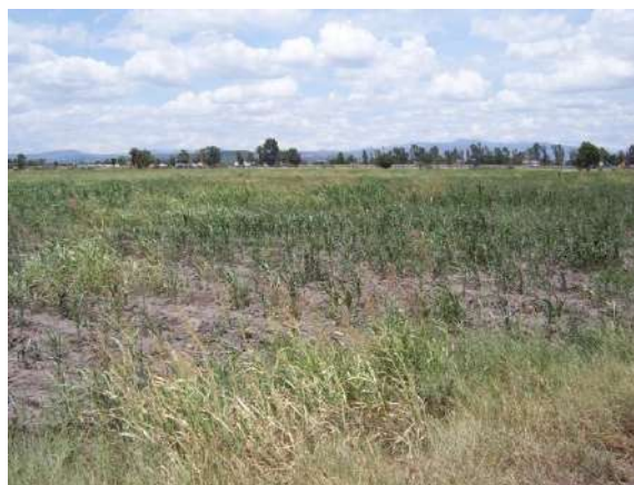
Foto 3.5. Parcela de temporal.

Fuente: Elaboración propia, agosto 2010.