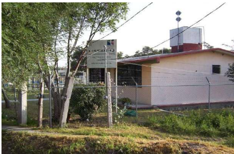
Foto 3.46. Modulo de Supervisiones de Educación Primaria.

Fuente: Elaboración propia, septiembre 2010.