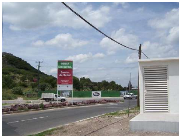
Foto 3.43. Obra estatal del Centro de Salud.

Fuente: Elaboración propia, septiembre 2010.