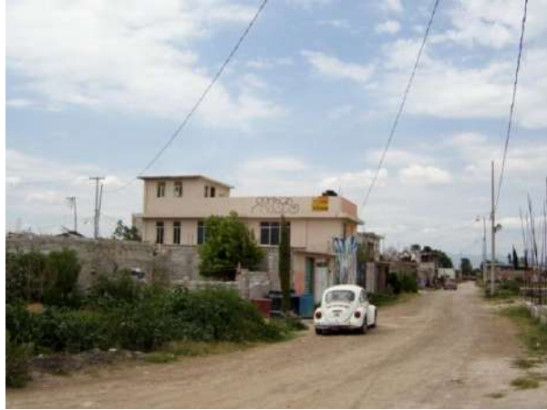
Foto 3.39. Banquetas y alumbrado público.

Fuente: Elaboración propia, septiembre 2010.