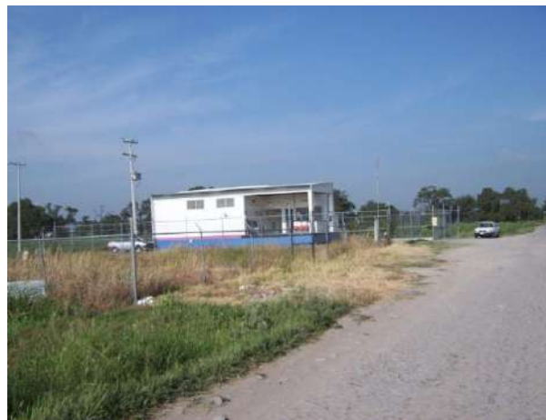
Foto 3.27. Centro de acopio de leche fresca.

Fuente: Elaboración propia, septiembre 2010.