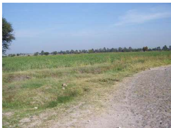
Foto 3.6. Parcela de temporal diferente cultivo.

Fuente: Elaboración propia, agosto 2010.