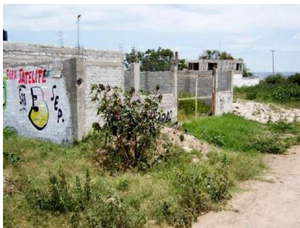
Foto 3.33. Poca seguridad en las viviendas.

Fuente: Elaboración propia, septiembre 2010.