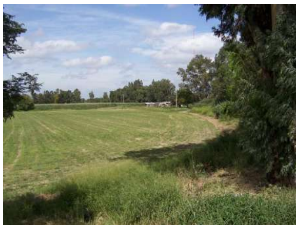
Foto 3.15. Cultivo de alfalfa.

Fuente: Elaboración propia, septiembre 2010.