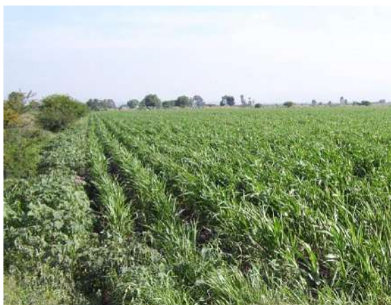
Foto 3.7. Parcela de riego.

Fuente: Elaboración propia, agosto 2010.