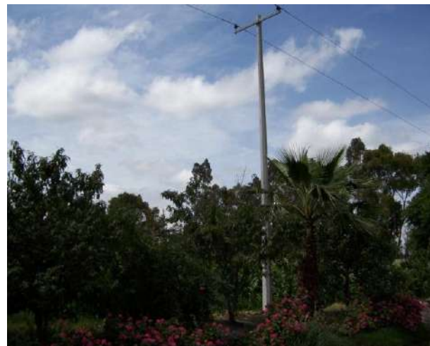
Foto 3.23. Tipo de huerto.

Fuente: Elaboración propia, septiembre 2010.