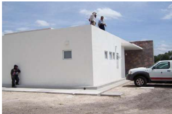
Foto 3.42. Construcción del Centro de Salud.

Fuente: Elaboración propia, septiembre 2010.