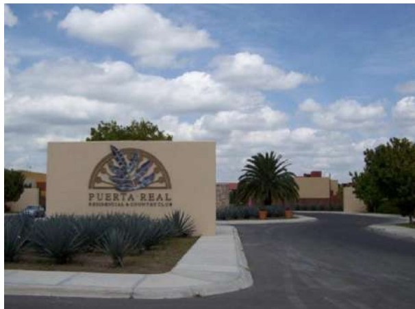
Foto 3.53. Entrada al fraccionamiento Puerta Real.

Fuente: Elaboración propia, agosto 2011.