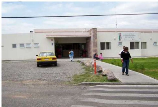
Foto 3.44. Dando servicio el Centro de Salud.

Fuente: Elaboración propia, septiembre 2011.