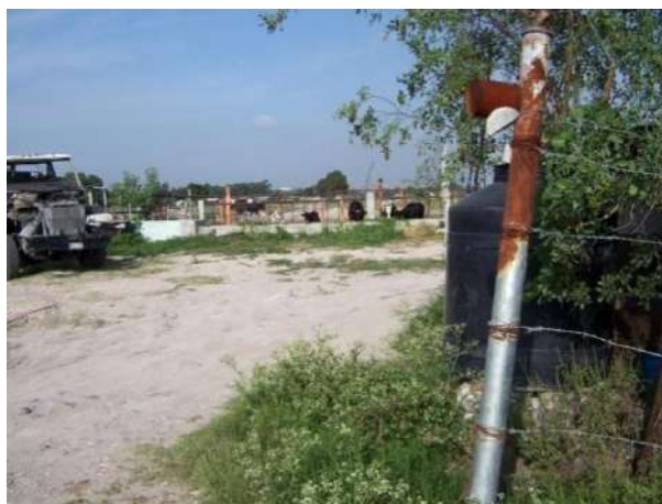
Foto 3.24. Tipo de corral de vacas.

Fuente: Elaboración propia, septiembre 2010.