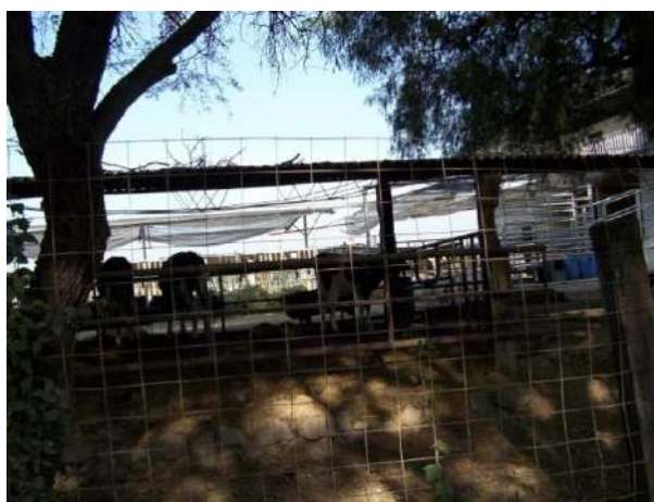
Foto 3.25. Tipo de corral de becerras.

Fuente: Elaboración propia, septiembre 2010.