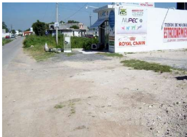
Foto 3.41. Comercio.

Fuente: Elaboración propia, septiembre 2011.