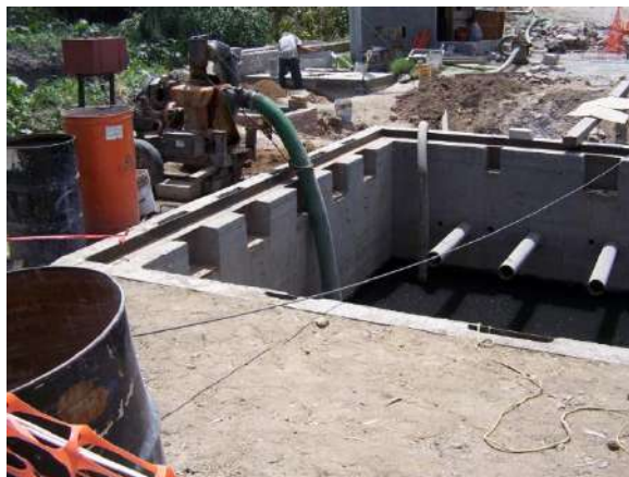
Foto 3.9. Tratamiento de aguas residuales.

Fuente: Elaboración propia, septiembre 2010.