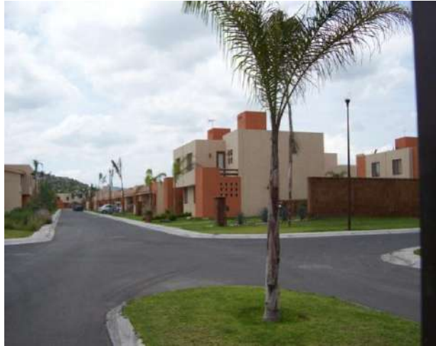
Foto 3.54. Viviendas fraccionamiento Puerta Real.

Fuente: Elaboración propia, agosto 2011.