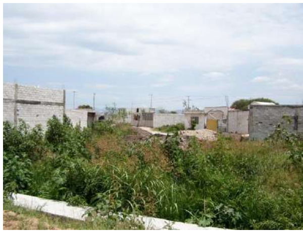
Foto 3.29. Tipo de viviendas en la parcela 117.

Fuente: Elaboración propia, septiembre 2010.