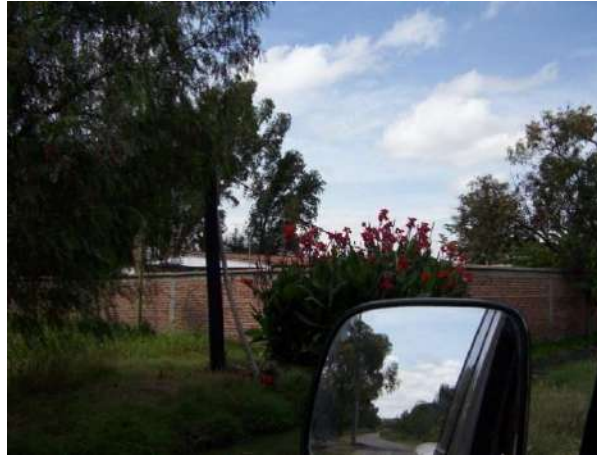
Foto 3.22. Casa de campo.

Fuente: Elaboración propia, septiembre 2010.