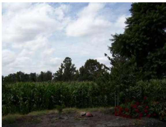
Foto 3.14. Cultivo de maíz.

Fuente: Elaboración propia, septiembre 2010.