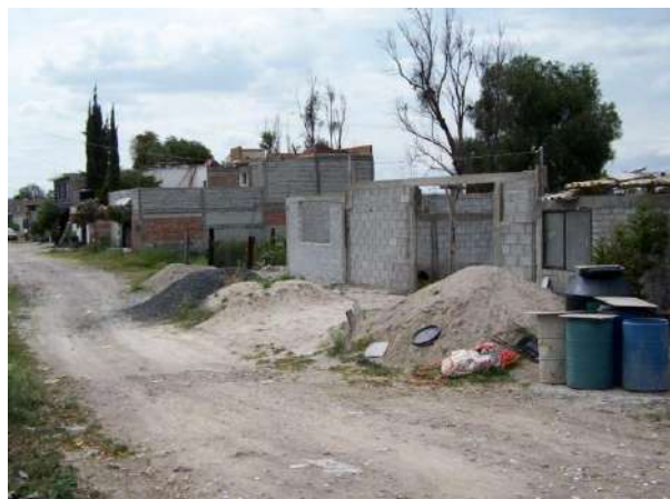
Foto 3.38. Materiales de construcción en la calle.

Fuente: Elaboración propia, septiembre 2010.