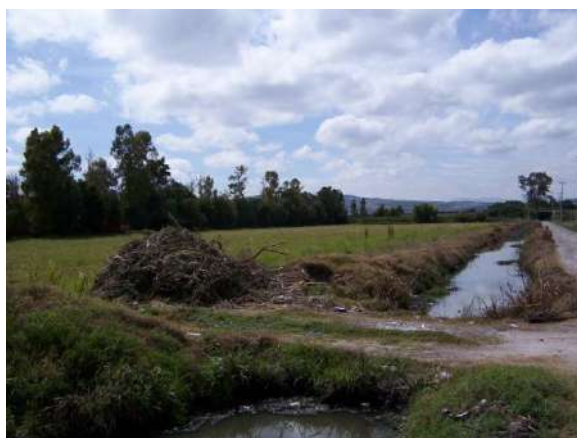
Foto 3.16. Cantidad de agua de la acequia.

Fuente: Elaboración propia, septiembre 2010.