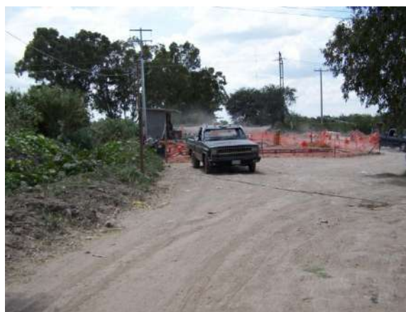
Foto 3.10. Depósito de aguas residuales.

Fuente: Elaboración propia, septiembre 2010.