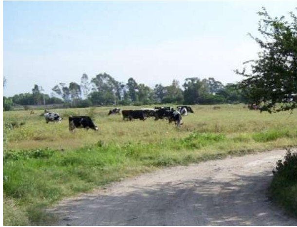
Foto 3.26. Vacas de pastoreo.

Fuente: Elaboración propia, septiembre 2010.