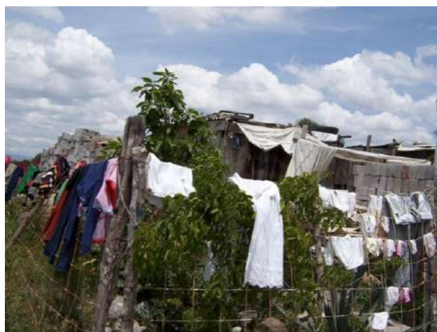
Foto 3.19. Vivienda dos.

Fuente: Elaboración propia, septiembre 2010.