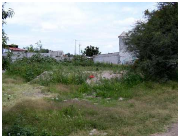
Foto 3.34. Terrenos baldíos.

Fuente: Elaboración propia, septiembre 2010.