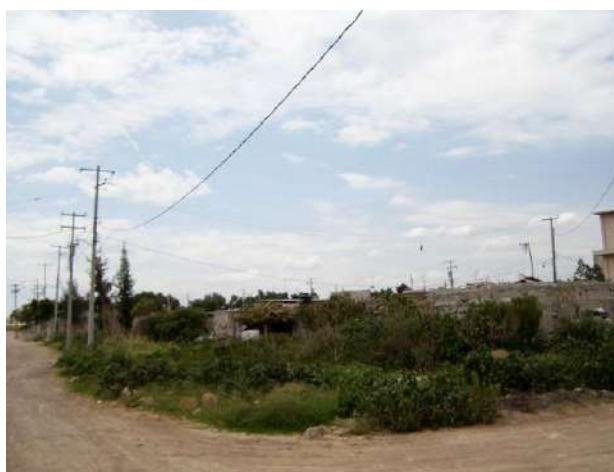
Foto 3.36. Calles y energía eléctrica.

Fuente: Elaboración propia, septiembre 2010.