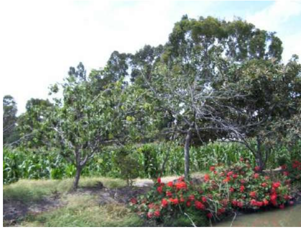
Foto 3.17. Otro cultivo de maíz.

Fuente: Elaboración propia, septiembre 2010.