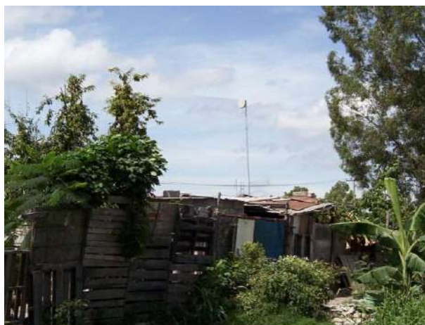
Foto 3.18. Vivienda uno.

Fuente: Elaboración propia, septiembre 2010.