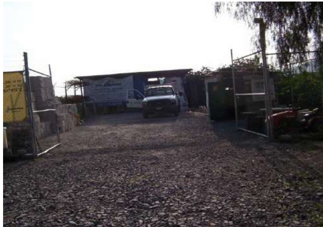
Foto 3.40. Venta de materiales para construcción.

Fuente: Elaboración propia, septiembre 2010.