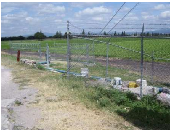
Foto 3.8. Pozo para cultivos de riego.

Fuente: Elaboración propia, agosto 2010.