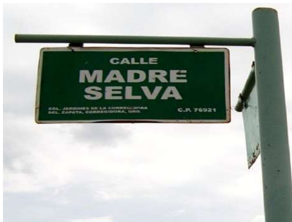
Foto 3.37. Único señalamiento de calles.

Fuente: Elaboración propia, septiembre 2010.