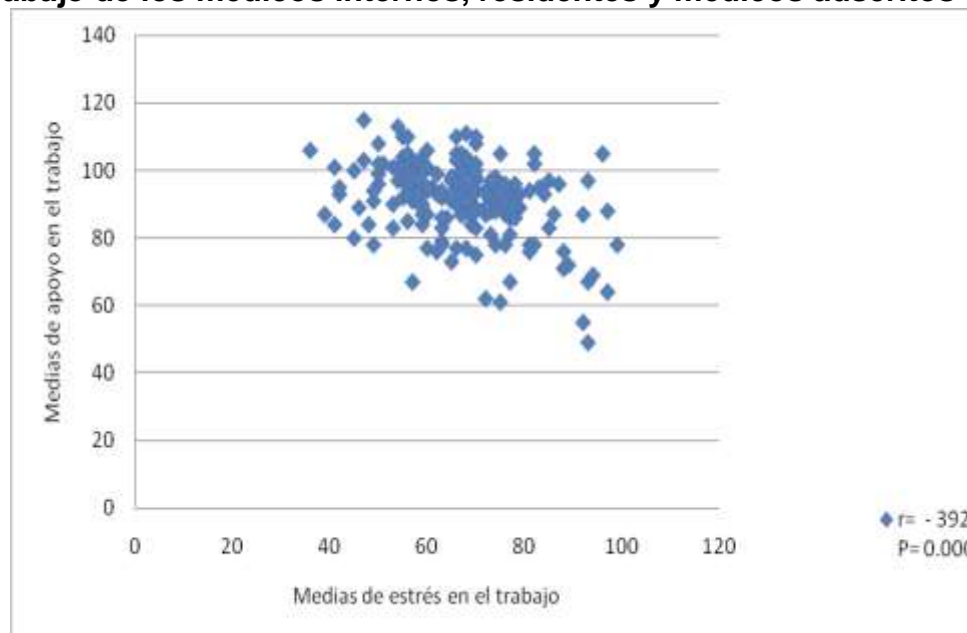
Figura.4.4. Correlación entre medias de estrés en el trabajo y medias de apoyo en el trabajo de los médicos internos, residentes y médicos adscritos del HGQ

Fuente Hoja de recolección de datos HGQ= Hospital General de Querétaro.