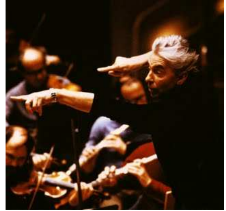
HERBERT VON KARAJAN