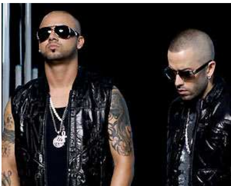
WISIN & YANDE