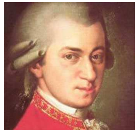
WOLFGANG AMADEUS MOZART