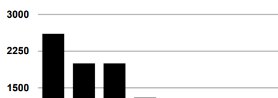
Gráfica 1. Usuarios activos en redes sociales en 2020

En el año 2020 se registraron más de 2000 millones de usuarios de redes sociales a nivel global.