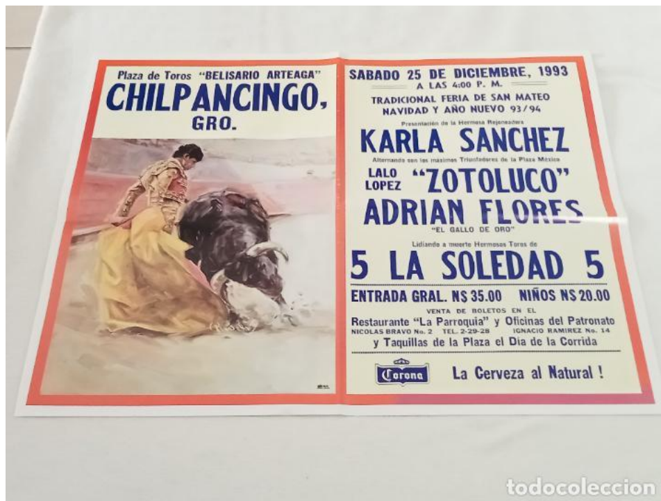
Figura 3. Cartel promocional de evento realizado en la Plaza de Toros Belisario Arteaga por motivos de la Feria de Navidad y Año Nuevo. Recuperado de https://www.todocoleccion.net/coleccionismo-tauromaquia/cartel-toros-raro-belisario-arteaga-chilpancingo