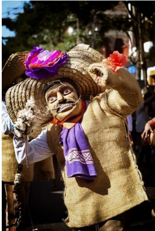
Figura 5 Tlacolero.