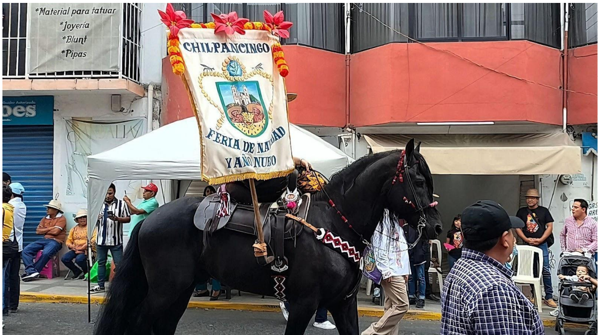
Figura 8. Pendón de Chilpancingo.