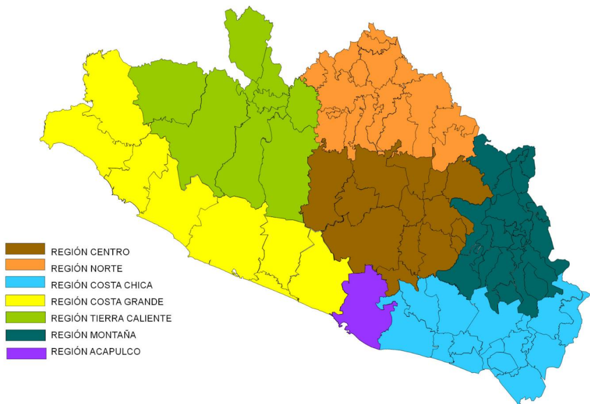
Figura 9. Mapa de las Regiones del Estado de Guerrero