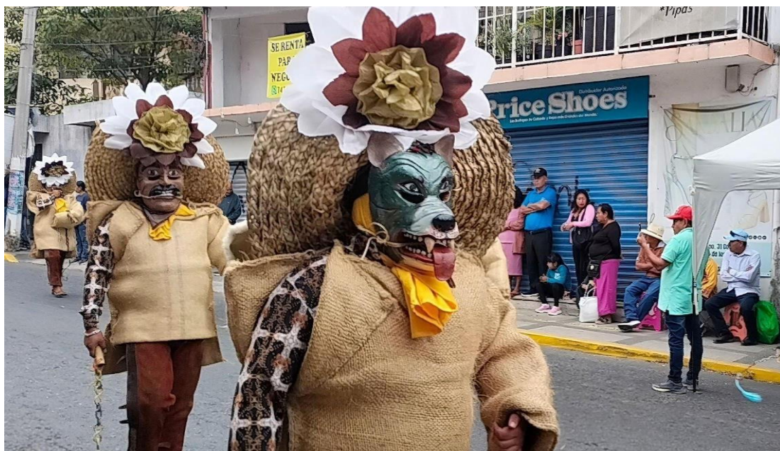
Figura 6. Tlacolero 2.