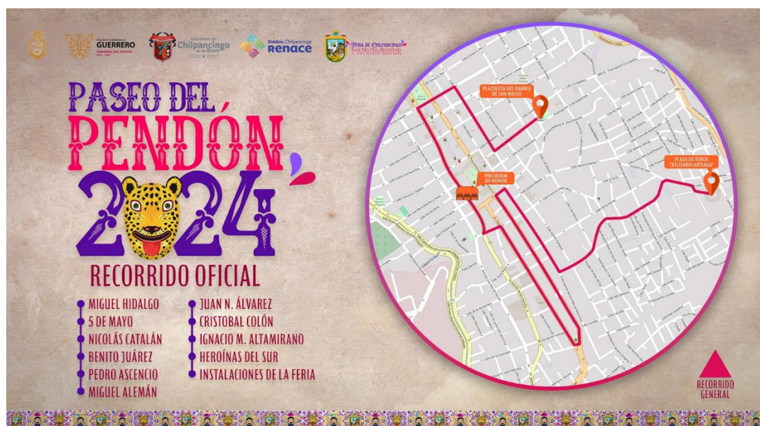
Figura 4. Recorrido del Paseo del Pendón 2024. Recuperado de: https://www.facebook.com/photo/?fbid=635007715546999&set=a.237671231947318