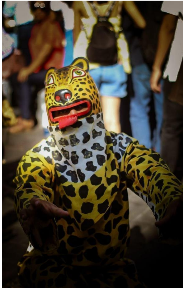
Figura 7. Tecuán de Chilpancingo.