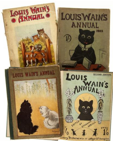
Una colección de los calendarios de Wain. De arriba a la izquierda: 1906, 1905, 1914 y 1902.

A sus 54 años incluso incursionó haciendo obras de gatos en cerámica, que tenían un aspecto futurista y que fueron muy bien acogidas en Estados Unidos entre 1907 y 1910 donde contribuyó a elaborar bocetos de caricaturas en el New York Journal-American. Este fue su último trabajo exitoso. Cuando la guerra estalla en 1914 el trabajo de Wain deja de ser tan demandado y a la par de una mala administración de sus bienes y el deterioro de su estado mental, para 1920 su condición personal y económica habían decrecido considerablemente. (Kennedy, 2016)