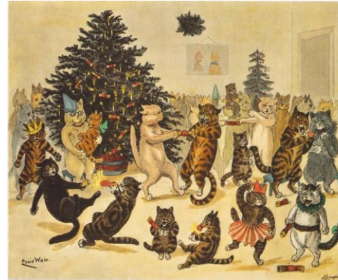
A kitten's s cristhmas party. 1886. Primera publicación de sus ilustraciones

Con el paso del tiempo sus gatos fueron tomando cada vez más formas antropomorfas, y su obra comienza a caracterizarse por gatos que aparecen erguidos, sonrientes, con expresiones faciales, ropa y accesorios de la época y representando escenas cotidianas: paseos, aulas de clase, bailes, tardes de golf, tarde de té jugando a las cartas, entre otros; volviéndose poco a poco en representaciones muy populares de la época, incluyéndose en libros para niños y postales.