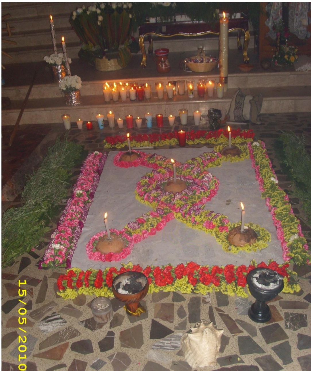
Nudos y espirales 1 conformidad entre las diferencias. (Milpa Alta, 2010, Archivo Personal, Fotógrafa Tanya Glz)

En la tradición de los pueblos originarios, el centro es un rumbo, donde se cruzan y reúnen los cuatro vientos, el arriba y el abajo, es una anudación. En este caso, hace lo común, cohesiona y da pertenencia. Procurarnos pasa por cuidar esos puntos de confluencia, y confluir es un seguir fluyendo, por eso a veces parecen remolinos, como los espirales que suben, bajan, se expanden y contraen, son centros que se mueven, se desplazan, eso construidos desde el procurarnos.