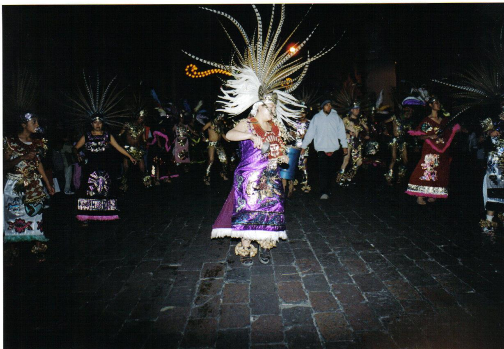
Movimiento 2 Contorsión del cuerpo en el paso de camino, la ondulación en las cuerpo singular y colectivo.

El denominado “paso de camino” el cual posibilita un desplazamiento lineal y no “circular” como el efectuado durante la mayor parte de la ceremonia. El paso de camino es ejecutado para desplazarse del cuartel general de la mesa al lugar donde se lleva a cabo la ceremonia y en durante el regreso. En términos coreográficos, el grupo de organiza en líneas, paralelas, se constituye mas como una especie de procesión y despliegue de fuerzas para la batalla, en tanto se ponen en juego cargos con funciones transitorias especificas. Las líneas paralelas llevan siempre una ondulación en las diferentes direcciones, izquierda derecha hacia delante, izquierda-derecha hacia atrás, atrás adelante, giros, “el paso de camino” no es propiamente “un solo paso” si uno una formación, la formación donde abre camino el fuego en el sahumador, los estandartes, el movimiento inicia con el pasado tejido con el presente, acompañándose, en tanto los signos de los ancestros históricos y contemporáneos caminan con los herederos actuales, en la parte central entre las filas paralelas van lxs niñxs, la generación venidera, el movimiento como un desplazamiento generacional, grupal, singular.