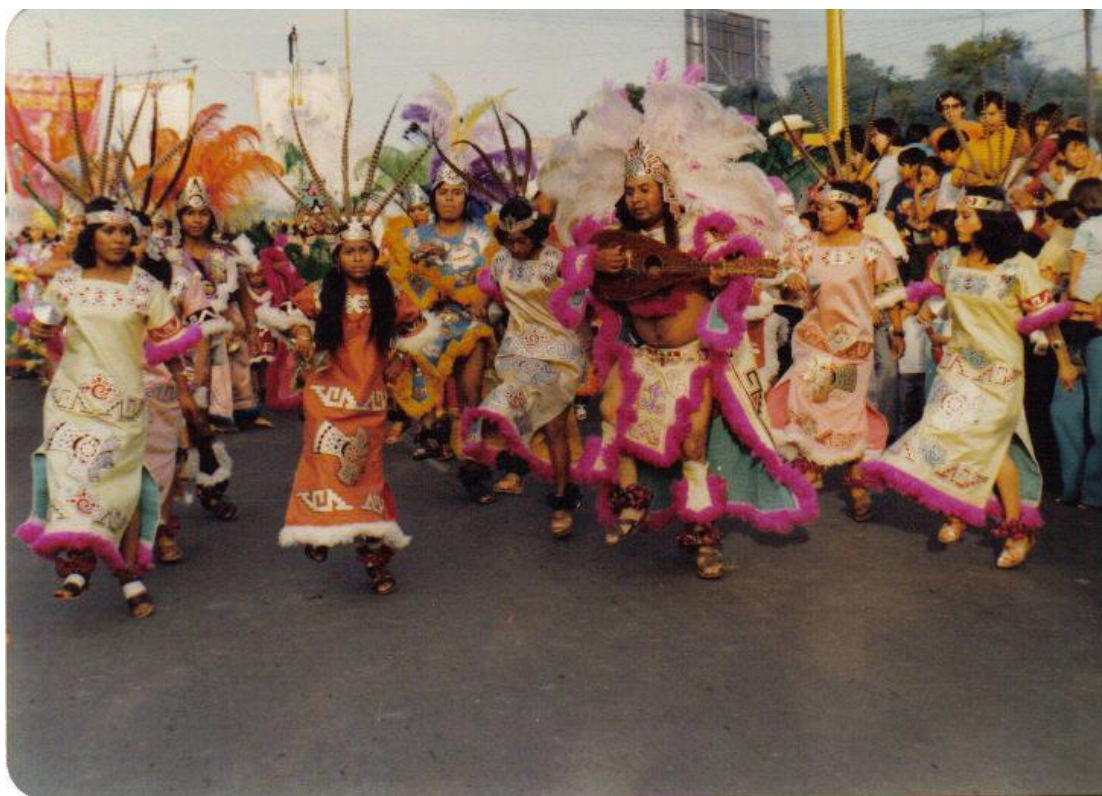
Movimiento 4 La importancia del movimiento armonico para hacer cuerpo.

Pasar a ofrecer la palabra, estar al centro del círculo/espiral, es tanto gesto social, el indicativo que lleva la pauta para la danza, a quien siguen todxs y cada unx de lxs danzantes, lo que se reproduce de principio a fin. Se ha mencionado el “ofrecimiento” de la danza, este acto se da cuando a uno de los danzantes el “sargento” le otorga el permiso de hacerlo, con lo cual el danzante pasa al centro de los círculos de danzantes a llevar el ritmo y la danza, a sus pasos y tiempos la colectividad se sujeta al ritmo del tambor. Existe pues la reverencia y el ofrecimiento, tanto el saludar al sol, a los cielos, como el reverenciar.