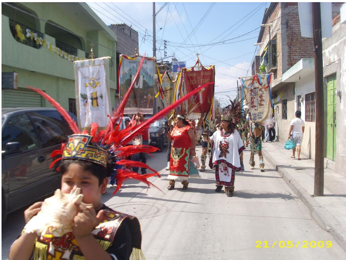
Procurarnos 3 El llamado, nos convoca y advierte del camino que se va construyendo, en cada cruce con los otros caminos, para no chocar, para seguir caminando (Cortazar, 2009, Archivo personal,)