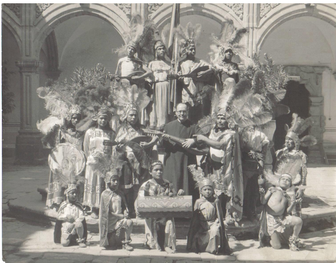
Los Ancestros 1 Memoria de la danza, archivo de la Familia Aguilar Bailon, se observa el teponaztle.

Como elementos que permanecen se observa en las fotografías instrumentos musicales, atuendos, estandartes y quienes integran la danza, para con ello ubicar constantes y transformaciones en la danza de concheros.