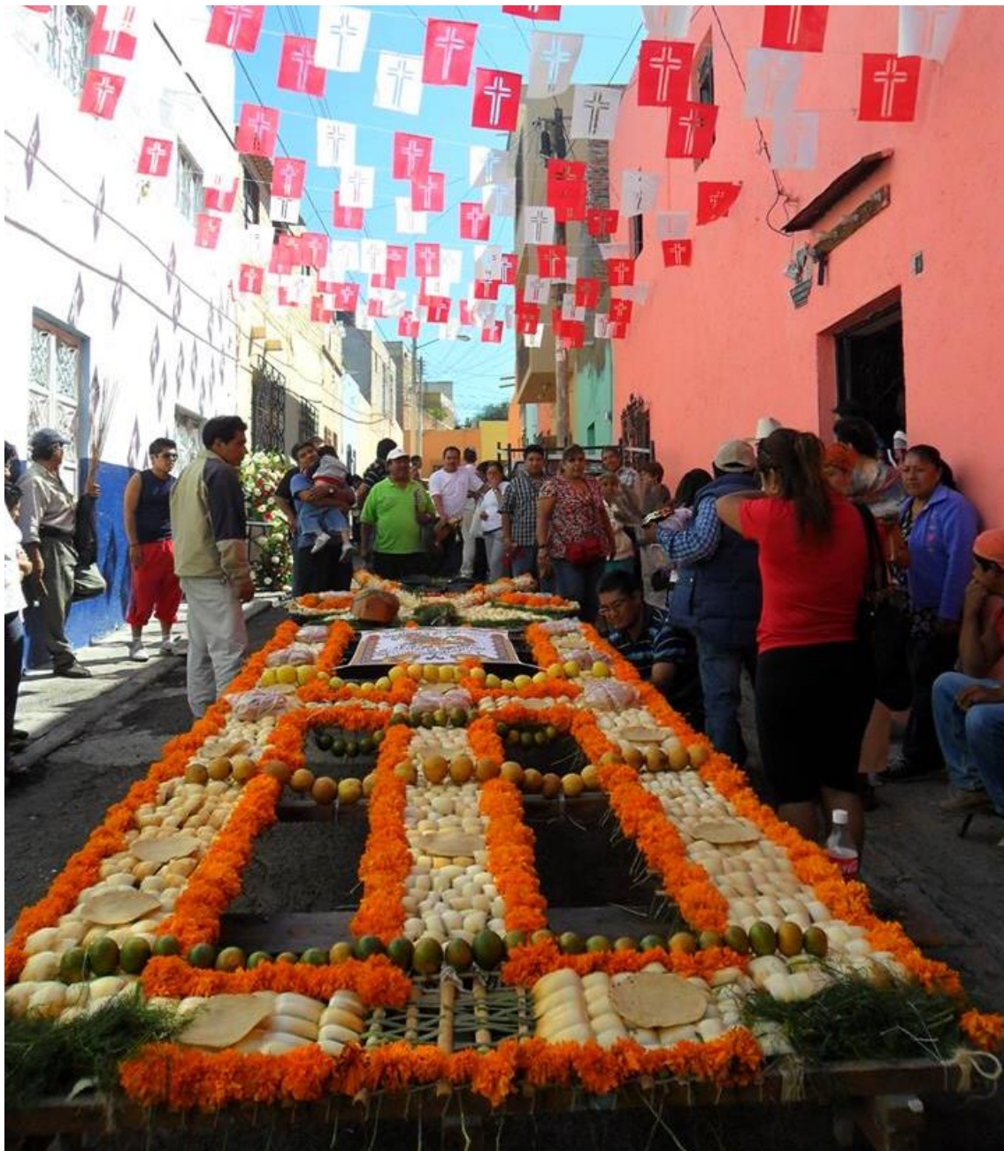
Nudos y espirales 4 Ofrenda de cucharilla y alimentos;"chimal" "arco" (Querétaro, 2011)

fulgor, le da un carácter de resistencia cultural como algo que es capaz de cambiar formas para permanecer, de introducir elementos que habrán de ser interpretados desde códigos particulares para darles un contenido en tanto trascendencia histórica. Se juega además el elemento del tiempo no solo mirando al origen, la tradición no como elementos que miran al pasado con nostalgia, sino que se cruzan en los tiempos.