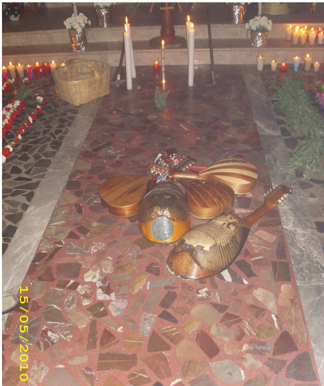
Nudos y espirales 2 Lo que se nombra, se porta y se comporta con ello. (Milpa Alta, 2010)

procesión, y están al centro en los círculos de la danza. Son centros visibles. Abren el camino, abren el tiempo para iniciar la ofrenda.