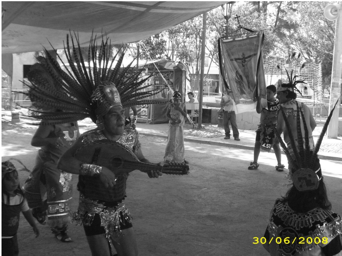
Movimiento 3 El gesto. Tolimán, Querétaro

comparación con elementos solares puede ser una forma de buscar núcleos interpretativos de lo proyectado hacia los diferentes, una forma de pensar en donde lo evidente debe tener una verdad oculta, otra verdad que construye la forma; por otro lado el cuerpo social es atravesado por la historia, la política, la historia en tanto tradición que es costumbre, reiteración donde en mantener esa forma se encuentra la justificación, más allá de la complejidad de significados entramados que se buscan.