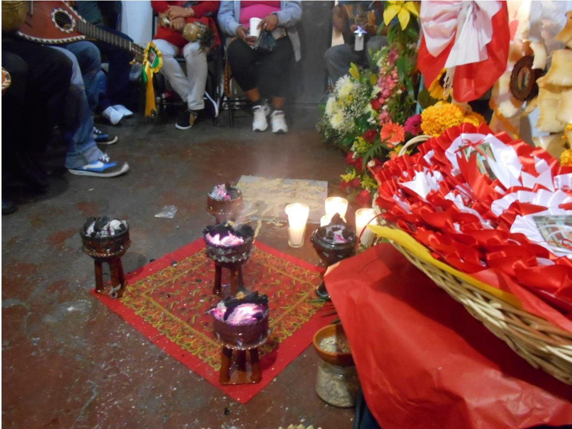
Los Ancestros 6 Velación: palabras y acciones para tejer la memoria (archivo personal, 2014)

La no inclusión de imágenes con figuras humanas representantes de la tradición católica no significa la no incorporación de estos sentidos los cuales aparecen en los escenarios donde las fotografías se produjeron, aunque con ello se intuye la asignación de significaciones particulares al sentido de religiosidad, más centrado en el lazo social en términos de reciprocidad mantenidos en los vínculos de “conquista” y “compadrazgo” una de las alabanzas dice