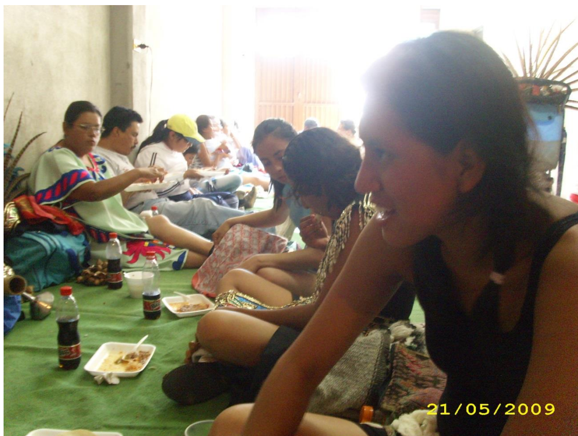
Procurarnos 2 Incorporarnos, alimentarnos mutuamente con nuestra energía y alimentos. (Cortazar, 2009)

En procurarnos, se nombran esos actos de la renunciar al poder como mandato, para hacer evidente el “mandar obedeciendo” y “cuidado” como pauta central, se le ha denominado “procurarnos” en tanto es también un trabajo colectivo, administrarse, es donde se hace un despliegue de los sentidos ético políticos donde se entrama el universo cultural, donde la autogestión como forma se pone en marcha, los caminos necesarios, sin caminos por que se transita en ellos. Hacen visible la autonomía como ejercicio de autodeterminación y autogestión en tanto lo organizativo, económico, histórico, afectivo.