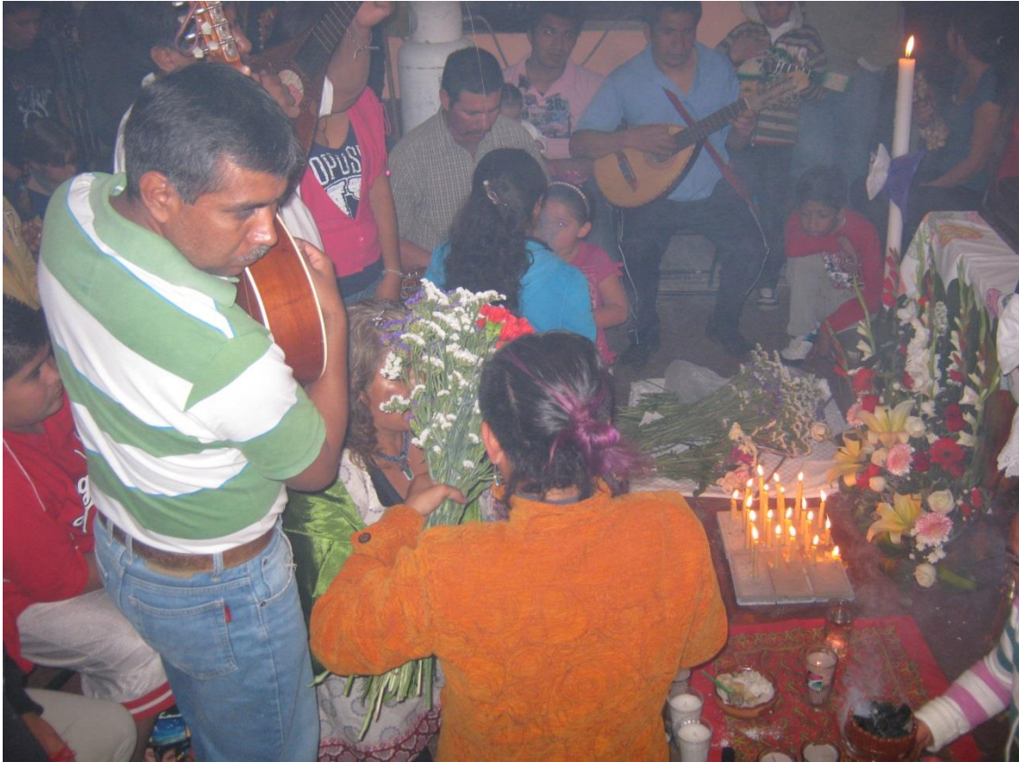
Nudos y espirales 5 Velar, ofrecer el sueño, el cansancio, los cantos, la voz, cada uno de los trabajos al lado de la luz de las almas (Querétaro, 2013, Archivo Personal, fotógrafo Sebastián Trejo)

Las conchas de armadillo, al igual que el estandarte toma sentido de reliquia, al conservarse en el cuartel el instrumento del jefe cuando este deja de estar como tal para convertirse en “anima conquistadora de los cuatro vientos” es decir cuando deja de estar y queda el testimonio de su trabajo por preservar la tradición haciendo sus trabajos de conquista y compadrazgo. Poniéndose en juego también los afectos, los sentimientos que acompañan cada acción, no se trata solo de cumplir con el deber sino del amor como sentimiento colectivo.