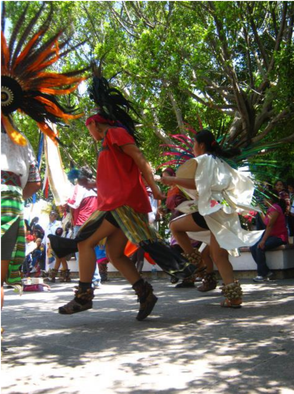
Movimiento 5 Danzar es como volar.

las rutas, velocidad y fuerza. Algunos “deslizados” al frente son de un doble tiempo, y con ello una especie de reverencia del cuerpo, los saltos se diferencian de los “cojitos”