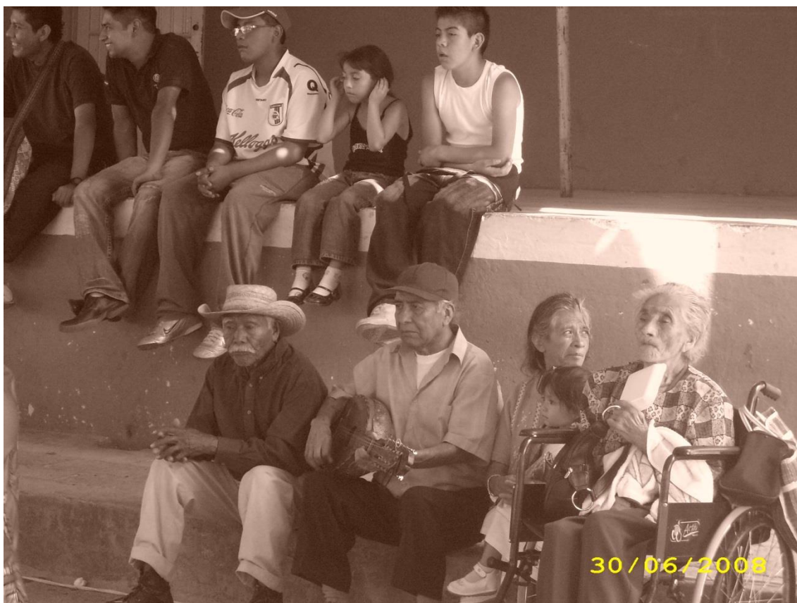
Procurarnos 1 Ser jefe es cuidar de la colectividad (Cadereyta, Archivo personal, 2008, Fotografía Hugo Sánchez)

Podríamos decir que las dos primeras categorías corresponden al eje temporal, ya sea al tiempo como entramado de lo que ha sido, lo que es, lo que podría ser, y el entramado de los desplazamientos dados en el tiempo que configuran el movimiento. Podríamos decir que existe un esfuerzo, un pequeño trabajo casi invisible que posibilita desplazamientos, mantiene la unidad, para que en ese tránsito no se disgregue el cuerpo social, no se disuelva de una generación a otra, de una ceremonia a otra, en tanto la colectividad no permanece en un espacio, la apropiación del espacio y el tiempo es a modo de circuito, así como en el paso de camino que el transitar es casi efímero para llegar a instaurarse al lugar de la ceremonia, así se entra y sale de manera continua en la vivencia de la danza, como una latencia que va acumulándose para luego explotar.