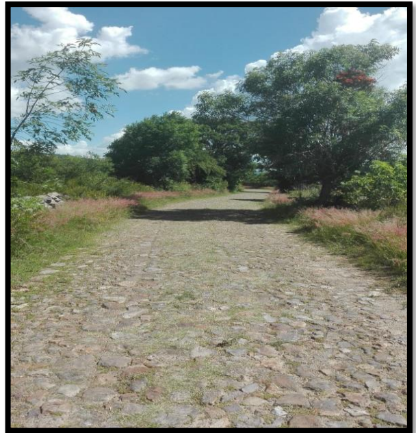
Imagen 4. Nula presencia policial