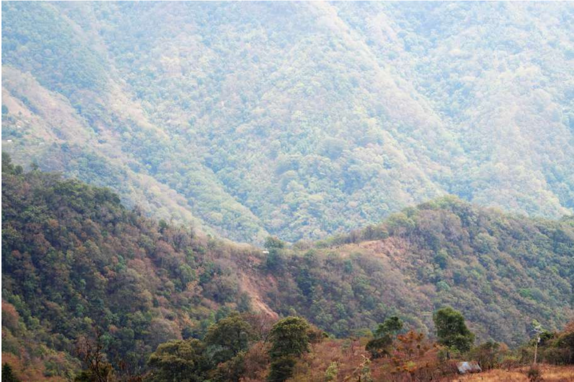
Foto 9. Dakūj yachra 'cuesta en dónde se come tortilla', así se denomina el lugar del fondo, ya que después de subir una cuesta, la gente se sentaba a comer en aquel lugar. Se localiza al sur de la Ranchería de San Antonio Dos Caminos.

También el uso del espacio tuvo que ver con el nombramiento, como en los siguientes ejemplos: