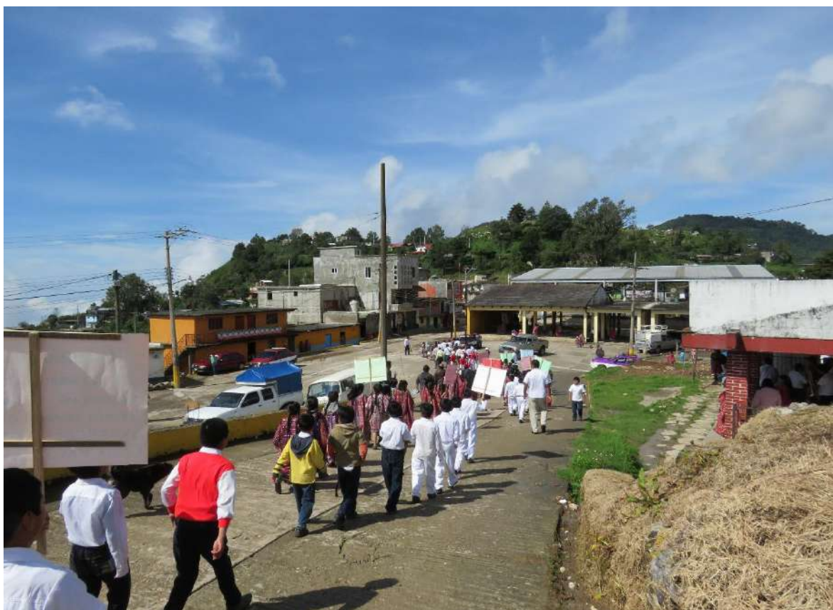
Foto 5. Riña dukuâ ga'a ‘en la cara de la cárcel’, así se denomina este lugar por estar situado frente a la cárcel municipal. Se localiza al centro de san Andrés Chicahuaxtla.

Las denominaciones que contienen nombres de objetos o construcciones debidas a la intervención humana en la naturaleza por lo regular llevan un calco del cuerpo humano o un elemento preposicional, en este caso, los objetos no pueden ir primero como se mencionó antes, ya que desde la perspectiva triqui un nombre antropomórfico no puede desplazar un espacio, mucho menos un objeto, sólo se toman como referencia, como el caso de riki nûhui ‘abdomen (debajo) de la iglesia’, que es un lugar inclinado que está situado en el costado inferior de la iglesia; otra denominación es yichrá yingâ ‘espalda (encima) del cerco’, donde hace tiempo existió un cerco en este lugar y se ubica en el lado posterior. Eso sí, aparecen dos topónimos como Nuhuî gè ‘iglesia sagrada’ y Rugutsì mên̄tu ‘cruz de juramento’, que no llevan elementos adposicionales actualmente, pero posiblemente en el pasado sí las llevaron porque en las conversaciones se mencionan frases como: Riña ne