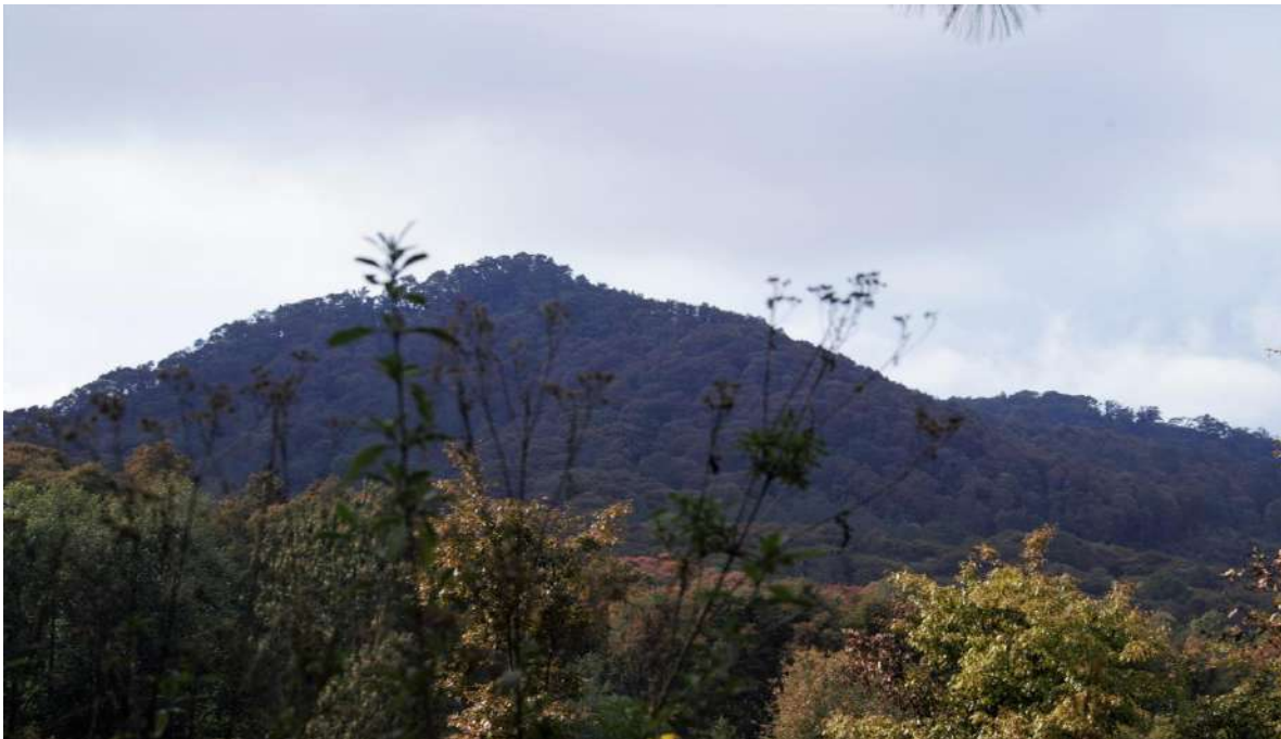
Foto 8. Kij guñanj ‘Cerro dios’, así es la denominación del cerro que se considera sagrado y es respeto por la gente, se localiza al oriente de la comunidad de La Laguna Guadalupe.