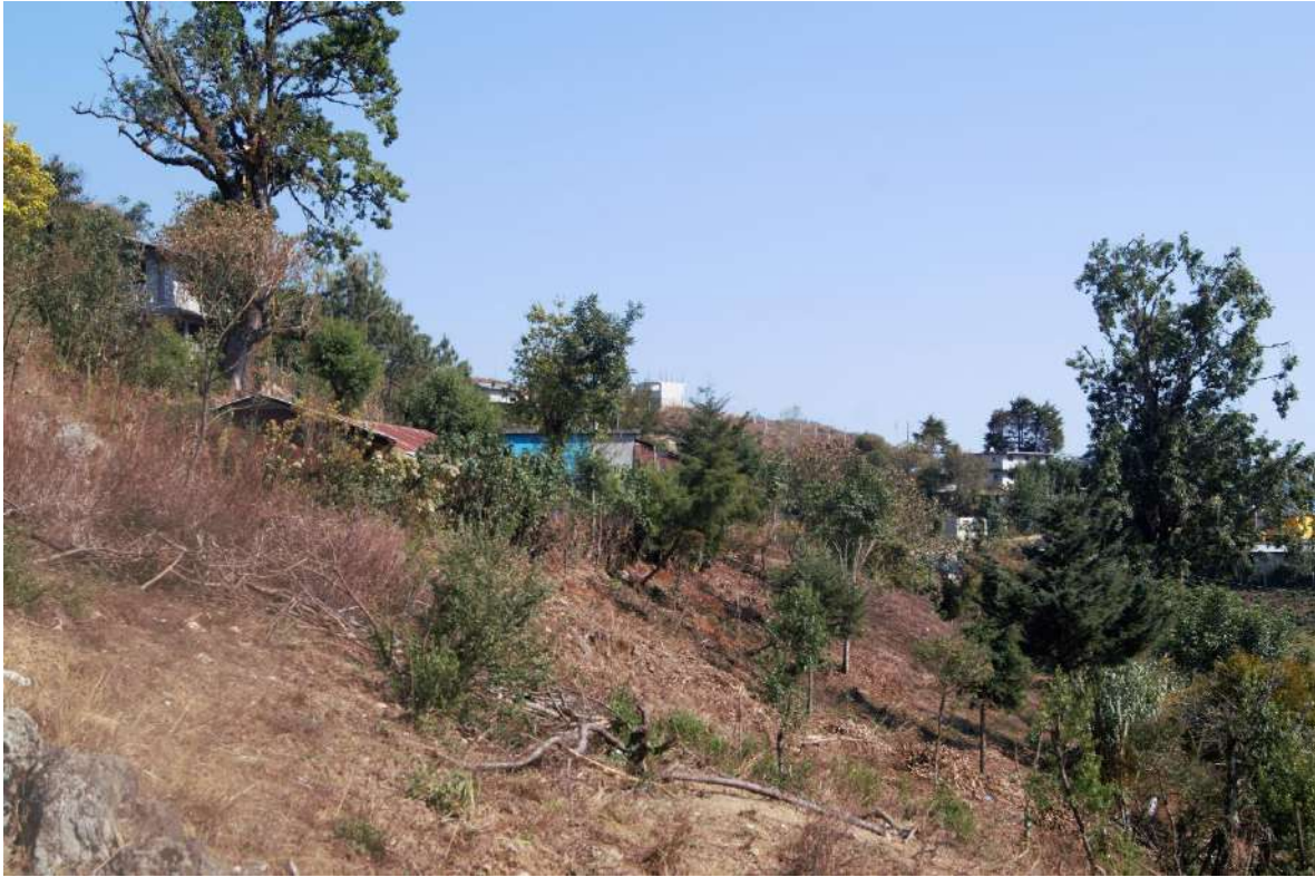
Foto 2. Dakūj u ‘cuesta’, es el nombre que recibe este lugar por estar empinado, se localiza en el centro de San Andrés Chicahuaxtla.

Es el segundo más numeroso y se refiere a los accidentes geográficos en sí como en: Nâtaj a ‘meseta’ o Ta ‘llano’; suelen estar sin acompañamiento y la mayoría de los pueblos las usan para designar sus lugares, por lo que es común encontrar los mismos nombres en casi todos los poblados. Otros lugares como Dakūj nēj e ‘ladera de enfrente’ y Dakan rukùu ‘loma de atrás’ indican la localización espacial del lugar, no debiendo confundirse con lugares en donde estos calcos del cuerpo humano cambian, como en: Rukû ta ‘detrás del llano’ y Yi’i dogo’òo ‘en donde empieza el pie del monte’ que son lugares que se ubican tomando de referencia el accidente geográfico; en este caso Rukû ta ‘detrás del llano’, es el lugar que está detrás del llano mientras que Dakuj nēj e ‘ladera de enfrente’ es la ladera que se ubica del otro lado del lugar en donde nosotros estamos situados. Existe un reducido