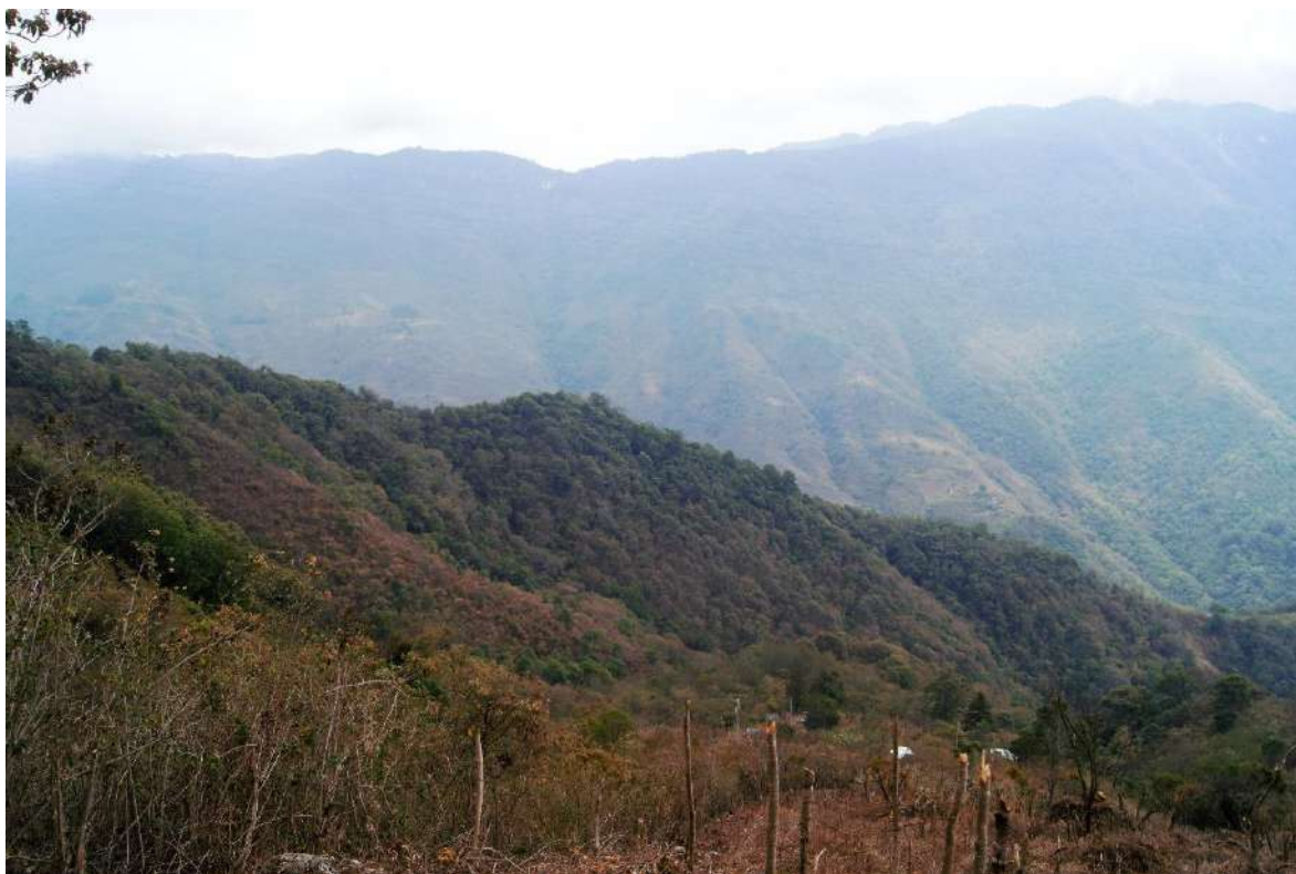
Foto 11. Dakūj hūe ‘cuesta brava’, así se denomina este lugar por esta muy inclinado y con una longitud bastante grande, se localiza al sur de la ranchería San Antonio Dos Caminos.

Chichahuaxtla se ubica en un lugar montañoso, sobre su territorio pasaba el camino antiguo que conectaba a la capital oaxaqueña y otros poblados con la costa chica de la misma entidad y del estado de Guerrero. De toda la travesía Chichahuaxtla era el lugar más abrupto que tenían que soportar al dirigirse a la capital oaxaqueña, ya que se tiene que subir 1,200 metros aproximadamente y volver a ascender para seguir con el recorrido. Esta pendiente muy pronunciada tiene una toponimia muy particular en la que se describen los esfuerzos y acciones que realizaba la gente al subirla, además trataron de involucrar otros topónimos cercanos en estas acciones como se describe a continuación a partir del relato del Prof. Juan Vásquez Guzmán: