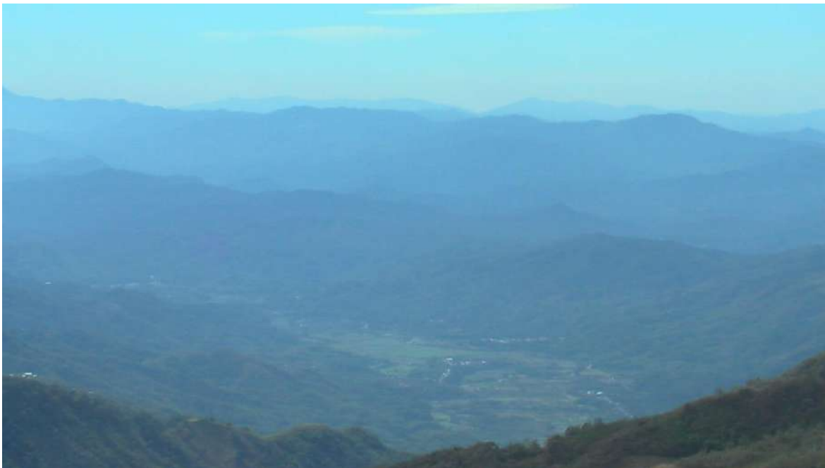
Foto 10. Sēnda ‘la hacienda’, así es denominado un poblado del valle que se ve al fondo, en ella se estableció una hacienda durante la colonia.

Por último, está un número reducido de préstamos los cuales se identifican por tener un tono alto (4), que son los siguientes: