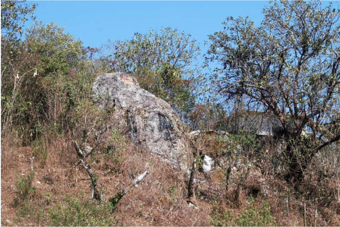
Foto 6. Sikûj huēj e 'en la esquina de la roca', así se denomina este lugar por tener una roca puntiaguda, se localiza en San Andrés Chicahuaxtla.

Este apartado hace referencia a las piedras y rocas que son elementos naturales que también sirvieron y sirven para nombrar espacios; tenemos topónimos como Dakûj nuhuēj 'ladera en donde está pegada la roca', en donde justamente en una ladera se ve visible un peñasco, también está Siganin̄j huēj e 'entre las rocas', que es un lugar caracterizado por tener rocas en abundancia. Las piedras también son importantes como Riki hiej , 'en el abdomen (debajo) de la piedra' o en Riña hiej m̄anj an 'en la cara (frente) de la piedra extendida', la mayoría de estas denominaciones forzosamente llevan calcos del cuerpo humano o sustantivos inalienables que funcionan como preposiciones.