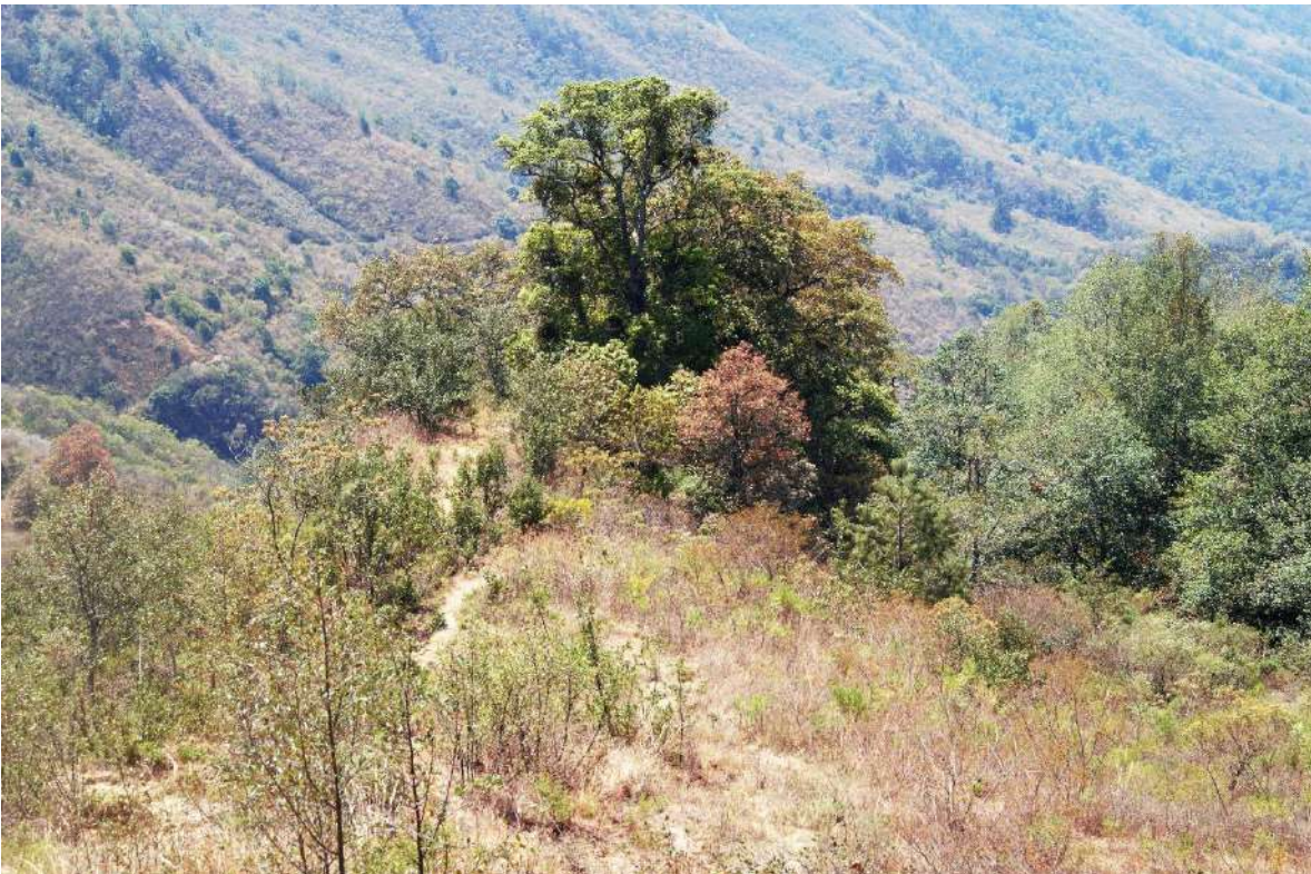
Foto 1. Sitāj ranēj e ‘en donde está puesto el encino’, denominación que recibe este lugar por tener un grupo de árboles de este tipo

La flora es el aspecto que más se utiliza para la denominación de los lugares: tenemos lugares como: Dakan dugūtaj a ‘loma helecho’, Kij ñunj ‘cerro palma’, en donde se especifica la abundancia de estas especies en el lugar, o que hubo. También están los términos como: Ta reko ‘llano de anona’ o Ne rutanj ‘agua de árbol de espina’ la cual no indica abundancia, sino que es la única especie o lo más sobresaliente del lugar; por último, está la flora como punto de referencia para identificar lugares como: Yichrá nitan ‘en la espalda de la mora’ refiriéndose al espacio que está en la parte posterior o norte de este árbol, y en Yi’i rugui’i ‘al pie del durazno’ refiriéndose al espacio junto al árbol, no