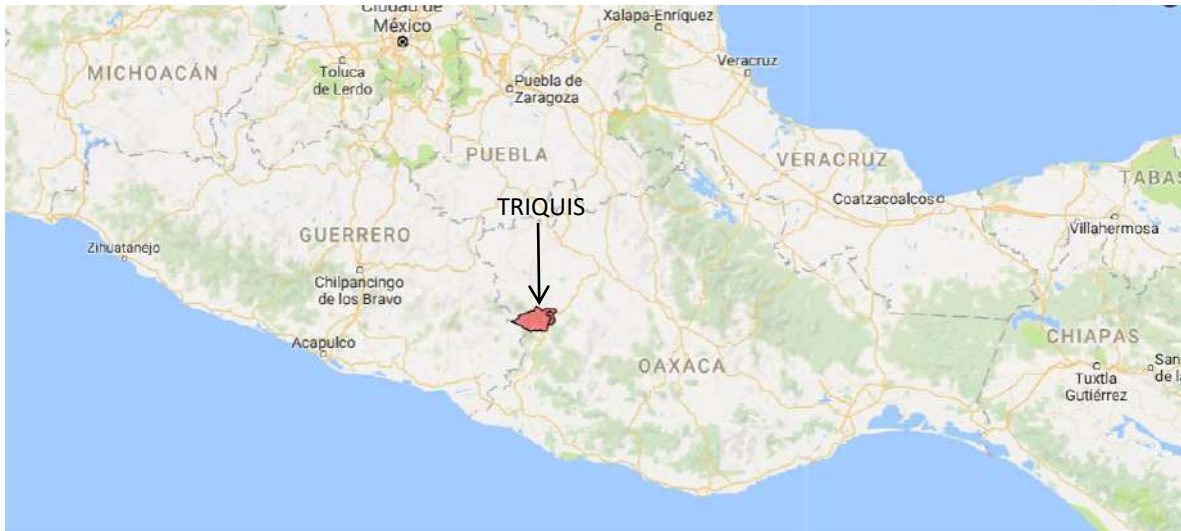
Mapa 1. Ubicación de la etnia triqui.