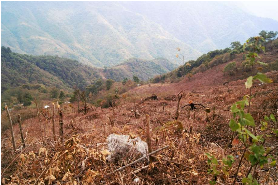
Foto 4. Rá yakaj ‘arroyo del jabalí’, así es denominado este lugar porque en ella abundan los jabajíes.

La fauna indica los animales que abundaban en o frecuentaban el sitio para tomar agua como en Rá nataj ‘arroyo agua de venado’ y en Rá yakaj ‘arroyo del jabalí’; en la primera denominación los venados bajaban a tomar agua y en el segundo aún abundan los jabalís. Está otra denominación que es: Ne yñan ‘agua de cangrejo’ en donde posiblemente vivía un cangrejo en el pozo.