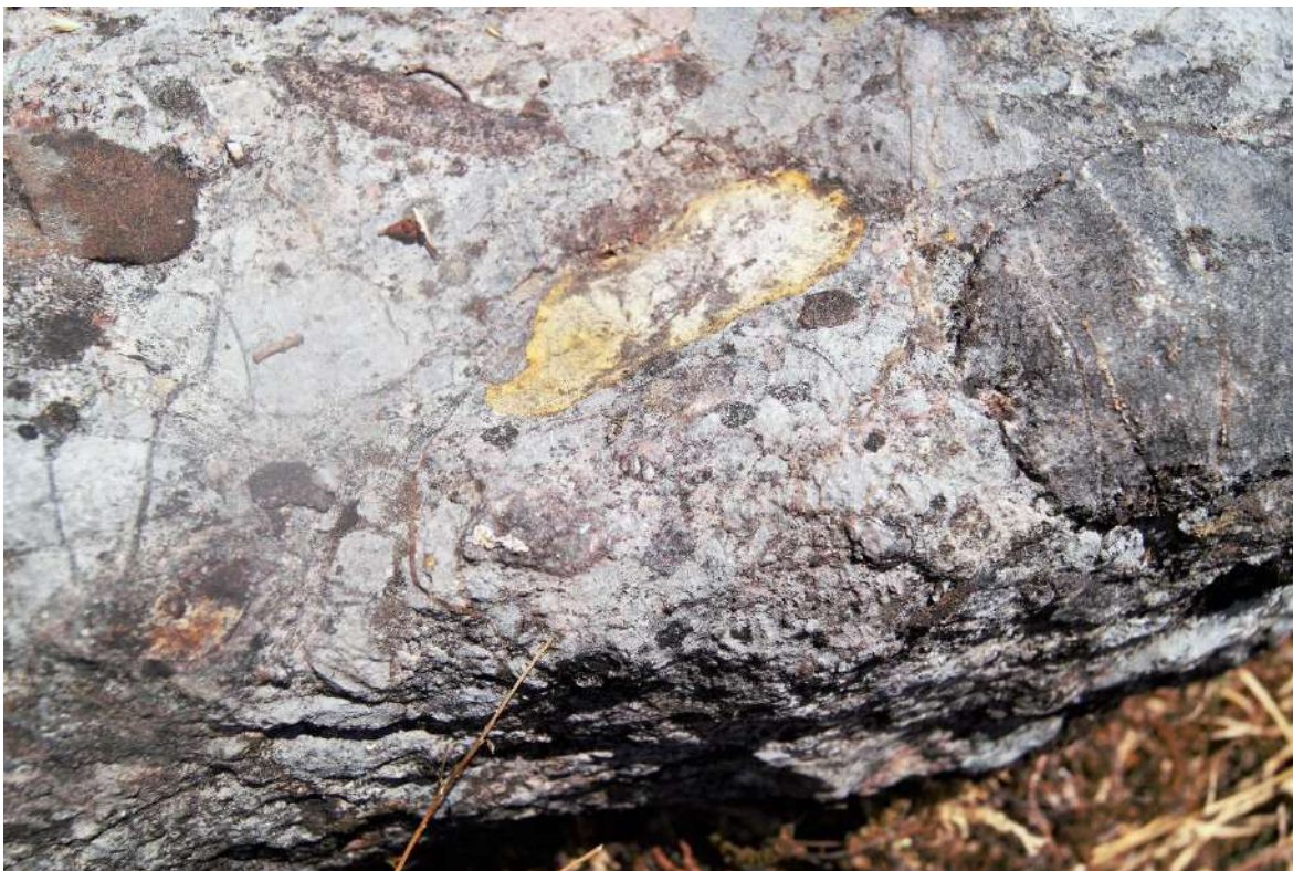
Foto 12. Sità dakó ne'ej 'en donde está puesto el pie del bebé', se le denomina así porque sobre una piedra hay una mancha que tiene la forma del pie de un bebé.

Hay un lugar que nos comenta que gracias a un acontecimiento que se suscitó ahí las mujeres adquirieron ese don de hacer tortillas pequeñas.