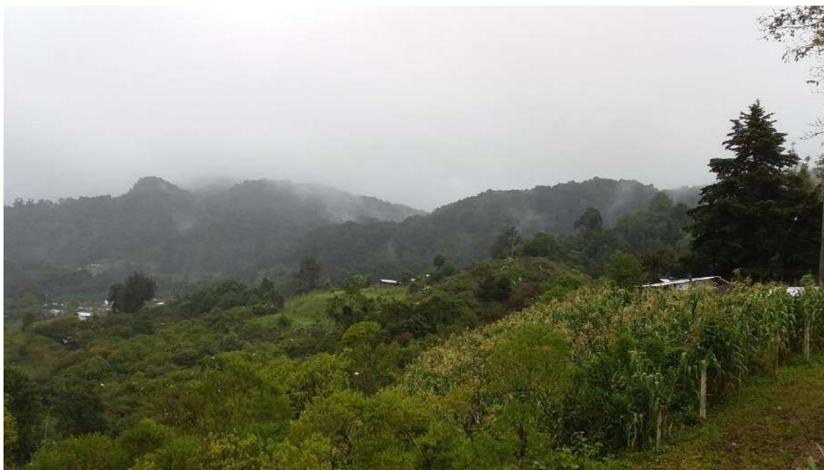
Foto 7. Dakūj sta'na 'cuesta del fantasma', así es denominado el lugar del fondo por estar escondido y con neblinas y en ese lugar espantaban anteriormente. Se localiza al oriente de Los Reyes Chichahuaxtla.

En estas denominaciones podemos encontrar significados de acontecimientos que se suscitaron en el pasado y se encontraron las siguientes: