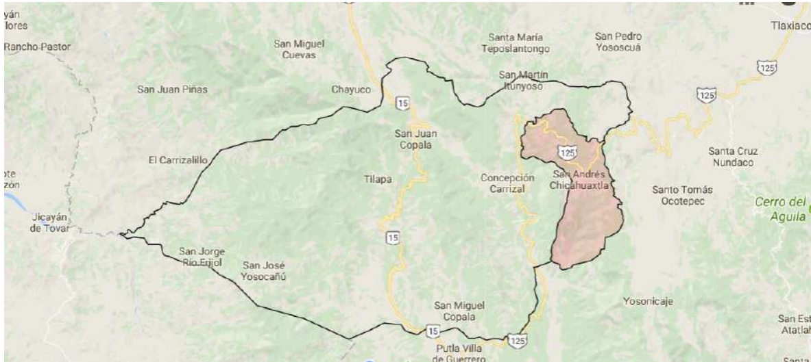
Mapa 2. Ubicación del núcleo agrario de San Andrés Chicahuaxtla.