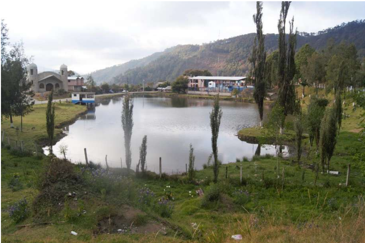
Foto 3. Du'ua dahuèe ‘en la boca (orilla) de la laguna’, así es denominada la comunidad de La laguna Guadalupe Putla.

Uno de los aspectos es la forma que tienen los lugares, por ejemplo, Kij yihioj ‘cerro comal’, Kij aga ‘cerro campana’ y kij chrùnj ‘cerro caja’, los cuales son cerros que están por la costa oaxaqueña rumbo a la comunidad tacuate de Santa María Zacatepec y desde el pueblo se aprecian con esas respectivas formas. El cerro comal tiene la cima aplanada que se asemeja a la forma de un comal, el cerro campana tiene esa forma cónica y el cerro caja con la forma de trapecio. Los nombres están relacionados con las figuras que tienen significado para los que los nombran, en este caso el comal es un utensilio muy importante en la vida mesoamericana, es un instrumento crucial para la alimentación y supervivencia; la campana, así como la caja, son menos importantes para la sobrevivencia, pero también