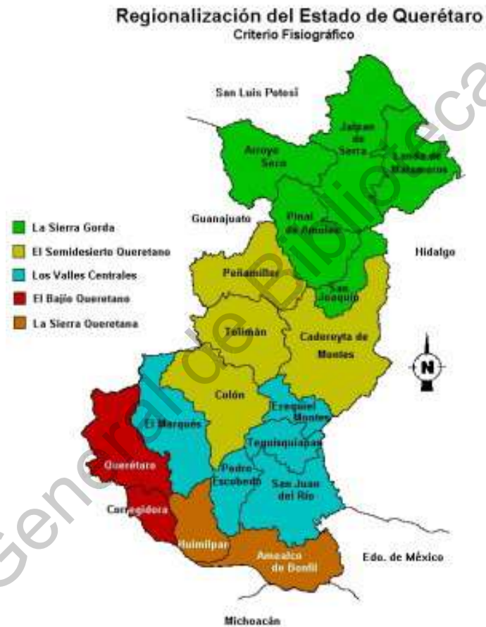
Imagen 2 Mapa Regiones de Querétaro, INAFED (s/f)

se puede observar como actualmente están divididos los municipios del estado de Querétaro. En verde se muestran los municipios que se consideran actualmente como conformadores de la Sierra Gorda Queretana.