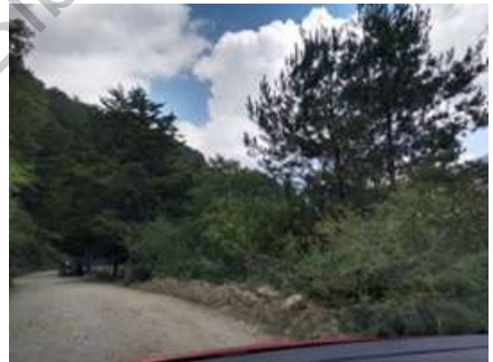
Imagen 7 Camino principal. Acervo Personal, 2018

El camino de terracería principal, el que baja de la carretera 120, está deteriorado por el creciente paso de turistas. Cuentan que en Semana Santa ha llegado tal saturación de vehículos estacionados, que ya ni pueden bajar más autos— hay baches y laja suelta, incluso algunos pequeños deslaves a la orilla de la ladera donde se forman pequeñas cascadas de agua en temporada de lluvias.