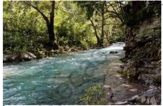
Imagen 5 Río San Miguel

El río cuenta principalmente con ácaros acuáticos (Hydrachnidia) y renacuajos, algunas aves como el Papamoscas rayado ( Myiodynastes maculatus ) y el Chipe ceja amarilla ( Dendroica graciae ) (Martínez & Mendoza, 2001).