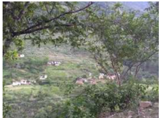
Imagen 6 Vista desde el camino principal.

En su mayoría son casas uni-planta de tabique blanco con techo de lámina o concreto, sin acabado y sin pintar, aunque si se pueden ver algunas pocas con aplanado y pintadas. El piso de las casas que visite es de concreto adentro y tierra aplanada en las terrazas/patios.