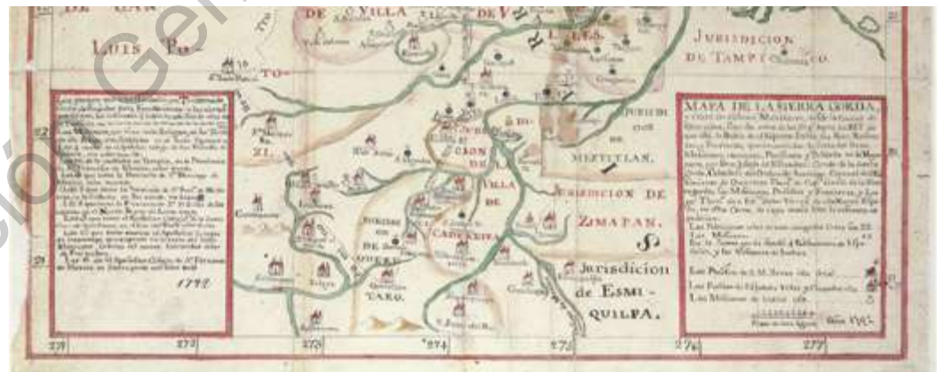
MAPA DE LA SIERRA GORDA Y COSTA DEL SENO MEXICANO.

En la historia de la conquista espiritual y material de la Nueva España aparece mencionada frecuentemente una región, asiento de numerosos indios bárbaros, que fue conocida con el nombre de la Sierra Gorda (Galaviz de Capdevielle, 1971, p.1).